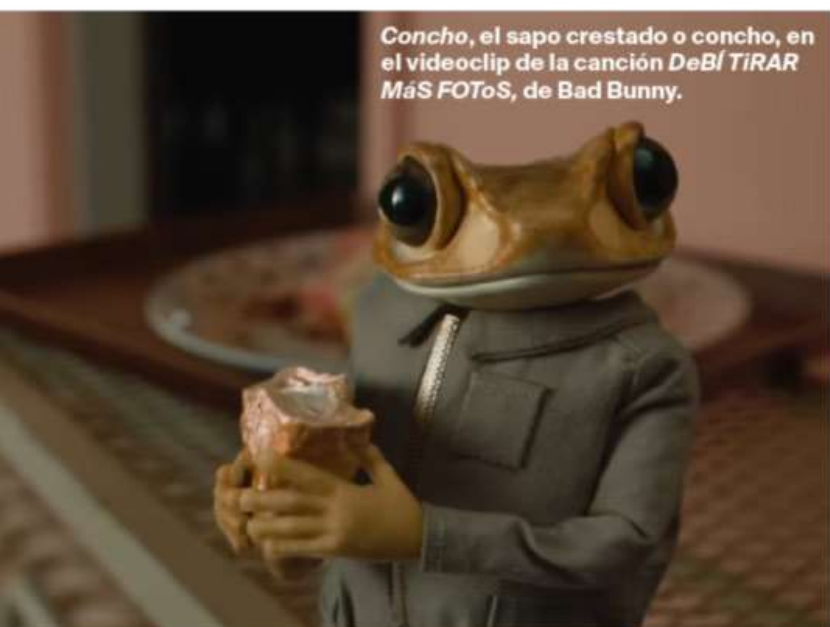
Concho, el sapo crestado o concho, en el videoclip de la canción DeBí TIRAR Más FOToS , de Bad Bunny.