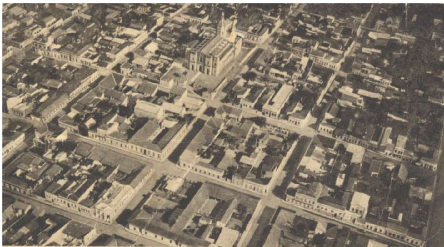
Asunción (Paraguay). — Iglesia y barrio de la Encarnación