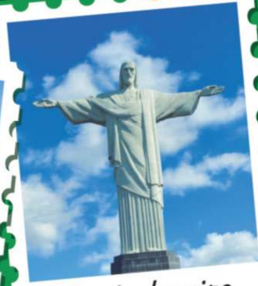
Rio de Janeiro