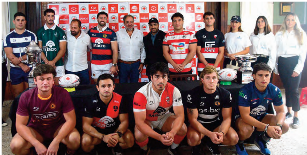
Se viene el clásico por el Top 10 "A". La tradicional foto de los capitanes de los 10 equipos participantes del torneo superior de la Unión Cordobesa.

La tradicional foto con los máximos referentes de los clubes participantes en el rugby provincial, marcó el inicio de la temporada 2025, en la que sobresale el duelo villamariense en la apertura.