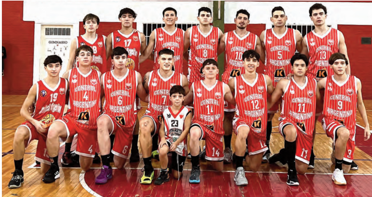
El elenco de Central Argentino vendió cara la derrota ante el invicto líder El Ceibo, que en el segundo cuarto llegó a sacar 22 puntos de diferencia, pero lo ganó 76-70.

El equipo de "La Flor Nacional" venció a Central Argentino por 76 a 70, y se mantiene invicto. El "Expreso Rojo" venía de vencer a Almafuerte