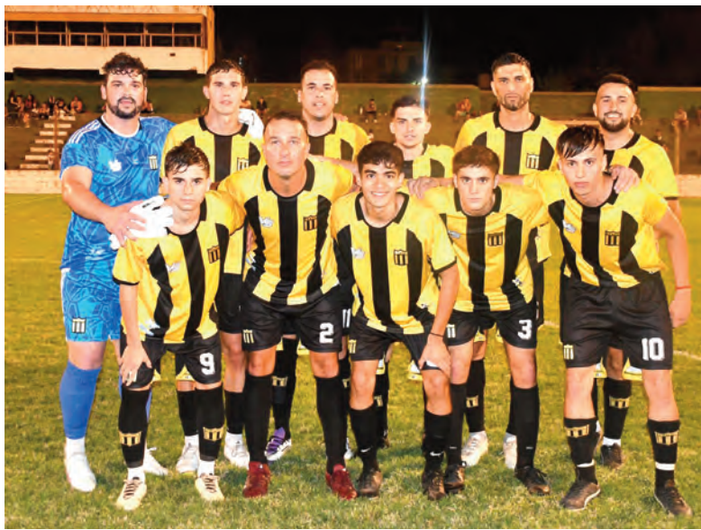
El equipo de Unión Central que resolvió el partido debut en los primeros 45' en Plaza Ocampo.

En tanto, San Martín de Vicuña Mackenna recibirá a Sportivo Isla Verde el domingo a las 17.30. Arbitrarán: Federico Valle con Luciano Cabrera y Ramiro Peralta. Cuarto juez: Sebastián Guevara (Liga de Laboulaye).