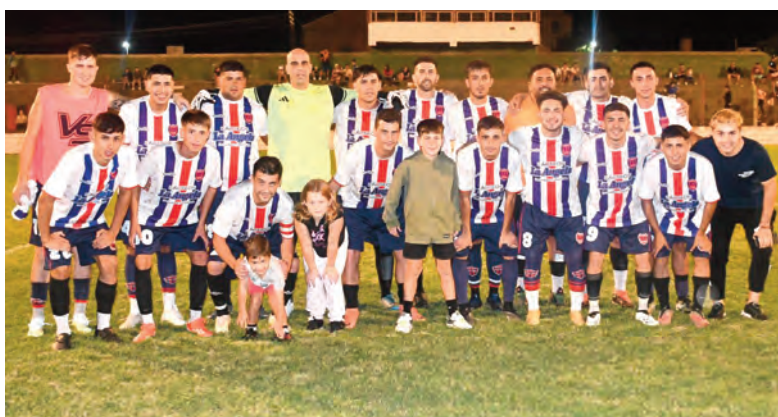
El plantel de San Lorenzo de Las Playas hizo su presentación en el Torneo Apertura 2025.

El "aurinegro" se llevó el triunfo en 45', y aunque un estupendo tiro libre de Franco Cerutti al ángulo superior derecho del seguro Pauletti, le permitió descontar, ya no había tiempo para el milagro del "santo", que luchó y se desangró ante el trabajo de "hormiga" de Unión, que debutó con festejo.