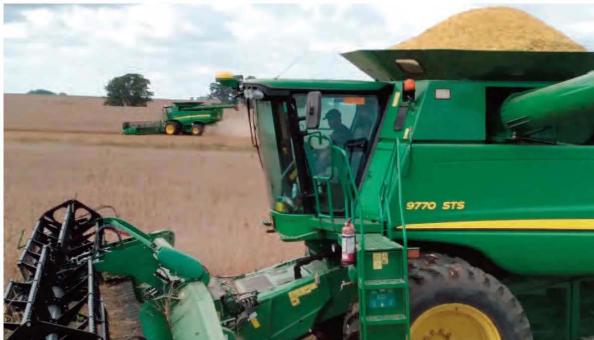
El centro sur y oeste de Córdoba asoma con mayor potencial productivo que el centro norte y el este.

Por su parte, la cosecha de maíz grano comercial tomó impulso tras el paso de los últimos frentes de tormenta. Hasta el momento, se recolectó el 13,6% del total nacional estimado, lo que significa un avance intersemanal de 5,5 puntos porcentuales, con un rendimiento promedio de 82,7 quintales por hectárea. En la zona norte del área agrícola, la falta de lluvias que predominó a lo largo de gran parte de la campaña gruesa ha generado una caída del 40% en los rendimientos esperados en compara-