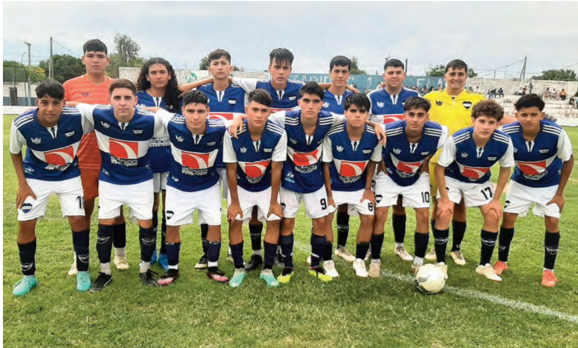
El elenco de Argentino, que se despachó con una contundente producción y goleó 7-0 a River en el debut. Esta noche recibe a las 20 a Española.

Además, hubo 3 empates: Juventud igualó ante Universitario 1-1, Unión Social 3-3 con Fray Nicasio