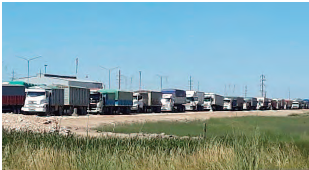
Largas filas de transportes de carga se observan en estos días para descargar en los puertos, especialmente los rosarinos.

El comienzo de la cosecha gruesa se siente en los puertos, especialmente por las cargas de maíz que dominan fuertemente