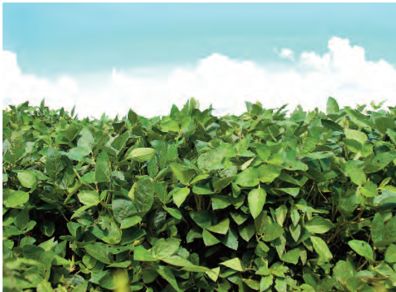
La soja sigue en torno a los 370 dólares por tonelada.