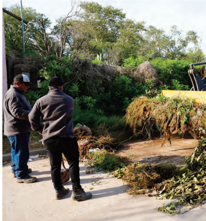
Se recolectaron residuos de hasta un metro cúbico de volumen.

Marcos hizo énfasis en que el objetivo es brindar el mejor servicio posible a la comunidad y hacer que la Terminal crezca en todos los aspectos posibles.