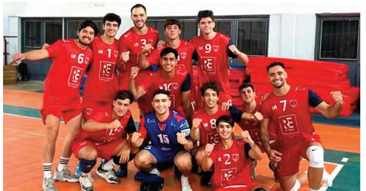
Trinitarios "barrió" con los triunfos en todos los duelos ante Polideportivo de Carlos Paz. La primera se impuso 3-0, y el viernes recibirá al campeón 2024, Rivadavia.

El viernes se miden los varones en el gimnasio de los "lecheros", que vencieron a Polideportivo en Carlos Paz. Las chicas también celebraron