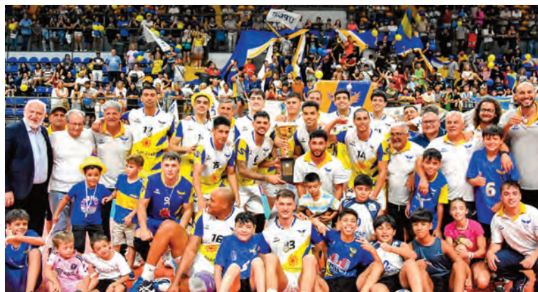
El festejo del elenco de UPCN, que logró invicto el campeonato, al ganar sus 15 encuentros.

VÓLEY. LIGA NACIONAL DE VOLEIBOL MASCULINA