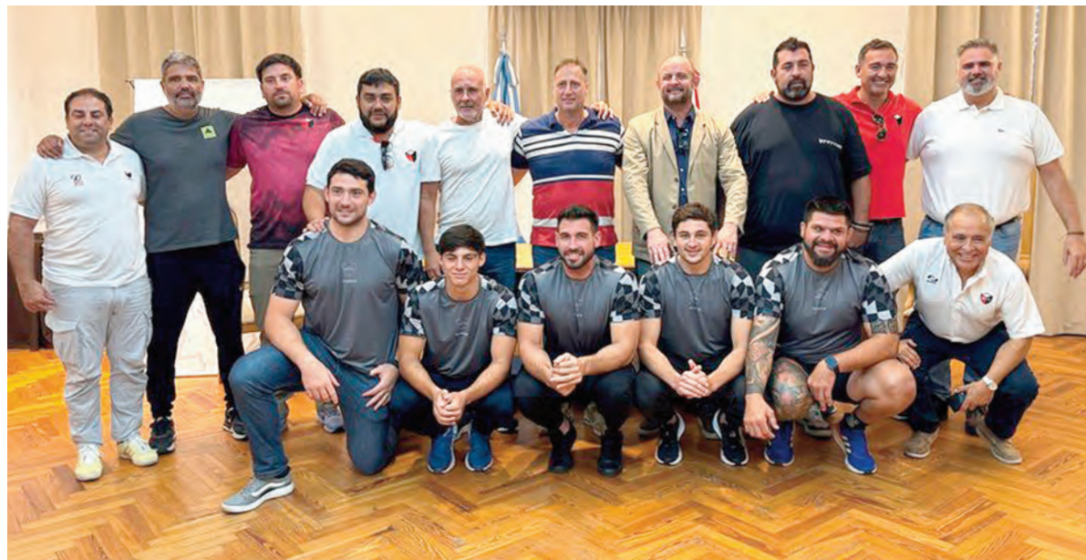
Autoridades del Ente de Deportes y del San Martín Rugby Club presentaron junto a dirigentes y jugadores la participación nacional. El "tricolor" debuta el sábado en casa.

El "tricolor" recibirá el sábado a las 16 a CPBM de Mendoza, mientras que la siguiente semana visitará a Jockey Club por el Torneo Top 10