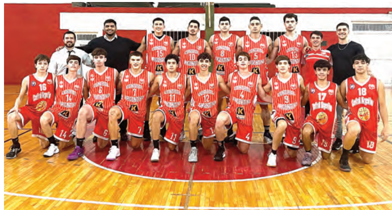
El elenco de Central Argentino que venció 85-72 a El Tala. El viernes visitará a Almafuerde.