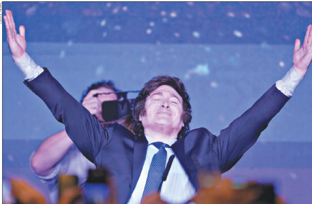
¿SE ANIMA? El Presidente impulsaría una reforma de la Constitución si logra un triunfo categórico en las legislativas de octubre. “Si no llena con votos las urnas, esto no camina”, dicen dirigente del PJ local.

Dentro y fuera del gobierno, oficialistas y opositores tienen opiniones divididas al hablar del supuesto proyecto. Por un lado, se encuentran los que dicen ignorar la iniciativa y no tener ningún tipo de información. “Yo no escuché nada”, aseguran esas voces que suenan desconcertadas. También están los que dicen que se tra-