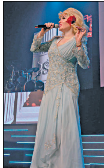
POLITICA. “En mi show hablo de todos los temas de actualidad”, aseguró la actriz.

presente profesional, su vínculo sentimental con el presidente Javier Milei y también del incidente que le tocó vivir con la Policía Caminera.