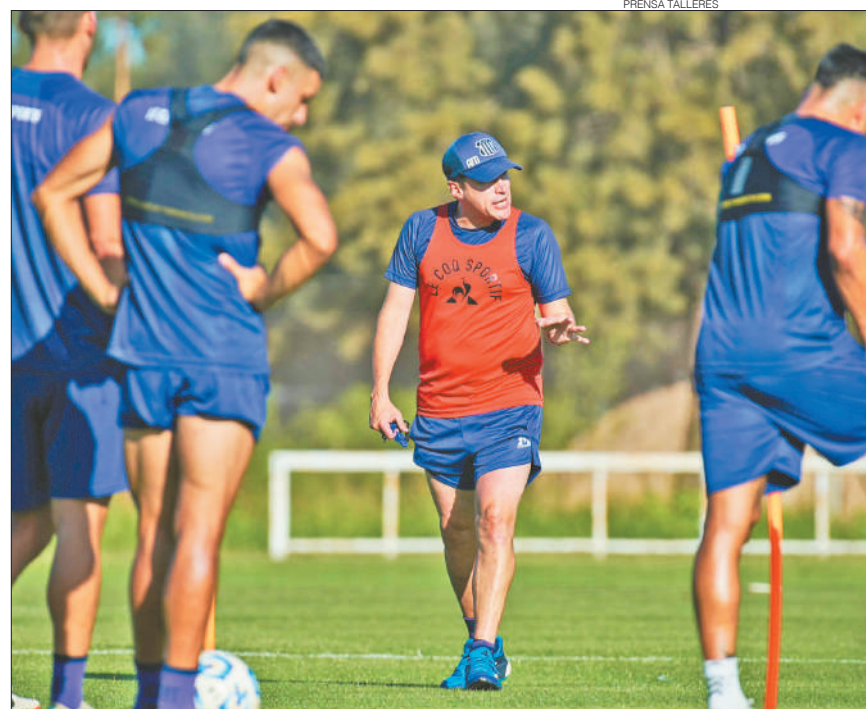
SIN CARAS NUEVAS. Recién al final de la pretemporada, el DT de Talleres Alexander Medina recibió novedades sobre refuerzos.