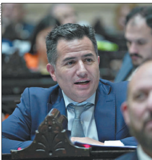
BORNORONI. El diputado por el oficialismo defendió la eliminación de las PASO al calificarlas como “un gasto obsceno”.