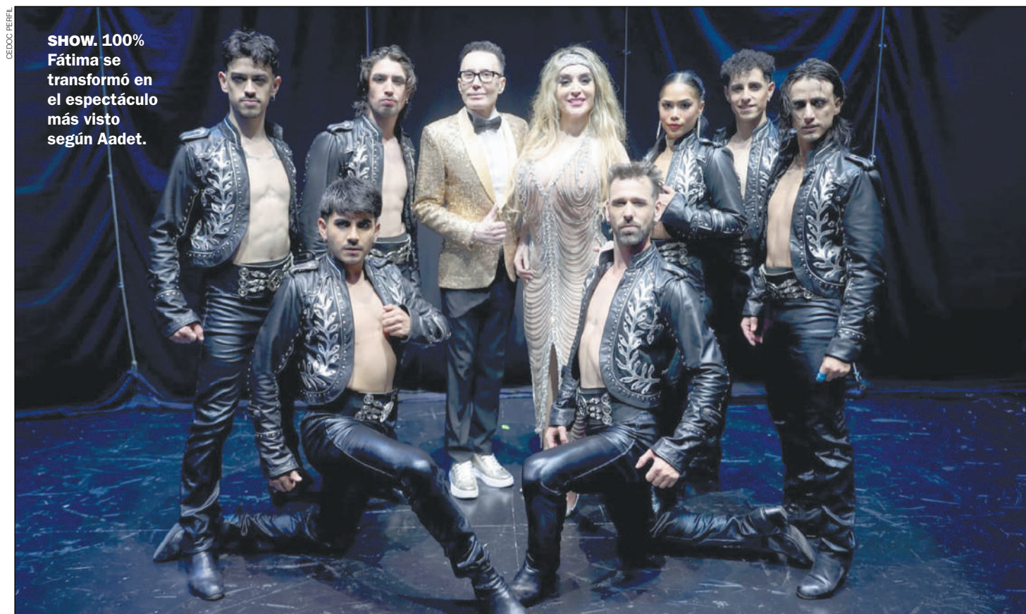
SHOW. 100% Fátima se transformó en el espectáculo más visto según Aadet.