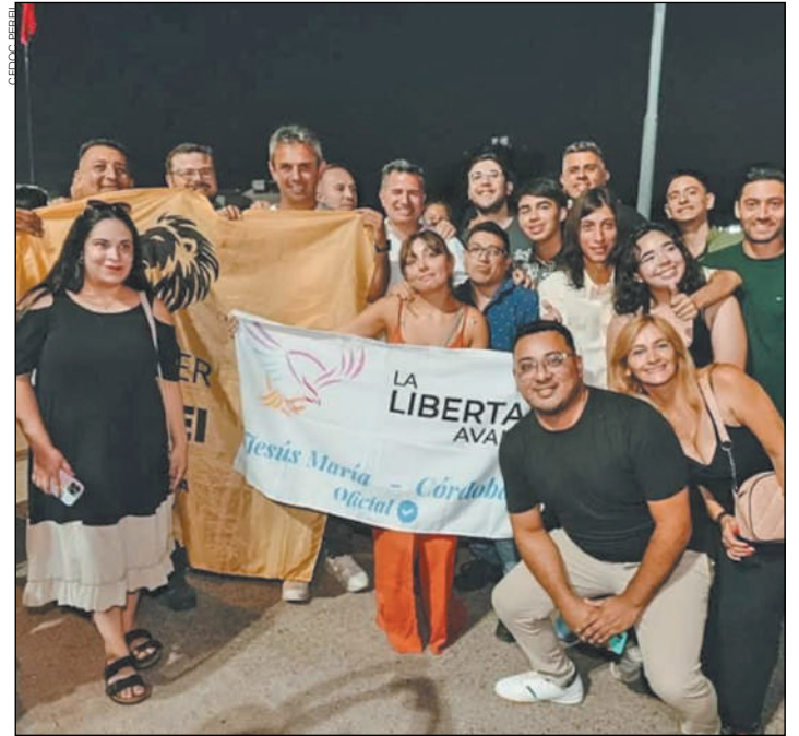
SELFIES. Durante el recorrido abundaron los pedidos de fotos que aceptaron sonrientes.