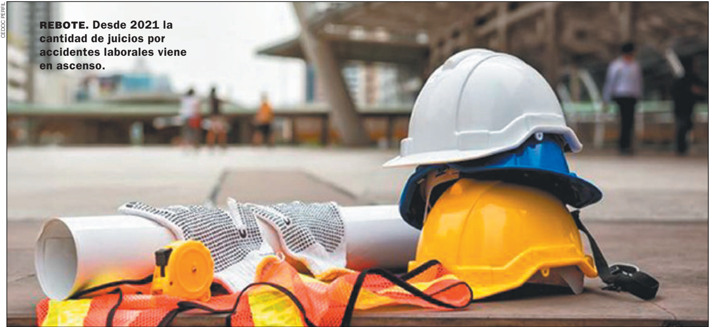
REBOTE. Desde 2021 la cantidad de juicios por accidentes laborales viene en ascenso.

Para las empresas que componen la Uart el “rebote” se explica, principalmente, porque las justicias de cada provincia y de Caba no avanzaron con la aplicación de la nueva Ley y con los dispositivos y herramientas que plantea, como