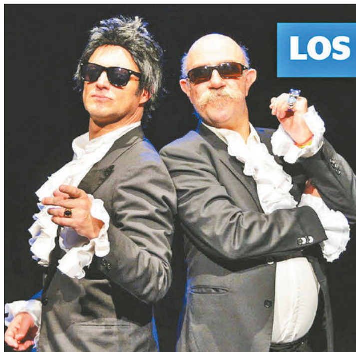
PARA RATO. “Los Modernos va a seguir, hemos envejecido bien artísticamente”, sostiene Orlando sobre el dúo.

ACTOR, SIEMPRE ACTOR. “El teatro es todo para mí. No puedo hacer otra cosa. Voy a seguir actuando hasta el día en que me muera”, dice.