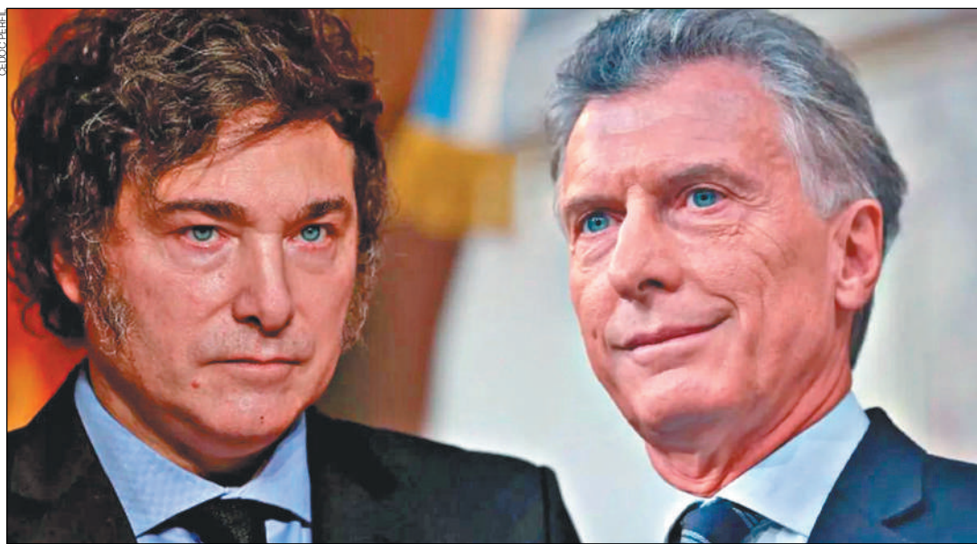
INCERTIDUMBRE. Aunque coinciden en general, las diferencias entre Milei y Macri podrían profundizarse con el paso de los meses.