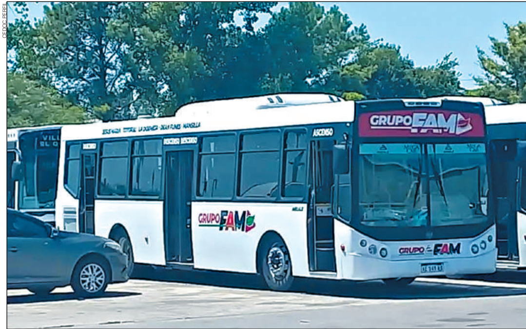
FAM. Las unidades ya comenzaron a verse en el predio de camino San Carlos.

Las cinco nuevas unidades de FAM que llegaron a Córdoba se instalaron en el predio de Ersa, ubicado en Camino San Carlos. Allí se encuentran, además, parte de las 350 unidades que la municipalidad le alquila a la empresa que abandonó raudamente a los usuarios. De esos coches solo salen a la calle unos 200. "Mil millones de pesos mensuales pa-