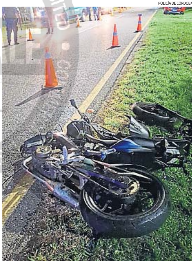
TRAGEDIA. El joven motociclista chocó contra un auto y un poste y luego murió.

por circunstancias por establecer, chocaron un VW Gol Power negro, conducido por un joven de 28 años, contra una motocicleta Rouser de 200 centímetros cúbicos, negra, en la que circulaba un muchacho de 21.