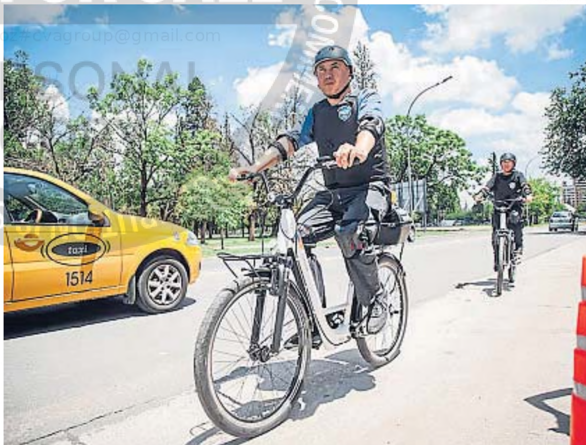
EN DOS RUEDAS. Primero, se las verá en la red de ciclovías de la ciudad de Córdoba. Luego, se sumarán otros corredores urbanos.

Las bicis eléctricas son un producto de la industria cordobesa, con más