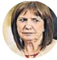
Patricia Bullrich Ministra de Seguridad de la Nación

"Hay temas que son parte de nuestra agenda y por eso va a haber un acompañamiento. Creemos que hay más coincidencias que diferencias (para la eliminación de las Paso)".