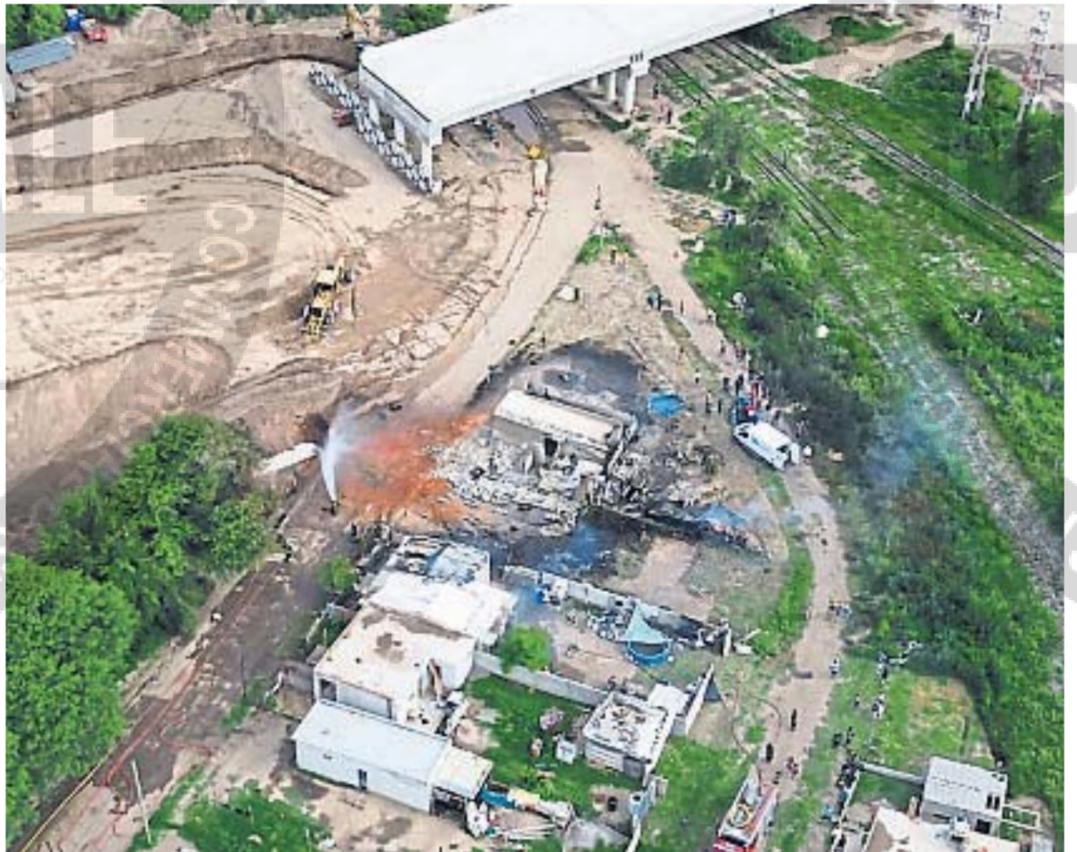
VISTA AÉREA. La onda expansiva alcanzó de lleno a la familia que vivía en una de las casas ubicadas cerca de las obras.

VILLA MARÍA. Mientras las cinco víctimas siguen internadas, dos graves, la fiscalía trabaja en la recolección de pruebas. No hay aún imputados. Provincia declaró el lugar zona de desastre.