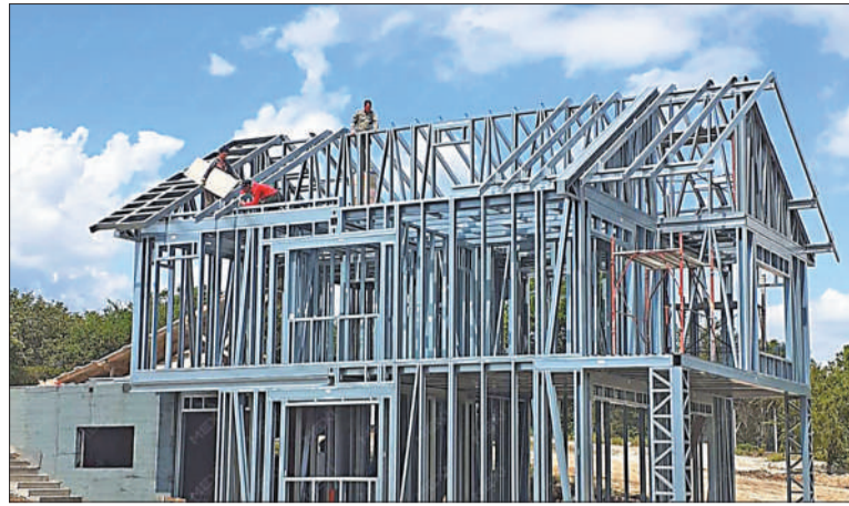
El acero galvanizado es un material que resiste a distintos climas y puede reciclarse. Los climas y puede reciclarse.

lución integral para la construcción de viviendas y edificios. Su nombre deriva de las palabras en inglés Steel -que significa acero- y Frame, que refiere a la estructura o armazón.