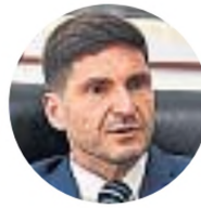
Maximiliano Pullaro Gobernador de Santa Fe

(En respuesta a Mercado Libre) "Acá no hay suba de impuestos, lo que no queremos es que sigan ganando de manera desleal los que venden en negro y hacen bicicleta financiera".