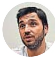
Ignacio Torres Gobernador de Chubut

(En respuesta a Mercado Libre) "Acá no hay suba de impuestos, lo que no queremos es que sigan ganando de manera desleal los que venden en negro y hacen bicicleta financiera".