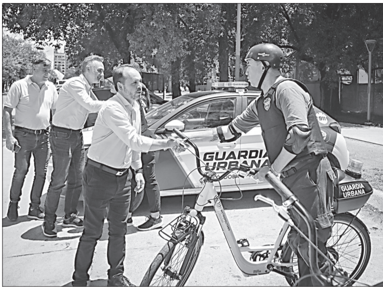
Con más de 100 bicicletas, la Guardia Urbana se desplazará por los parques.