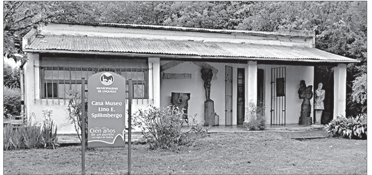
La Casa Museo Lineo Spilimbergo integra la grilla con actividades de 17 a 21.

Con la participación de múltiples artistas la localidad cordobesa celebrará un recorrido por la riqueza artística y cultural