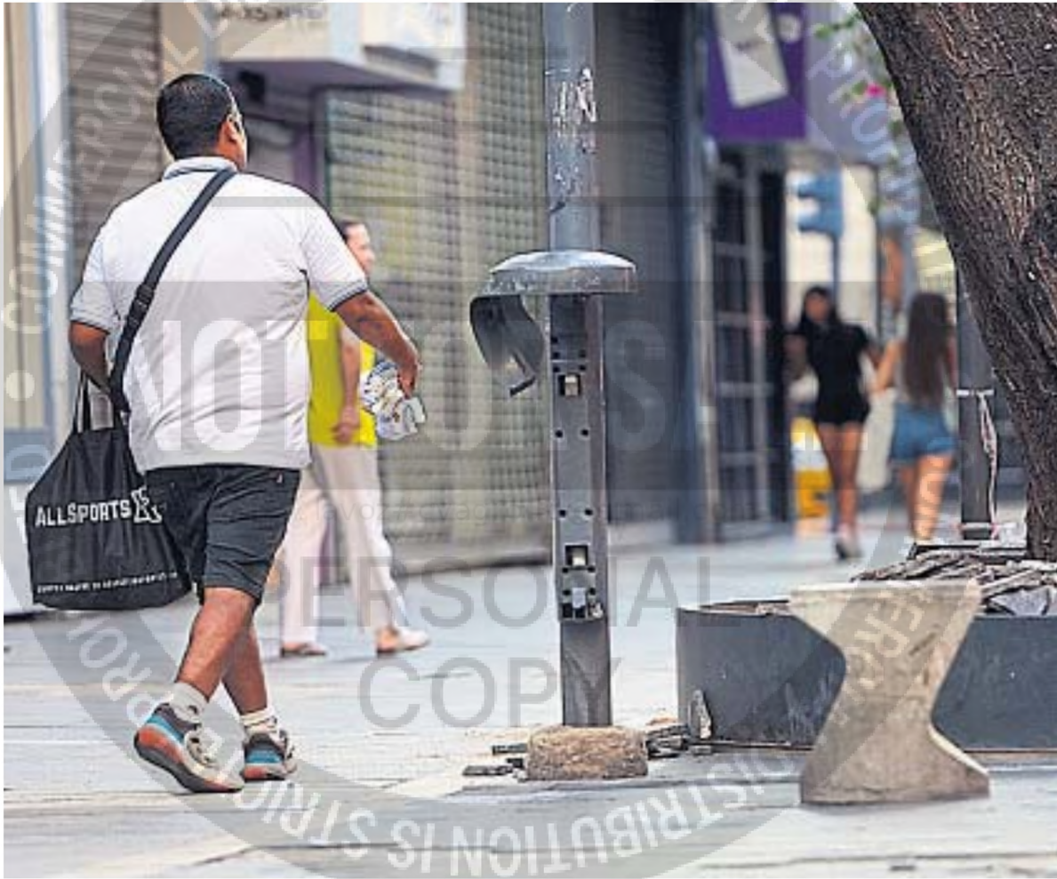
ROTO Y OLVIDADO. Era un cesto para residuos, pero hace tiempo que dejó de serlo. En la peatonal, quedan muy pocos usables.