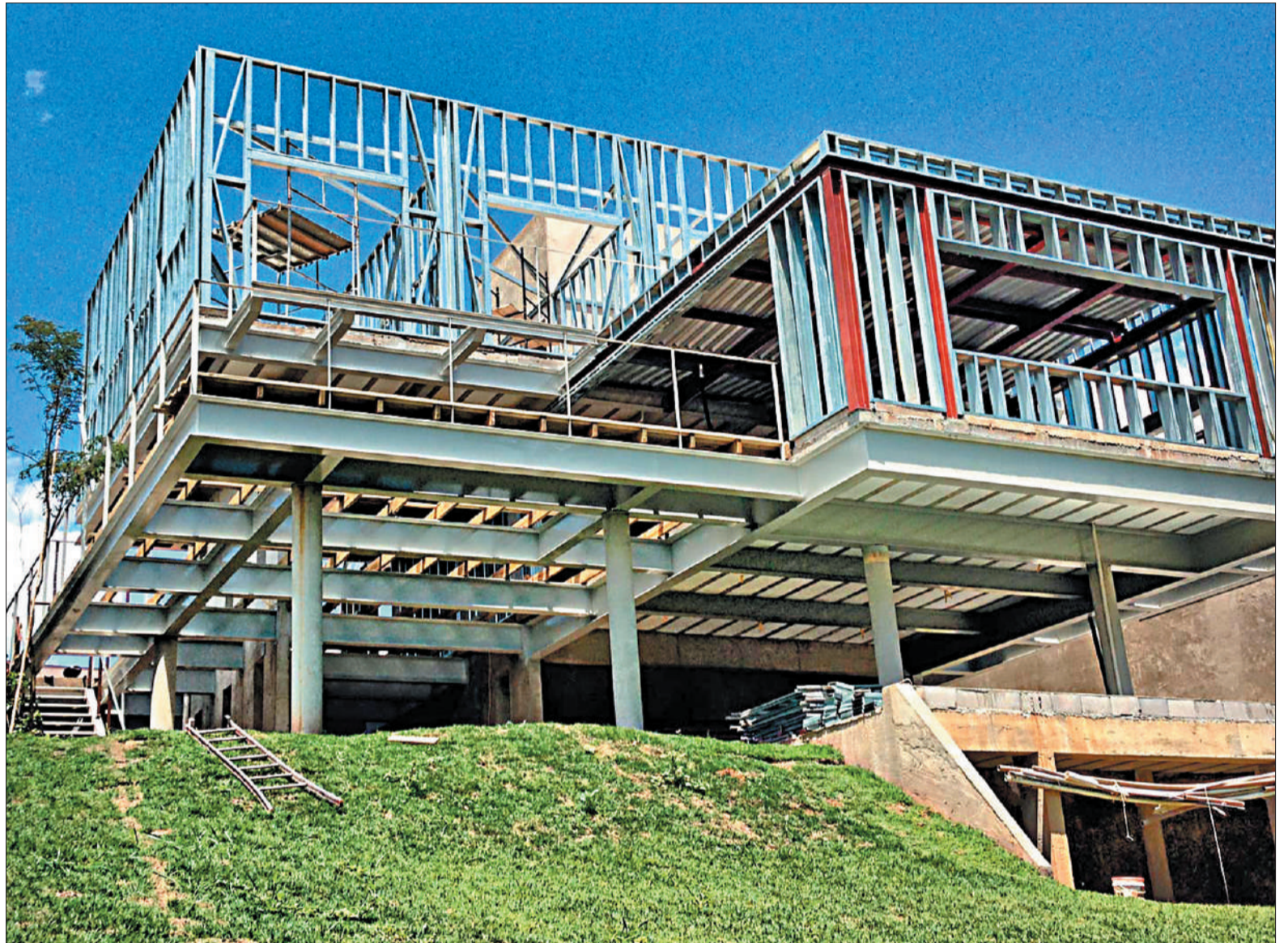
Se trata de un sistema constructivo eficiente, de alta resistencia y durable.

Lo primero a destacar es que se trata de un sistema constructivo en seco, que ofrece una so-