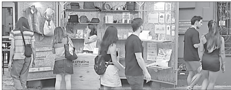
El espacio puede visitarse con entrada libre y gratuita.

Además de su circuito de verano, la Tienda Creativa seguirá funcionando en su espacio habitual, ubicado en la Recova del Cabildo (Independencia 30, Córdoba), con horario especial de verano: de lunes a viernes de 10 a 14. Allí, más de 113 diseñadores locales exhiben sus creaciones en áreas como diseño, artes visuales, artesanía, editorial y gastronomía. Para más información sobre las actividades y propuestas de la Tienda Creativa, las personas interesadas pueden escribir a tiedacreativacba@gmail.com o visitar su cuenta de Instagram.