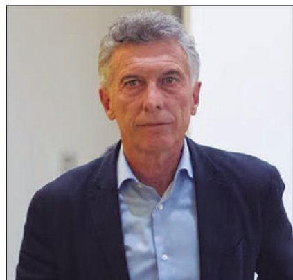
Macri comandó la reunión junto a otros dirigentes de peso del PRO.

■ En medio del pase masivo de dirigentes al oficialismo, el macrismo anunció su apoyo a LLA ■ Acompañarán los proyectos de la Casa Rosada en el Congreso ■ Juez reiteró su intención de representar al Presidente en Córdoba / PÁGINA 3