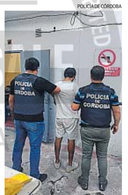
DETENIDO. El sospechoso fue detenido en la ciudad de Villa Carlos Paz.

El dinero, en principio, no ha sido recuperado. La pesquisa judicial continúa a paso firme y no se descartan más novedades.*