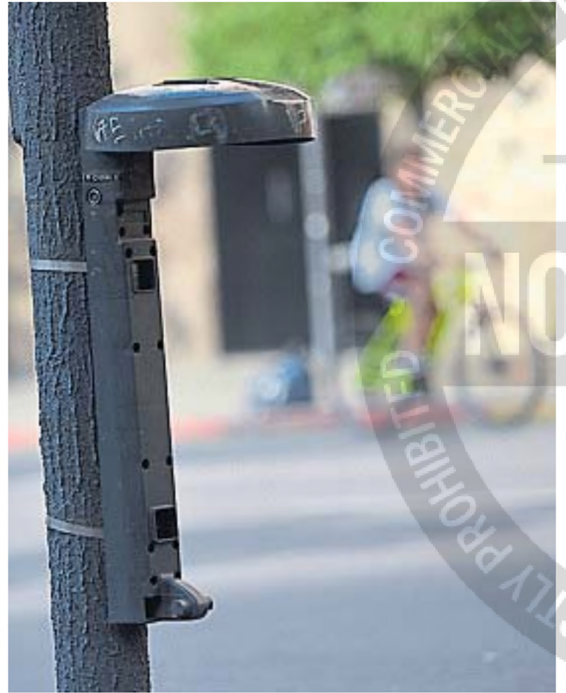
SE FUE. Atada a un árbol, fuera de norma, una parte de un cesto que ya no está.