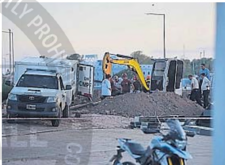
TRAGEDIA. En 2019, un operario murió en la obra de la Legislatura de Córdoba.

Por otro lado, otros dos resultaron lesionados en medio de las obras que se realizaban en el puente que cruza el lago San Roque.