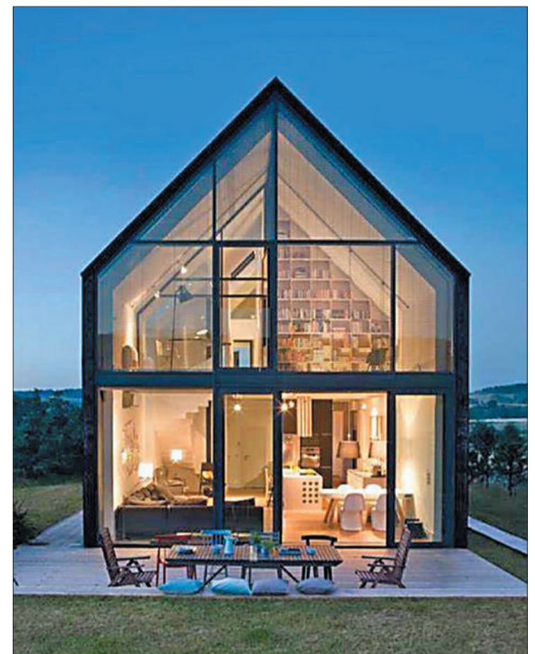
Admite cualquier estilo arquitectónico, incluso techo a dos aguas.