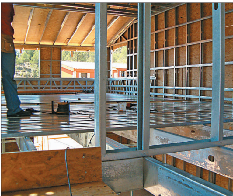
Las edificaciones en altura pueden alcanzar hasta tres pisos.