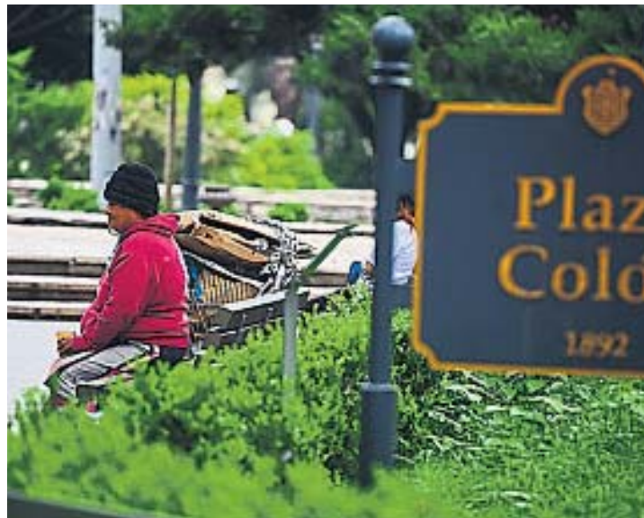
PLAZA COLÓN. Tras su remodelación, se pobló de personas en situación de calle.