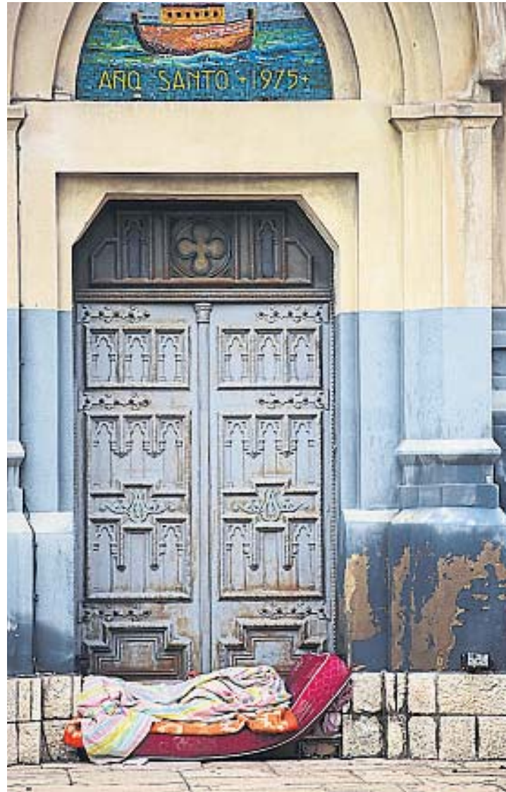
EN LA PUERTA. Un colchón contra una de las puertas de la iglesia María Auxiliadora.

municipio, junto con el área social de la Provincia, Defensoría del Pueblo, entre otras instituciones, desde la pandemia de coronavirus a esta parte se produjo un incremento de las zonas por donde deambulan: ya no sólo es el por el microcentro o Centro de la ciudad.