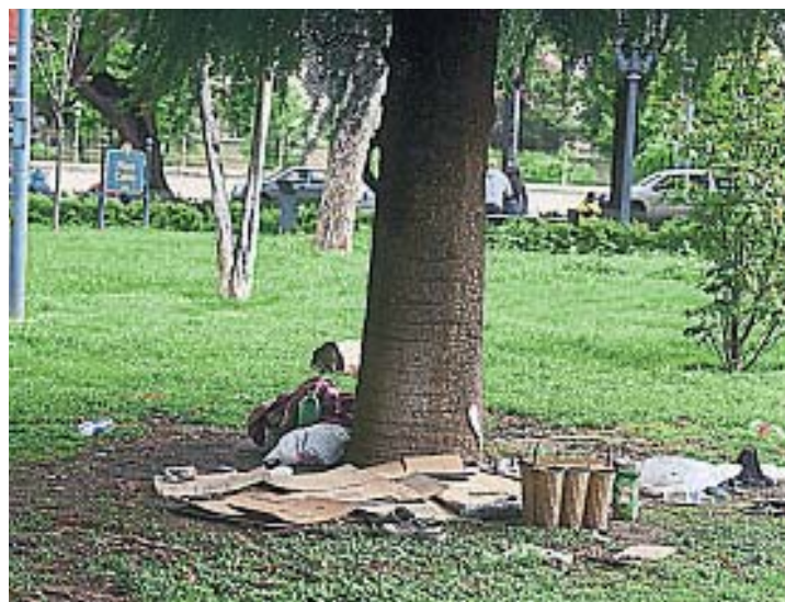
ACAMPE. Los espacios verdes del área central albergan a cada vez más "sin casas".

limpia y evita despertar a jóvenes que duermen en bancos. Expresa que no los puede desalojar y eso molesta a las personas que usan la plaza como esparcimiento.