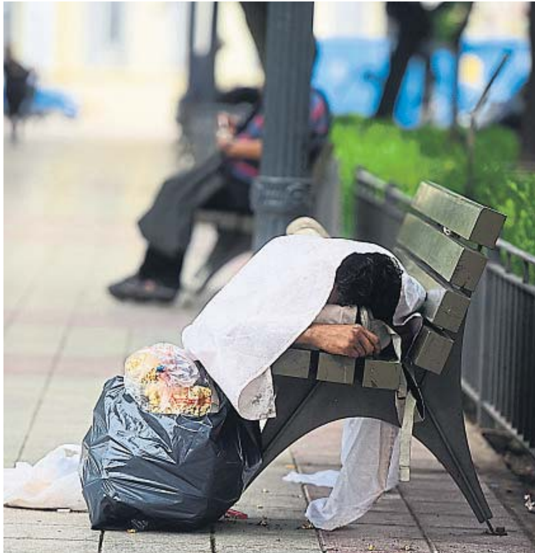
BANCO CAMA. Uno de los bancos de la plaza Colón es usado como cama para descansar, a cualquier hora del día.

En la Plaza de Los Niños, entre calles Balcarce y Corrientes, a poca