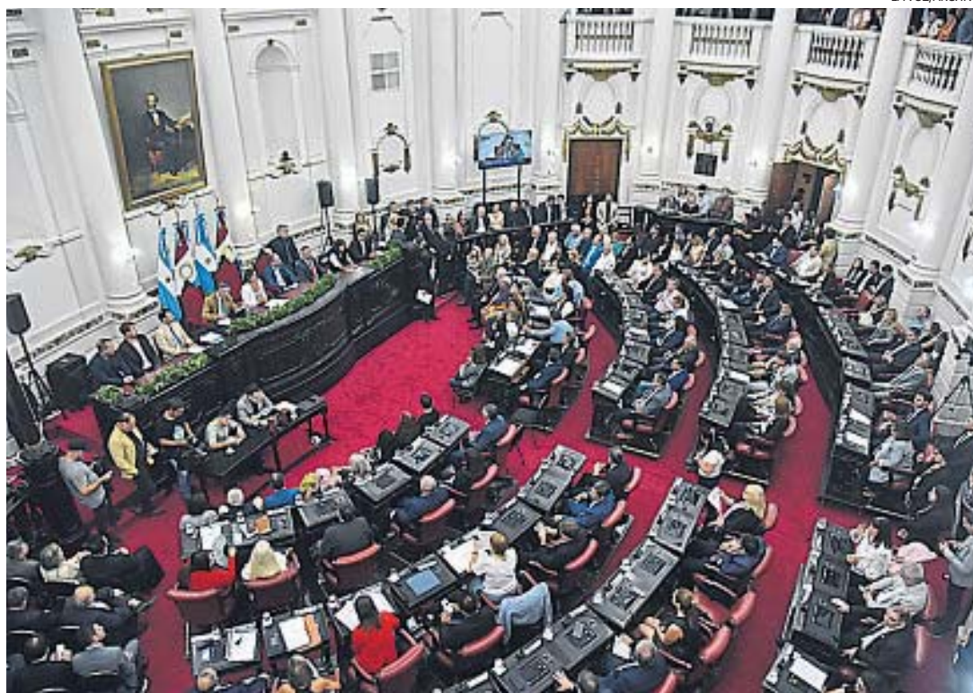
REVUELO. La Unicameral finalmente dio los nombres de los contratados que La Voz reclama desde hace dos meses y medio.

LISTADO. A un mes y medio del pedido de información realizado por La Voz del Interior al Poder Legislativo, se publicaron en el portal de Datos Abiertos los nombres de los asesores: 343 para los 70 legisladores y otros 711 a los que no se les especificó tarea.