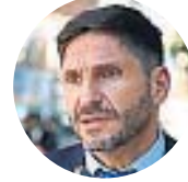
Maximiliano Pullaro Gobernador de Santa Fe

"Nosotros tenemos una esperanza muy grande de que los partidos que hoy gobiernan las provincias de la Región Centro podamos tener un programa de gobierno común".