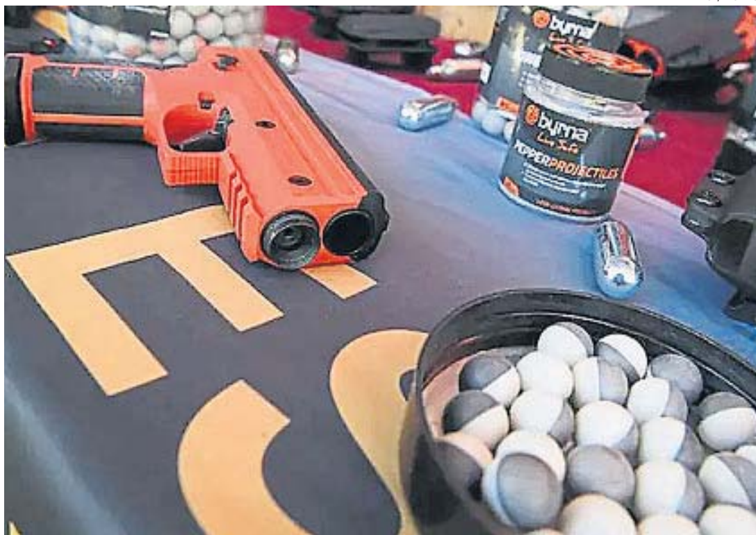
ESAS SON. Las pistolas marca Byrna que ya utiliza la Policía de Córdoba y que ahora empiezan a usar algunos agentes municipales.

Pero el funcionario además aclaró que no está decidida su aplicación por ahora: “Todavía no hay una posición tomada en ese sentido. En este momento, estamos preparando una capacitación con la Defensoría del Pueblo sobre la resolución pacífica