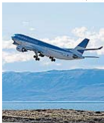
SERVICIO. Aerolíneas Argentinas será la encargada de ofrecer este vuelo.