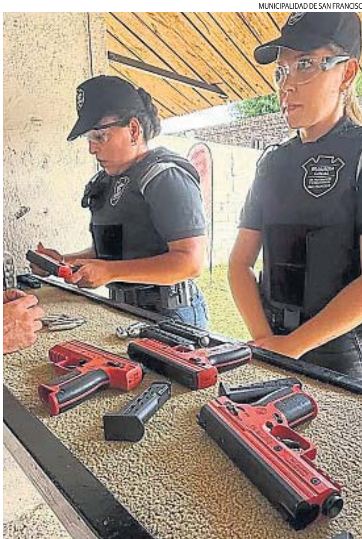
SAN FRANCISCO. Empleadas municipales de la Guardia Urbana, en capacitación.

de conflictos y la mediación comunitaria. Son herramientas que tienen que ver más con el diálogo y con una aproximación preventiva”, señaló.