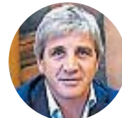
Luis Caputo Ministro de Economía

"Pasás de querer cerrar el Banco Central a fortalecer su balance, pidiéndole dólares al FMI (...). Pasás de votar en contra del acuerdo con el FMI en 2022 a pedirle U$S 20 mil millones".