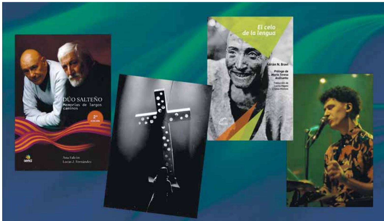
El Dúo, Sor Angélica, ensayo y música para volar.

La ciudad se brinda hoy como un abanico de culturas para halagar los oídos, los años y los géneros, ya que todo está hecho de la materia del tiempo