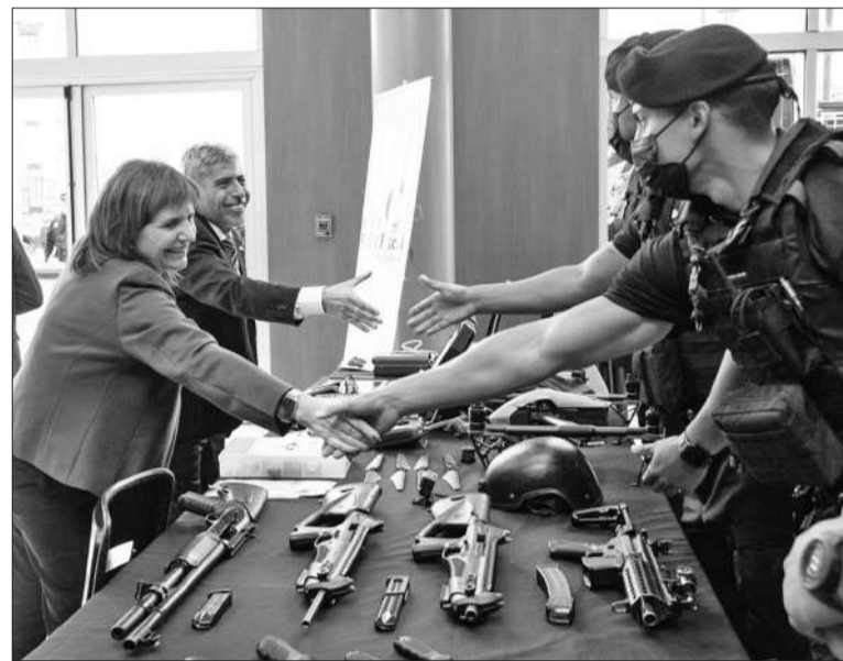
Las fuerzas de seguridad cordobesas recibieron a la ministra Bullrich.

Según la ministra, la Ley Anti Barras transformará el escenario del fútbol argentino, estableciendo un marco legal más estricto para erradicar la violencia. Al respecto, Bullrich había señalado hace unas semanas que el proyecto busca "prohibirle la entrada a la cancha permite acabar con negociados entre clubes y barras. El 2024 fue el año más importante en derecho de admisión, en gente que no pudo entrar a los estadios.