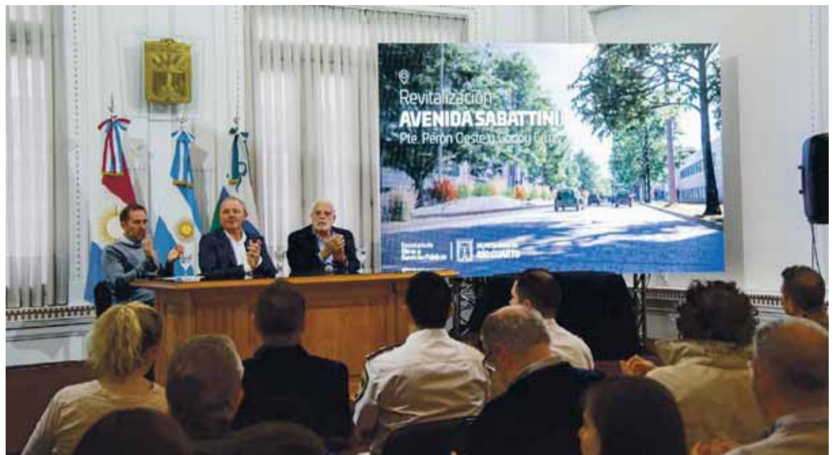
La obra sobre Avenida Sabattini, principal ingreso a la ciudad desde el sur, tendrá un costo aproximado de 388 millones de pesos.