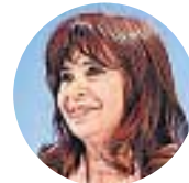
Cristina Kirchner Expresidenta

"Nosotros tenemos una esperanza muy grande de que los partidos que hoy gobiernan las provincias de la Región Centro podamos tener un programa de gobierno común".