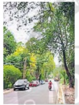
LISTA. La calle con pavimento mejora la conexión entre dos ciudades vecinas.

SIERRAS CHICAS. La obra, ejecutada por el Ente Metropolitano, abarca 900 metros de calle Cárcano, entre San Martín y Brasil.