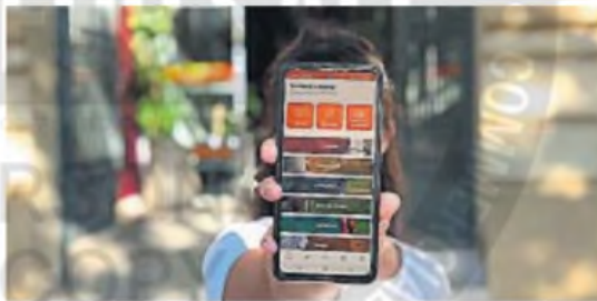
EN EL "CELU". Todos los vecinos podrán acceder a la conexión con el municipio.

Para ello, cada usuario tendrá que registrar sus animales domésticos con nombre, características y una fotografía.