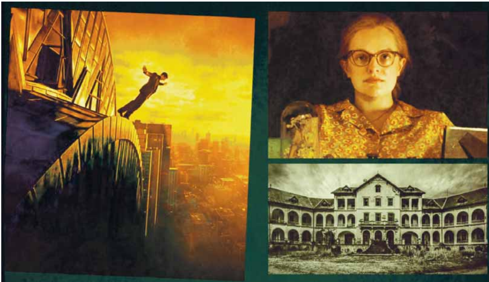
"Megalópolis", "Shirley" y "Pabellón Tornú", rozando zonas oscuras.

Lo que ofrece hoy para disfrutar, entretenerse y festejar, traza un dibujo que une películas, un teatro no convencional, la inauguración de una muestra y una celebración chayera.