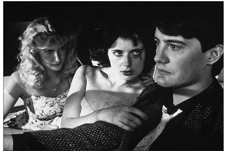
Tercipelo azul (Blue Velvet) de David Lynch se proyectará el sábado a las 16.

■ Llegamos al sábado 1°, y a partir de las 16 disfrutaremos de Tercipelo Azul (Blue Velvet), de 1986, obra cumbre de Lynch, con Kyle MacLachlan e Isabella Rossellini.