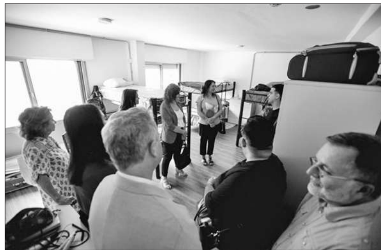
La residencia tiene nueve pisos, que incluyen una sala de estudios.

En total, el complejo albergará a 135 estudiantes que pasaron el proceso de selección a cargo de profesionales del Departamento