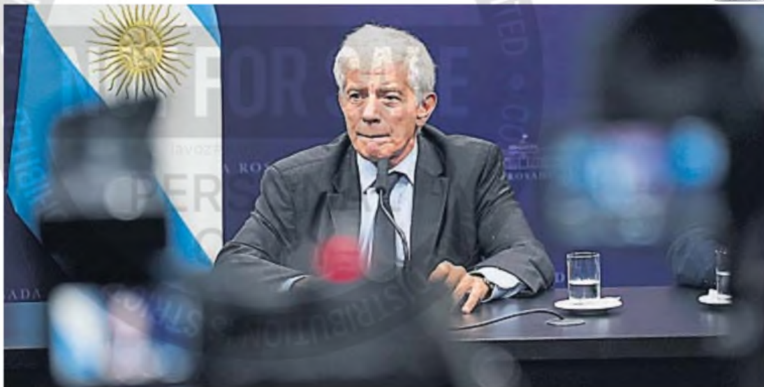
CÚNEO LIBARONA. El ministro de Justicia fue una de las voces oficiales que ayer salieron a respaldar la decisión de Milei de nombrar por decreto a dos jueces para la Corte.