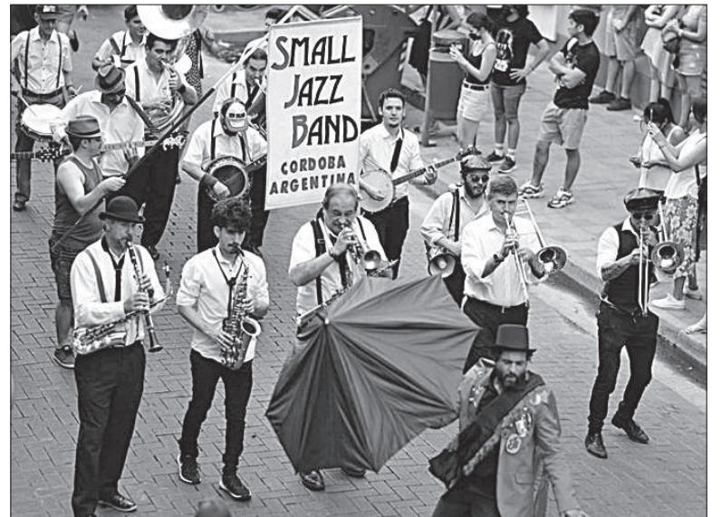
La Small Jazz Band será la atracción principal del desfile por calle Belgrano.

Refiere a que era el último día para disfrutar de los placeres tanto culinarios como musicales en sociedad, antes de la época de abstinencia que marca el inicio de la Cuaresma y la Semana Santa.