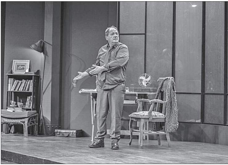
La obra de Chávez tuvo gran crítica y aceptación del público cordobés.