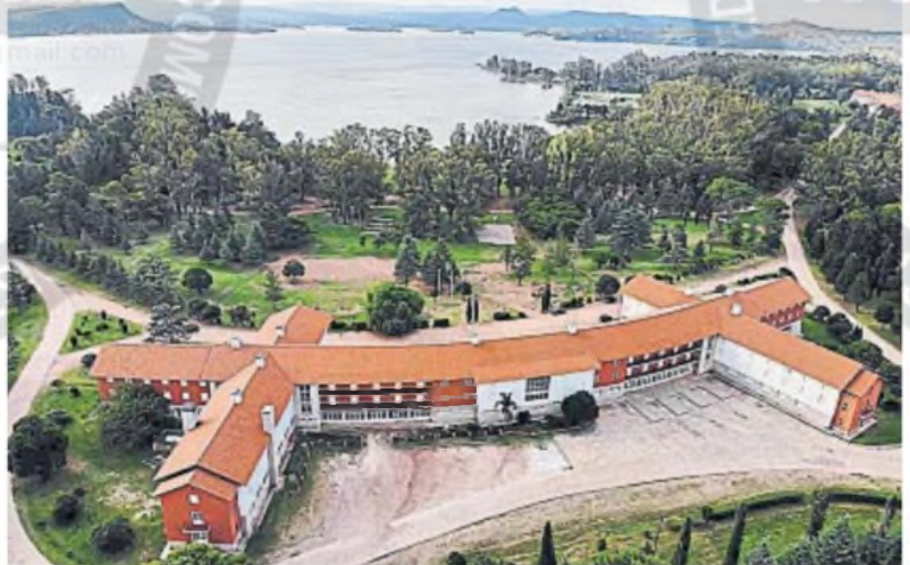
EMBALSE. Uno de los grandes siete hoteles, en un predio de 300 hectáreas junto al lago. Sólo dos están operativos actualmente.

El histórico complejo inaugurado en la década de 1950 cuenta con siete unidades y medio centenar de bungalows, polideportivo, piscinas, capilla, policlínico y un extenso espacio verde junto al mayor lago de Córdoba. En su época de apogeo, entre las décadas de 1960 y 1970, supo alojar hasta a 2.500 turistas, generalmente de sectores sociales vulnerables o delegaciones de estudiantes o jubilados. Desde los años '90 se inició una etapa de deterioro y desinversión, con menos mantenimiento y ya menor disponibilidad de plazas. 2024 fue el año de menor actividad.