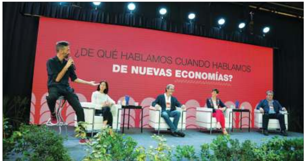
PROGRAMA. Contará con más de veinte referentes nacionales e internacionales.

Se trata del evento "Futuros Posibles: Nuevas Economías y Estrategias de Transición" que se desarrollará del 13 al 15 de marzo en el Pabellón Argentina y reunirá a una veintena de referentes nacionales e internacionales