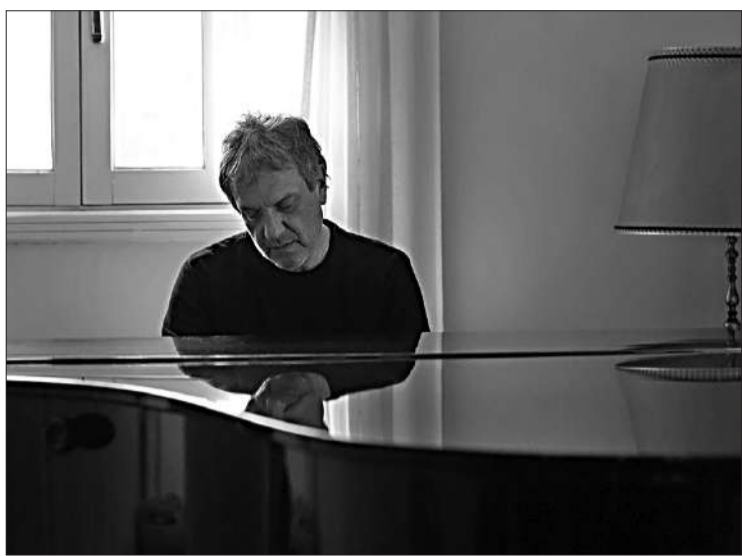
El co-creador de Los Músicos del Centro presenta “Piano y Silencio”.

Como una manifestación, la cantautora argentina visualizó de cierta manera esta colaboración. Por su parte Camilo cuenta cómo fue que conectó para unirse a esta colaboración. “Me pareció una manera muy honesta sin pretensiones de tener una conversación con uno mismo. Me vi a mí mismo en esa canción, más que cantándola y como un artista siendo parte de la canción”, revela Camilo. “Me vi a mí, mi historia y mi vida en esa canción. Me vi reflejado. Es el poder de la canción y es muy lindo ver cómo me pasó a mí”.