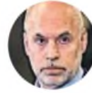
H. Rodríguez Larreta Exjefe de Gobierno de Caba

"Lamentablemente, el PRO ha perdido su identidad. El saber quiénes somos, por qué estamos aquí, por qué hacemos lo que hacemos y a favor y en contra de qué cosas estamos".