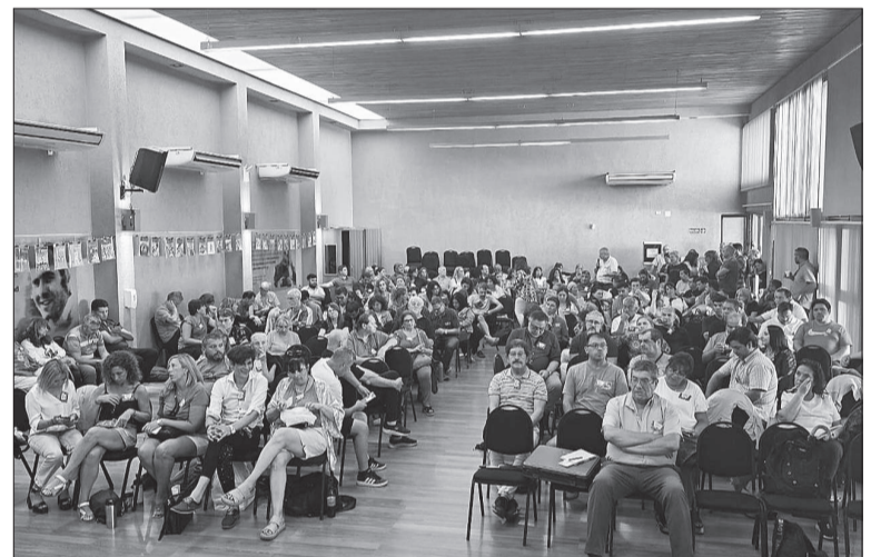
Los delegados departamentales rechazaron por amplio margen la oferta.

Otro de los puntos reclamados por el sindicato fue "que se incorpore un adelanto de pauta y cláusula de revisión en julio y noviembre, para que se produzca un real recupero del poder adquisitivo" y que "en la propuesta se establezcan los meses en los que se producirá todo el