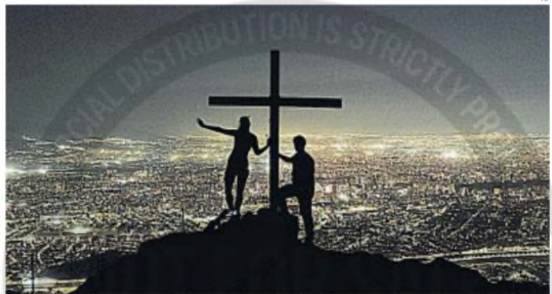
Santiago de Chile, desde Manquehuito

Dos personas paradas en la cima del cerro Manquehuito, desde donde se ve todo Santiago de Chile, en plena noche.