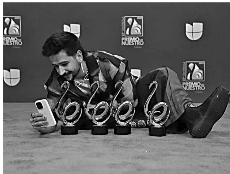
Camilo vuelve a Córdoba a presentar su nuevo trabajo, llamado “Cuatro”.

Recordemos que el joven artista está casado con Evaluna Montaner, la hija del legendario cantante venezolano (de origen argentino) Ricardo Montaner. Y que como tal, se ha unido a la perfección al clan familiar que encabeza su suegro. Y es que tanto su noviazgo, como su casamiento, la luna de miel, la primera casa y el nacimiento de la hija de ambos, Índigo, no solo fueron viralizados y compartidos por millones