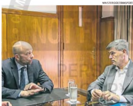
REUNIÓN. El secretario de Transporte de la Nación y el intendente de Córdoba, ayer

Además de las validadoras en las unidades de transporte, la Municipa-