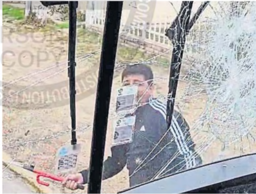
VIOLENCIA. El agresor fue captado por un celular. Finalmente, fue condenado en los Tribunales II.

Pero no lo hizo por mucho tiempo, ya que de inmediato se dirigió hasta su automóvil con el fin de buscar una barra trabavolante, con la que volvió hasta el colectivo y le rompió el cris-