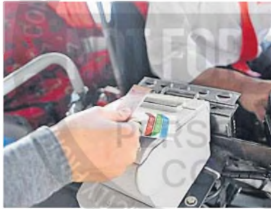
BENEFICIO. Muchos chicos no podrían estudiar sin el Boleto Educativo Cordobés.

"Estos operativos son fundamentales para que toda la comunidad educativa conozca cómo acceder al Boleto Educativo Cordobés y, además, para que los vecinos del sector