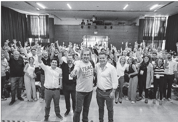
En el acto se instó a recorrer localidades y defender las ideas de Milei.