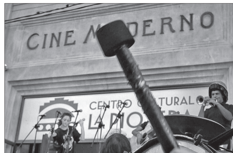
Frente a La Piojera hubo un festival en reclamo por la falta de recursos.