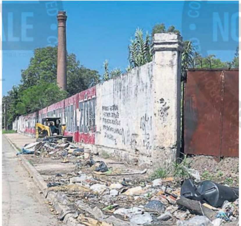
DESPERDICIOS. La triste postal que ofrece el sector: muchísima basura acumulada, con la chimenea de la excervecería de fondo.