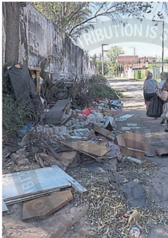
INSALUBRE. Los vecinos aseguran que entre la basura hay ratas y alimañas.