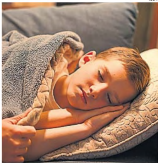
ADORMIR. Finalizadas las vacaciones, los chicos deben recuperar rutinas de sueño.

Desde los gremios especificaron que "la medida de fuerza responde a la tardía convocatoria a la paritaria nacional; por el no cumplimiento de la Ley de Financiamiento Educativo y del Fond; por el no envío de fondos para las universidades; por la falta de recursos para infraestructura, capacitación, conectividad y becas estudiantiles que hoy están congelados y no se cumplen".