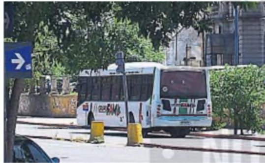
DEBUT. El grupo FAM se suma desde hoy a la operación de varios corredores urbanos.

Las negociaciones entre la Unión Tranviaria Automotor (UTA), la empresa y la Municipalidad de Córdoba lograron que 980 trabajadores pasen al nuevo operario del servicio de transporte.