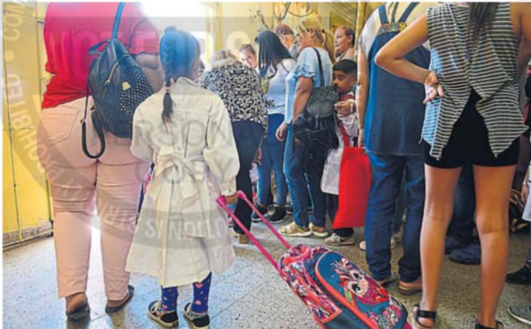
ACOMPANIAMIENTO. Para chicas y chicos, el primer día de clases es un momento de mucha ansiedad y lo recomendable es que se sientan apoyados por sus padres