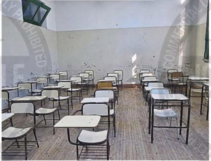
VACÍAS. El primer día de clases muchas aulas no podrán recibir a alumnas y alumnos, ya que sus docentes estarán de paro.

La vuelta a clases, más allá de los útiles y los uniformes, implica restablecer un pilar fundamental para el bienestar de niños y adolescentes: el descanso. La organización, los hábitos saludables y el acompañamiento familiar serán esenciales para transitar este regreso de la mejor manera.