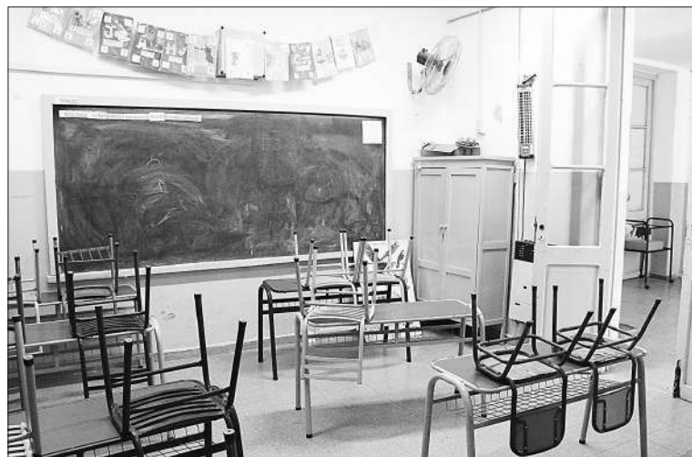
El inicio del ciclo lectivo se verá interrumpido por un reclamo salarial.

Las escuelas de la provincia iniciaron ayer el Período de Ambientación, que culminará este viernes, y del que participan más de 216.000 estudiantes que ingresan por primera vez a sala de 3 y 4 (40.506) años en nivel inicial, primer grado en nivel primario (57.249), y primer (64.167) y cuarto año (54.692) en nivel secundario (orientado y técnico). Esta instancia, establecida por el Ministerio de Educación de la Provincia de Córdoba, forma parte del calendario para el ciclo lectivo 2025. El Período de Ambientación tiene como objetivo acompañar a estudiantes y familias en su adaptación al nuevo nivel educativo, facilitando el primer acercamiento a las dinámicas escolares y promoviendo la construcción de vínculos pedagógicos y sociales con compañeros y docentes. Las actividades previstas abordan tanto el proceso de integración de los estudiantes como las inquietudes de las familias y docentes. El ministro de Educación, Horacio Ferrera, destacó: "La ambientación forma parte del inicio de las actividades escolares, de recibir a los nuevos, de hacerle lugar, de escucharlos, orientarlos".