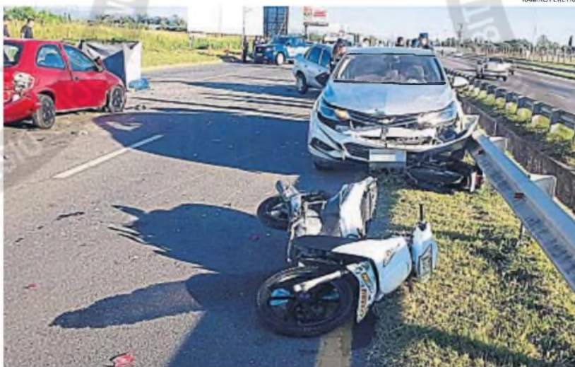
DRAMA VIAL. La trágica colisión ocurrió en la madrugada de ayer en la avenida La Voz del Interior, a la altura del aeropuerto.

Esta imputación es inferior a otro tipo de delito para siniestros viales: el homicidio simple por dolo eventual.