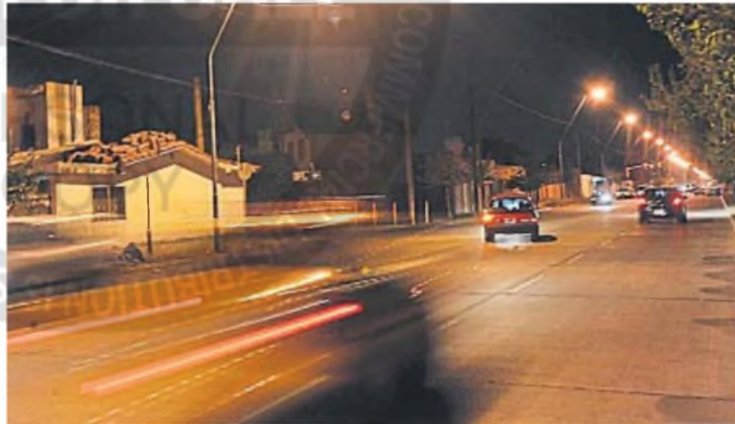
A TODA VELOCIDAD. Las picadas ilegales se realizan por lo general de noche y convocan entre 50 y 100 autos por carrera

"Empezaron en el parque Sarmiento, luego se trasladaron a avenida Valparaíso, a la UTN, la avenida Armada Argentina y, finalmente, volvieron al aeropuerto", detalló. A