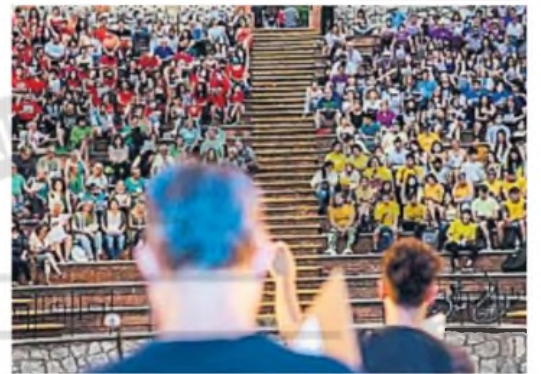
TEATRO GRIEGO. El espacio cultural va camino a cumplir un siglo.

Además, el conjunto cordobés Sin Límites Folk compartirá escena con La Forestal de la Danza, academia que lleva 33 años enseñando danzas folklóricas. La jornada se completará con Caporales San Simón, la Academia y José Baltazar