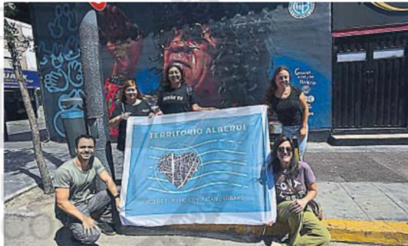
BARRIO CON HISTORIA. El equipo de Territorio Alberdi, listos para el primer recorrido musical de 2025