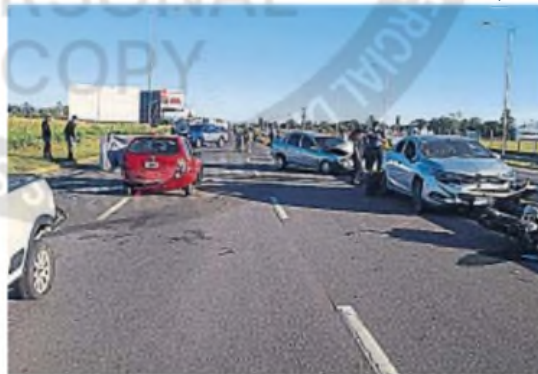
NOCHES LIBERADAS. El descontrol de las picadas, ante los ojos de todos.

tes y vecinos a las fuerzas de seguridad.