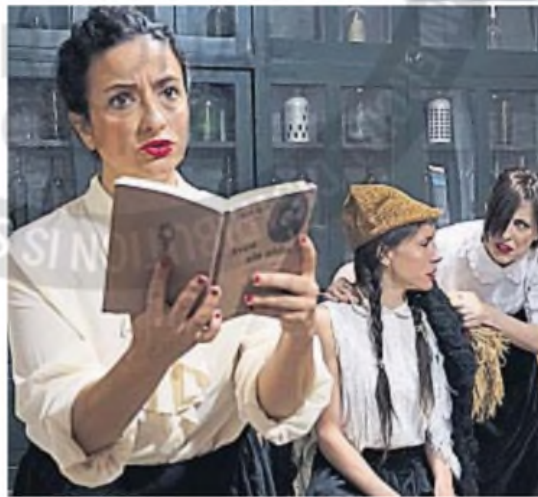
"SERAFINAS": Una obra sobre las primeras huelgas de mujeres.

Cada una de las obras seleccionadas rescata voces femeninas que han sido invisibilizadas. "Hay artistas que fueron ocultadas, mujeres que participaron en la historia argentina y no son tan nombradas como los varones, luchas sufragistas, cuestiones de salud femenina... Son temas que han sido tabú o poco explorados", señala