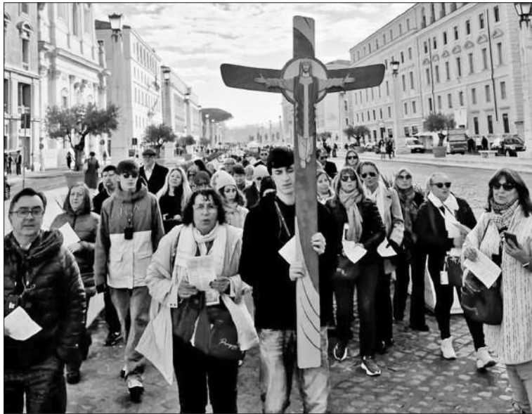
La delegación de riocuartenses apoya a Francisco desde Roma.

Un intendente radical reflexionaba al teléfono que estas movidas tienen un efecto peligroso para la cúpula capitalina del partido: por un lado obtienen visibilidad pública con un tema pero siguen perdiendo confianza en la amplia red de jefes comunales de la UCR: “es fácil hacer política en los medios cuando no tenés la obligación de gestionar el día a día de un municipio” dijo resignado.