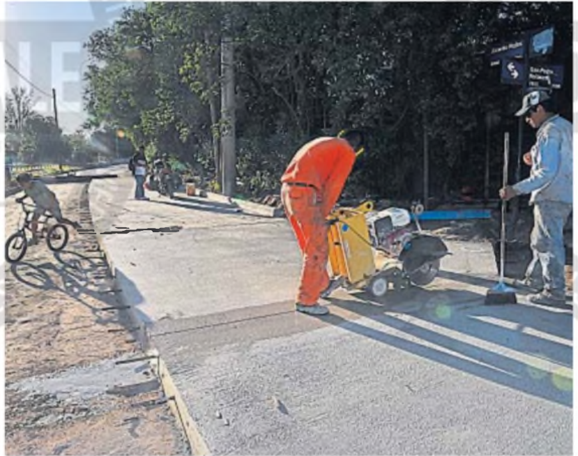
800 CUADRAS. El plan se lanzó a finales del año pasado, y apunta a asfaltar un total de 800 cuadras en la ciudad de Córdoba.

Según los datos oficiales, la Capital cuenta con 25.285 cuadras pavimentadas y 8.294 cuadras de suelo firme natural.