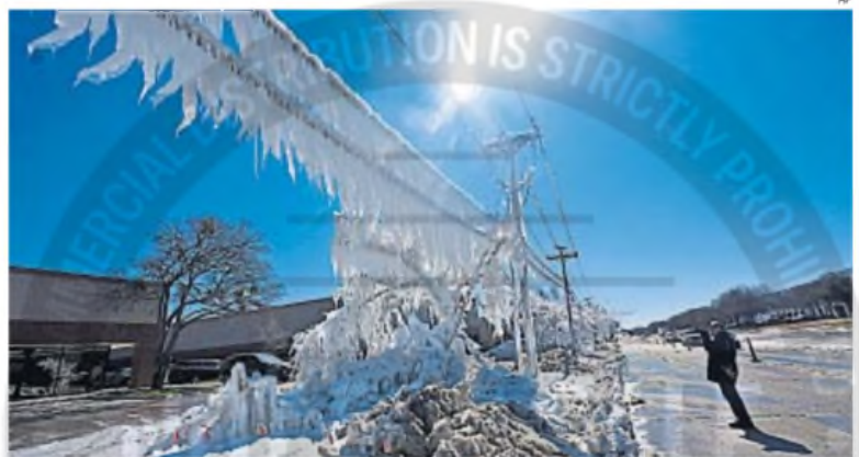
Extrañas figuras de la nieve en Texas

El hielo causado por la rotura de un conducto de agua y las bajas temperaturas cubren la vegetación y las líneas eléctricas en Carrolton, Texas