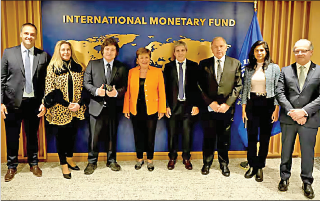
La comitiva argentina a pleno, antes de ingresar a la reunión con el equipo del Fondo Monetario.