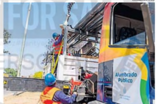
ALUMBRADO. Se subasta el mantenimiento del año junto al recambio de luces.

Las obras también incluyen mantenimiento de la red existente y mejoras en sectores que presentan problemas recurrentes de iluminación. "Queremos garantizar que cada barrio cuente con un alumbrado eficiente y acorde a las necesidades actuales", concluyó.