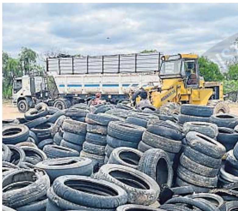
MOSQUITO. Los neumáticos a la intemperie se convierten en criaderos de mosquitos.

Desde el Ministerio de Ambiente informaron que la recolección de neumáticos fuera de uso se realiza de manera programada en coordinación con los municipios adheridos al plan. Una vez acopiados, son trasladados a distintas empresas que los reutilizan en procesos productivos. Entre los principales destinos de estos materiales se encuentran las plantas de