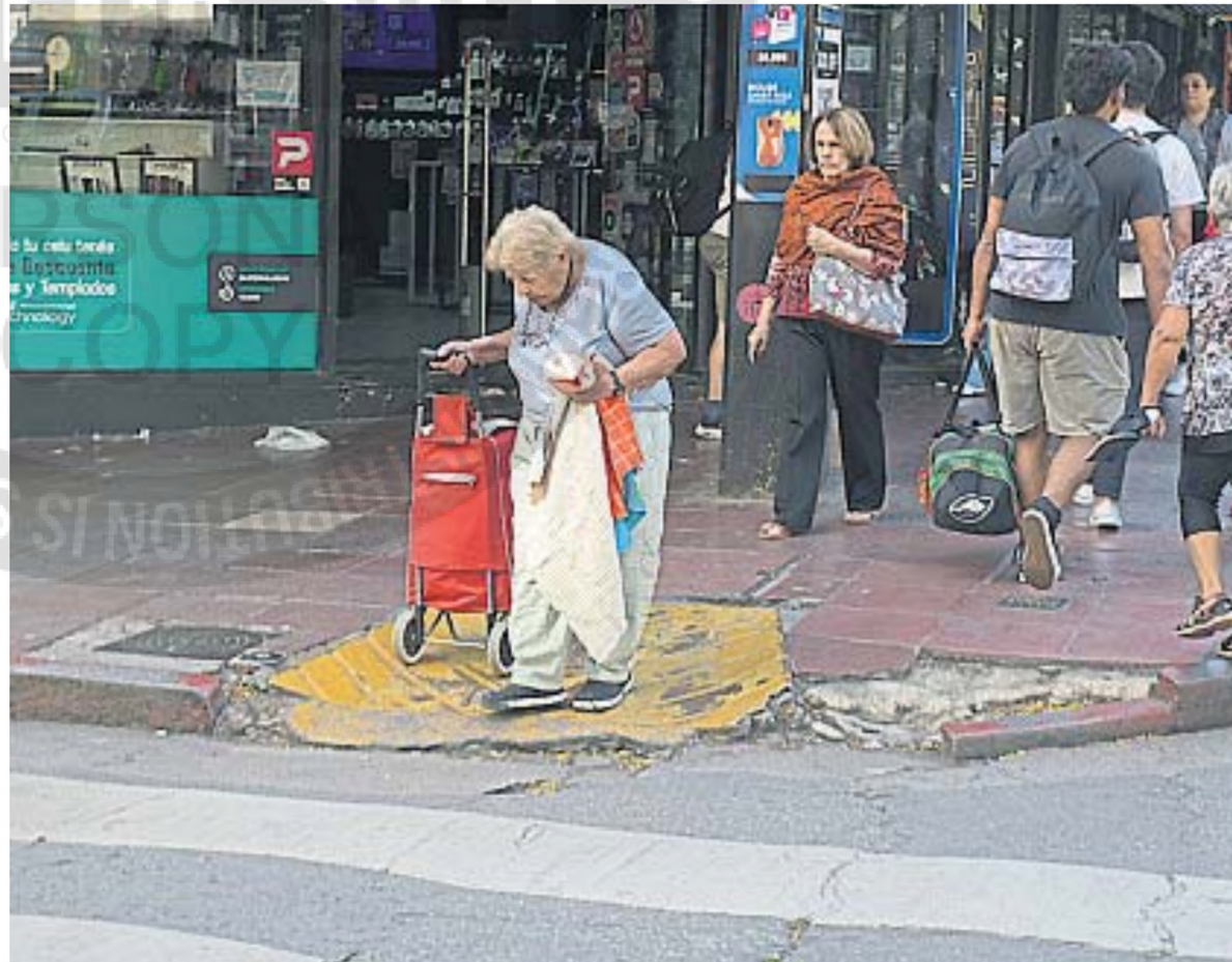
RAMPAS EN MAL ESTADO. Una rampa destruida en la esquina de Obispo Trejo y San Juan. La Municipalidad las reemplazará.

El principal objetivo de este plan es garantizar la accesibilidad universal en el área central de la ciudad de Córdoba, construyendo nuevas rampas y rehabilitando aquellas que se encuentran deterioradas o mal ubicadas. La iniciativa busca facilitar la circulación peatonal, mejorar la infraestructura urbana y promover la inclusión de todas las personas, independientemente de sus capacidades.