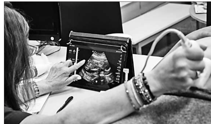
Las unidades de la Municipalidad visitan los Centros de Salud cada 15 días.

El control prenatal es esencial para la salud pública, ya que permite detectar complicaciones y garantizar atención adecuada a las embarazadas. En este contexto, la Municipalidad de Córdoba, a través de la Secretaría de Salud, implementa el programa “Gestando Salud”, que complementa el control de embarazo y puerperio en los Centros de Salud, utilizando unidades móviles que visitan estos centros cada 15 días. De este modo, se realizan ecografías y análisis clínicos, asegurando que las personas gestantes tengan acceso a estudios vitales. En 2024, se realizaron más de 3.600 ecografías obstétricas, beneficiando a 2.234 embarazadas. Más del 50% de las gestantes accedieron a su primer