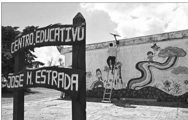
El plan de conectividad apunta a que se puedan consultar materiales online.

Con el fin de concluir el proyecto de conectividad satelital más grande de la región, el Gobierno de la Provincia ya instaló más de 825 antenas Starlink y pisos tecnológicos Cisco en escuelas rurales. Estas cuentan con 300 megas de velocidad y una cobertura amplia dentro y fuera de las instituciones educativas para la realización de videollamadas, el acceso a cursos en línea y la reproducción de contenidos educativos sin interrupciones. Por su partner, los pisos tecnológicos permitirán que la señal de las antenas se extiendan 20 metros a la redonda por fuera de las escuelas. El objetivo final es alcanzar a 871 instituciones educativas de todo el territorio cordobés antes del inicio del ciclo lectivo en marzo. Al respecto, Víctor Di Rienzo, presidente de la Agencia Conectividad Córdoba, destacó que “llevar tecnología satelital a nuestras escuelas rurales es mucho más que una solución de conectividad: es una apuesta al futuro. Estamos construyendo las condiciones para que la educación cordobesa avance con las herramientas del siglo XXI, impulsando nuevas oportunidades de aprendizaje, desarrollo e innovación en cada rincón de la provincia”. El plan de conectividad, impulsado por el gobernador Martín Llyorya, busca “generar igualdad de oportunidades” para los estudiantes de todo el territorio provincial. El funcionario destacó que esta nueva tecnología también hará la diferencia en las tareas administrativas y su funcionamiento.