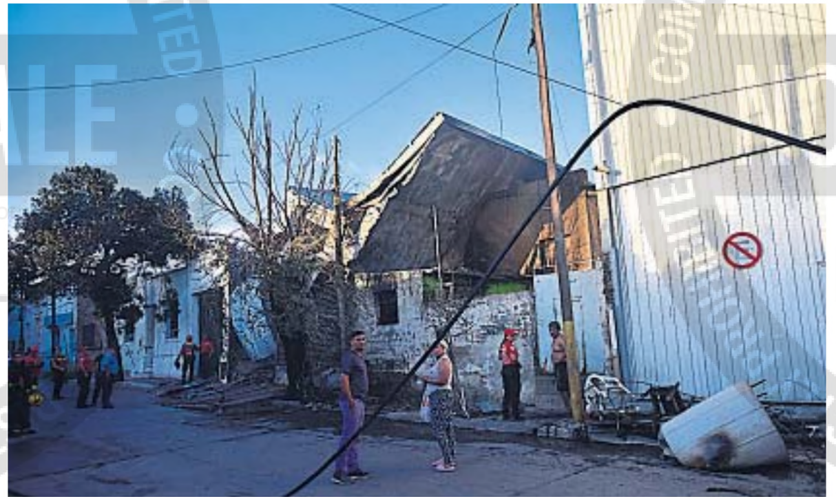
TRAGEDIA. El incendio fatal se registró ayer en un complejo que funcionaba como pensión en calle Tomás Guido al 746.

Poco después arribaron varias dotaciones de bomberos que iniciaron un arduo trabajo para controlar el drama, combatir las llamas y evitar