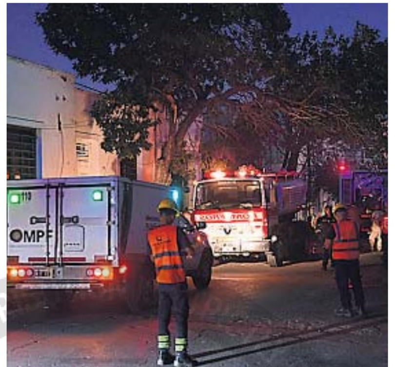
TRAGEDIA. En pocos instantes, tras la acción del fuego, colapsó la estructura.

Por directiva de la fiscalía, se dio parte a la Policía Judicial para la realización de distintos peritajes y medidas de rigor en torno al desastre.