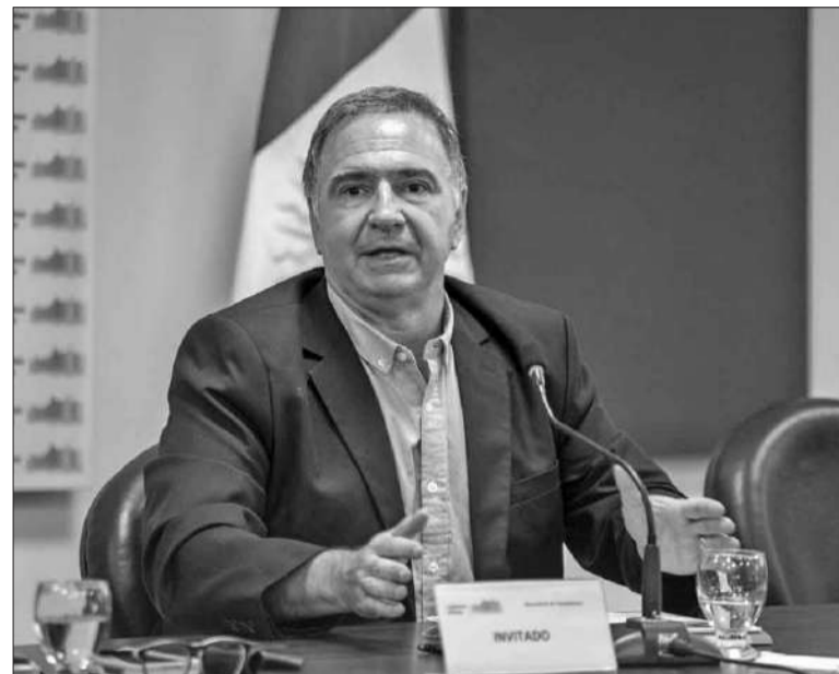
El ministro ante la comisión de Educación de la Unicameral provincial.

más Maestras/os que trabajó en 149 instituciones para reforzar los conocimientos en lengua y matemática. Asimismo, se refirió a la jerarquización, federalización y articulación de la educación superior con el desarrollo social y productivo regional. Sobre el Programa “Transformar@Cba” explicó que el mismo es “un compromiso con la mejora continua de nuestras escuelas, promoviendo un cambio progresivo que respeta y potencia las prácticas docentes existentes, al tiempo que impulsa nuevas formas de enseñar y aprender con creatividad, inclusión y tecnología”. Además, se refirió a “Bien Cba”, un programa de bienestar educativo vinculado a la salud mental. En este sentido, informó que se crearon seis nuevos Equipos Profesionales de Acompañamiento Educativo. Por otra parte, destacó que, en el marco del programa “Tecnopresente” ya se levantaron 700 antenas para la conectividad en el ámbito de las escuelas rurales. También se refirió al aprendizaje y profesionalización docente, al “Planed-Cba”, que busca renovar el currículum y la didáctica del sistema educativo provincial.