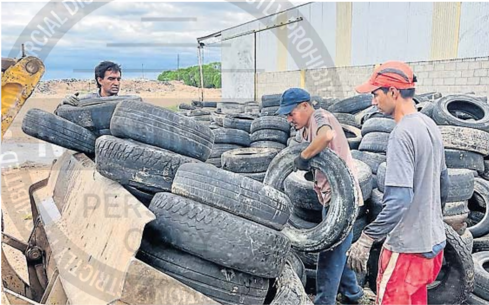
COMBUSTIBLE. Entre los principales destinos de estos materiales, se encuentran las plantas de Geocycle Argentina y Cementos Avellaneda, que los utilizan como combustible.