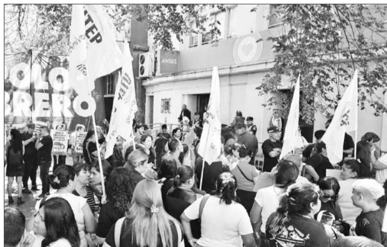
La movilización de organizaciones sociales finalizó frente a la sede de Anses.

Bajo el lema “la canasta escolar es impagable”, organizaciones sociales nucleadas en la Unión Trabajadores de la Economía Popular (Utep) y piqueteros de izquierda se movilizaron ayer hasta la sede de la Administración Nacional de Seguridad Social (Anses) en Córdoba. Entre los manifestantes se encontraban referentes del Polo Obrero, y de la Corriente Clasista y Combativa (CCC) y Territorios en Lucha. Se trató de la primera protesta del año contra las políticas sociales y económicas del gobierno de Javier Milei. En la ocasión, se registraron cortes parciales y problemas con el tránsito en distintas calles del centro de nuestra ciudad. En Buenos Aires, frente al Palacio de Hacienda, reclamaron “un Ingreso Familiar de Emergencia Educativa (IFEE) de $ 300.000 por hijo/a y la restitución