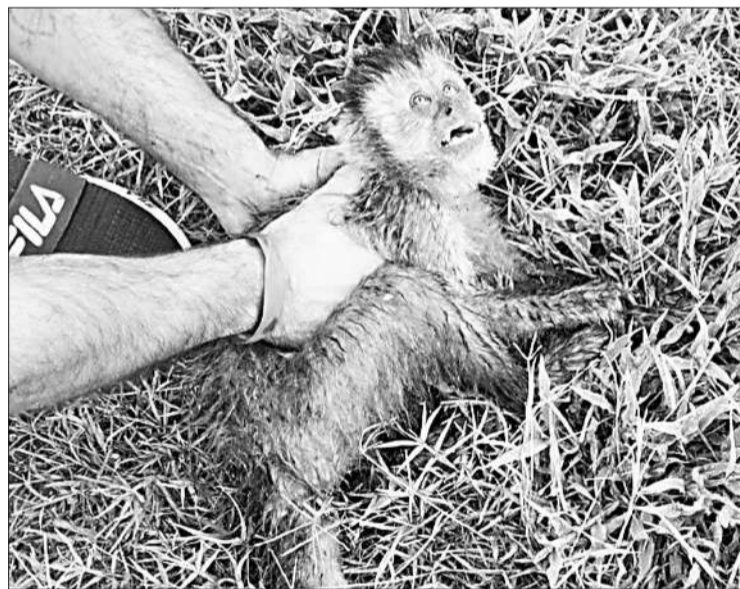
Rescataron a un mono capuchino herido tras una descarga eléctrica.

El lunes, seis jóvenes menores de edad, entre ellos, el chico de 16 años que saltó a la fama por su multirreincidencia, fueron trasladados desde el Complejo Esperanza al Fuero de la Niñez, Adolescencia y Violencia Familiar para trámites de rigor, según informaron fuentes oficiales. El adolescente, con un historial de robos, está imputado por robo calificado con uso de arma de fuego y fue detenido días atrás por la Policía. “El tratamiento de resocialización ya ha comenzado”, señalaron desde la Senaf. Este joven, conocido por su participación en asaltos violentos, protagonizó varios enfrentamientos con la justicia. En el operativo, que se llevó a cabo en Cornelio Saavedra y Del Molino, algunos individuos lanzaron piedras a los móviles policiales, lo que llevó a los efectivos a responder con disparos de postas y gas pimienta. Fuentes oficiales confirmaron que, a pesar de un intento de robo, no se concretó el delito.