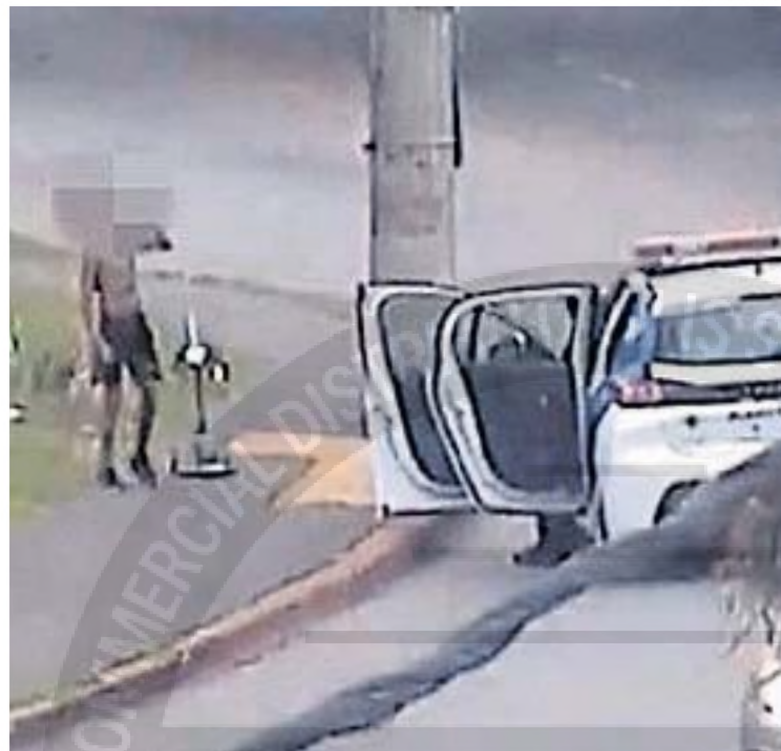
OPERATIVO. Por su edad, el chico es inimputable. Deberá ser entregado a su familia.

Luego, el 30 de octubre, se registró otra detención en la calle Emilio Lamarca al 3500, de barrio Urca. Esta vez estaba acompañado por otro niño de edad similar y llevaban en