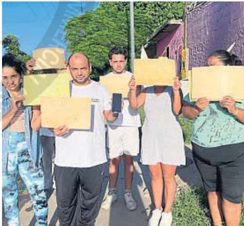
RECLAMO. Familiares y vecinos de la víctima reclaman por la captura de la banda.

Al advertir lo que estaba sucediendo, su vecino Omar Cópola salió a la vereda y se enfrentó con los asaltantes, quienes se le fueron encima.