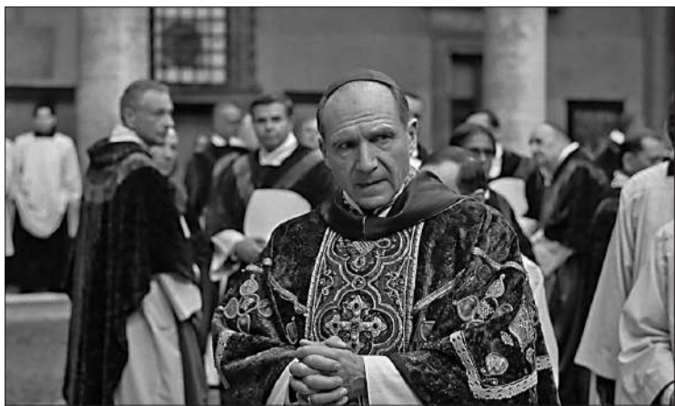
El gran ganador de la noche fue "Conclave" protagonizado por Ralph Finnie.