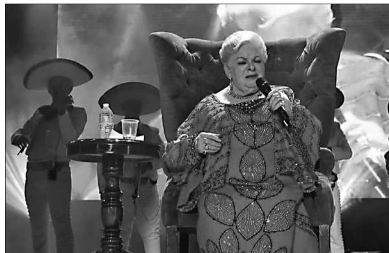
La cantante de música ranchera y bolero murió en su hogar en Veracruz.

Reconocida por alzar la voz en contra de las injusticias hacia las mujeres, Paquita fue una figura icónica en la música ranchera y bolero, con más de 50 años de carrera musical. Después de una gira