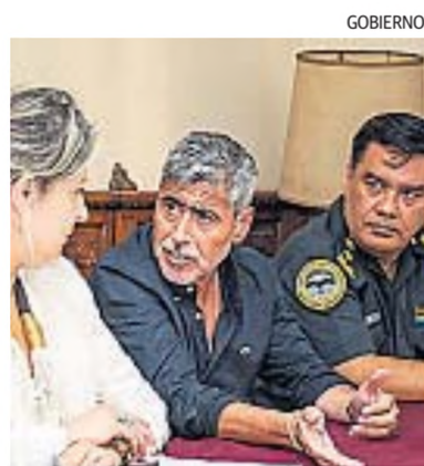
REUNIÓN. El ministro Quinteros dialoga con la viceministra Monteoliva.

Se indicó que el comando operará por 180 días, con posibilidad de pró-