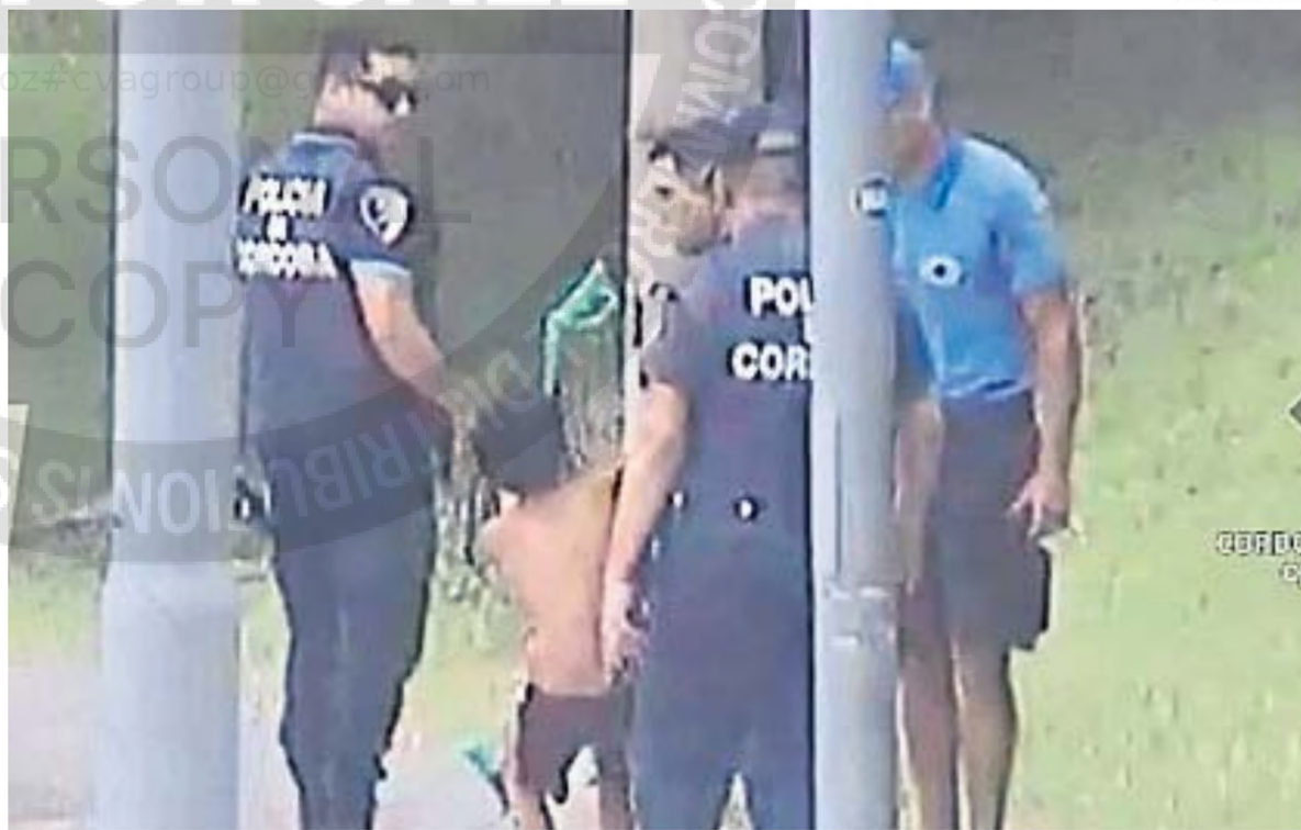
TRISTE POSTAL. El chico fue demorado por policías en un operativo callejero. Con 13 años, ya cuenta con varias caídas por robos.

Allí mismo el niño quedó detenido, a disposición de un juzgado de