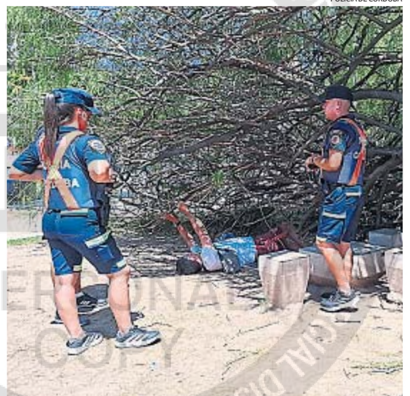
APLASTADO. Una persona quedó atrapada debajo del árbol. Luego fue rescatada.

Más aún cuando no se trató de una jornada lluviosa o con mucho viento. Por lo que también se estudia el estado de salud que presentaba el árbol en lo referido a alguna patología que lo hubiese vuelto inviable y provocara la caída.