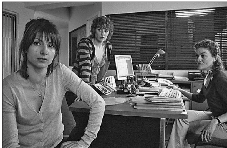
La película en cartel es "Mataharis" de Iciar Bollain estrenada en 2007.

El ciclo que se lleva a cabo en el patio del CCEC invita al público a conocer el cine español contemporáneo. Las proyecciones cuentan con subtítulos y en caso de lluvia la proyección se realizará en nuestro auditorio. La serie que de producciones es una oportunidad única para acercarnos a narrativas, miradas y estilos que reflejan la riqueza y diversidad del cine ibérico actual. En primera instancia se proyectó "Las ovejas no pierden el tren", la segunda edición tiene como protagonista a "Mataharis" mientras que la tercera y última función será el jueves 27 de febrero con "Cerdita".