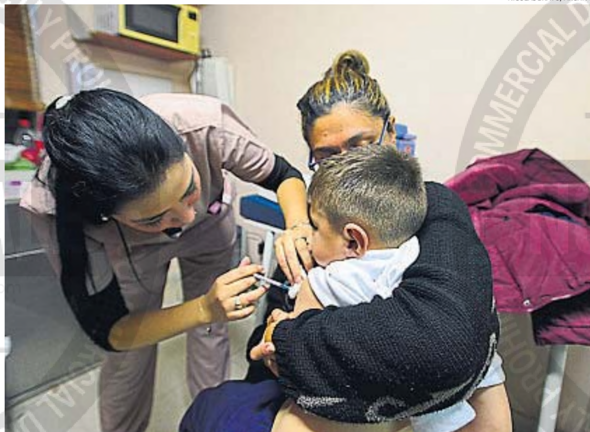
COBERTURA. Varias vacunas del calendario nacional registran bajos niveles de cobertura en las poblaciones objetivo.

SALUD. Una iniciativa en la Legislatura provincial propone acciones para alentar a la población a inmunizarse contra distintas enfermedades. Advierten que el nivel de cobertura es muy bajo.