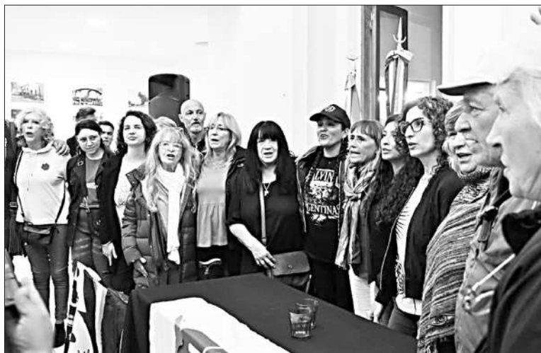
Gremios cordobeses repudiaron la "salvaje represión" y el "ajuste a jubilados".

Las principales centrales sindicales de nuestra provincia agrupadas en el "plenario multisectorial de Córdoba" anunciaron ayer la convocatoria a un paro general en este distrito como respuesta a la "salvaje represión" policial llevada adelante el miércoles pasado contra jubilados y manifestantes en general, en las inmediateces del Congreso de la Nación. La medida de fuerza fue comunicada por referentes de la CGT Regional Córdoba, CGT Histórica, CTA y CTA-A, en una conferencia de prensa realizada en la Casa Histórica del Movimiento Obrero de nuestra ciudad. Al término de dicha actividad, se anticipó que el próximo lunes a partir de las 18 horas, en el mismo lugar, habrá una reunión para comenzar a coordinar la organización de la huelga. La acción sería a fines del presente mes. Resta definir una fecha específica que podría ser el 27 de marzo, en el marco del paro nacional convocado por diferentes gremios contra el DNU del presidente Javier Milei para sellar un nuevo préstamo del Fondo Monetario Internacional (FMI). Durante el plenario, se leyó un documento a través del cual se repudió "la salvaje represión del gobierno de Milei que pretende hacer pasar a sangre y fuego el ajuste a jubilados y jubilados y al pueblo en su