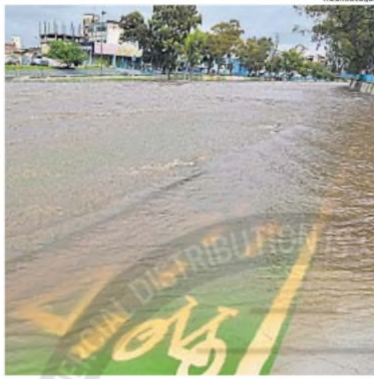
CORTADA. La avenida Costanera seguía anoche cortada por el desborde del Suquia.

En ese marco, el organismo provincial llevó a cabo ayer maniobras operativas en los embalses Los Molinos y La Viña para garantizar su correcto funcionamiento.