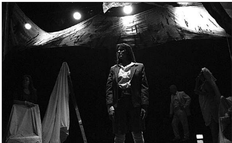
La obra busca capturar la esencia de la novela escrita por Aurora Venturini.