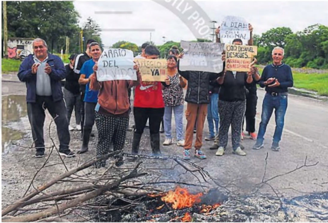
PROTESTA. Vecinos de Quintas de Ferreyra reclaman que se le dé una solución urgente al problema de las calles de tierra. Dicen que los colectivos no quieren ingresar al barrio.