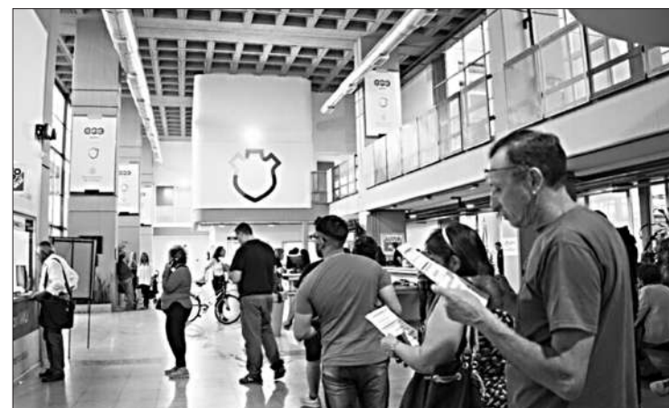
El año pasado, los vecinos realizaron 20.000 trámites durante el evento.

La Municipalidad invita a los vecinos y vecinas a participar de una nueva edición de "La Noche de los CPC". Son 16 los Centros de Participación Comunal que atenderán hoy, de 18 a 22 horas. Se podrán realizar trámites correspondientes a registro civil, carnet de conducir, recursos tributarios, obras públicas, Nodo Joven, inspección, cultura y deportes, entre otras. En todos los sitios descentralizados del municipio habrá ferias de emprendedores con productos y artesanías a la venta; shows de canto, baile, danza, y diversos talleres. Durante el 2024, 20.000 trámites se realizaron como parte de esta iniciativa, que además de brindar servicios, contribuye a fortalecer los vínculos comunitarios con actividades culturales y artísticas.