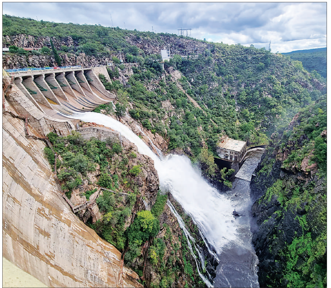
En el caso del Dique La Viña, se realizó una prueba de funcionamiento de las compuertas.

■ Un plenario multisectorial de nuestra provincia definirá el lunes fecha y alcances de la medida de fuerza ■ Fuertes críticas al gobierno nacional / PÁGINA 5