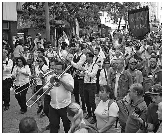
El público podrá participar con bailes y vestimentas tradicionales del género musical durante el festival.

Esta gran fiesta popular que se replica en el mundo, continúa con diferentes shows en la explanada y escalinatas del Palacio Municipal “6 de Julio”. Actuarán la tradicional