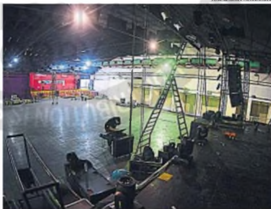
TEMPLO. El lugar está listo para recibir al "Mandamás" esta noche.

Es que el club ubicado en la esquina de las calles Sargento Cabral y Junín se convirtió en un reducto central para la construcción de Jiménez como el mayor idolo popular del cuarteto. De hecho, fue allí que el artista comenzó su carrera como solista luego de abandonar el Cuarteto de oro en 1984.