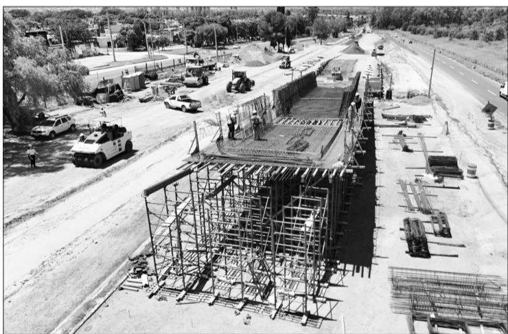
Se ejecutaron las pilas y estribos del puente del altonivel de Valle Escondido.

El gobierno provincial destacó que el altonivel que está construyendo, a través de Caminos de las Sierras, en la intersección de la avenida Ejército Argentino (zona urbana de la ruta E-55) y la avenida República de China, a la altura de la salida de la urbanización Valle Escondido, registra un avance del 30%. Los técnicos responsables del proyecto explicaron que ya se ejecutaron las tres pilas y los dos estribos del puente; ya se construyó el terraplén del ramal descendente con sus respectivos muros de sostenimiento; y se está avanzando en la construcción de las vigas y el tablero del altonivel así como en la nueva calzada que posibilitará, cuando finalice la obra, la circulación de los automóviles en sentido La Calera - Córdoba. El cruce a distinto nivel que se está ejecutando en el sector noroeste de la ciudad brindará una significativa mejora en la seguridad vial no solo a los vecinos de Valle Escondido y barrio Don Bosco sino también para los habitantes de La Calera que ingresan todos los días a Córdoba. La finalización de la obra está prevista para el último trimestre de este año. El altonivel tendrá un viaducto curvo de 145 metros que permitirá la salida del tránsito desde Valle Escondido hacia Córdoba y evitará las demoras y filas de vehículos en la actual intersección semaforizada, fundamentalmente en horarios picos en que los vecinos de La Calera ingresan a nuestra ciudad.