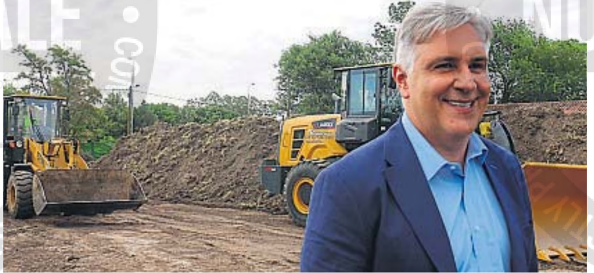
GIRA. El gobernador emprendió una gira oficial por países árabes. Buscará créditos para obras y estará 10 días fuera de Córdoba.

También buscará financiamiento para otros proyectos, como la circunvalación de Río Cuarto y obras para la ciudad de Córdoba.