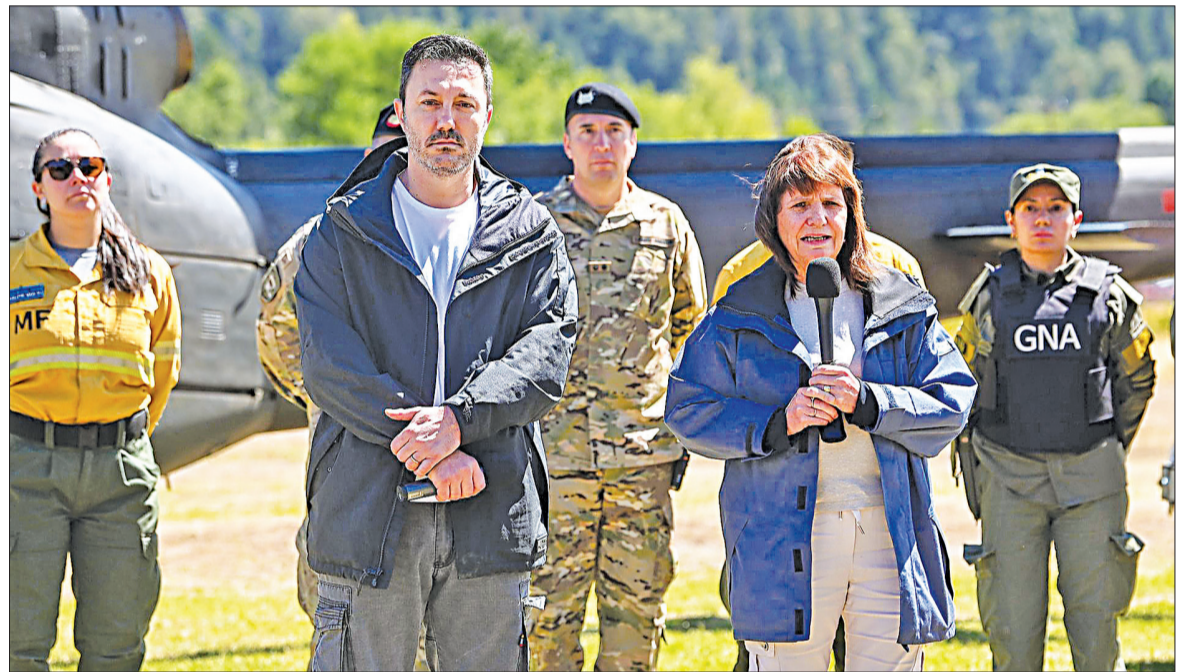
Los ministros Bullrich y Petri se trasladaron a El Bolsón para presentar la nueva agencia oficial.