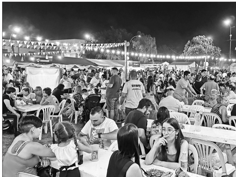
El Festival de Peñas de Villa María fue uno de los eventos más convocantes.