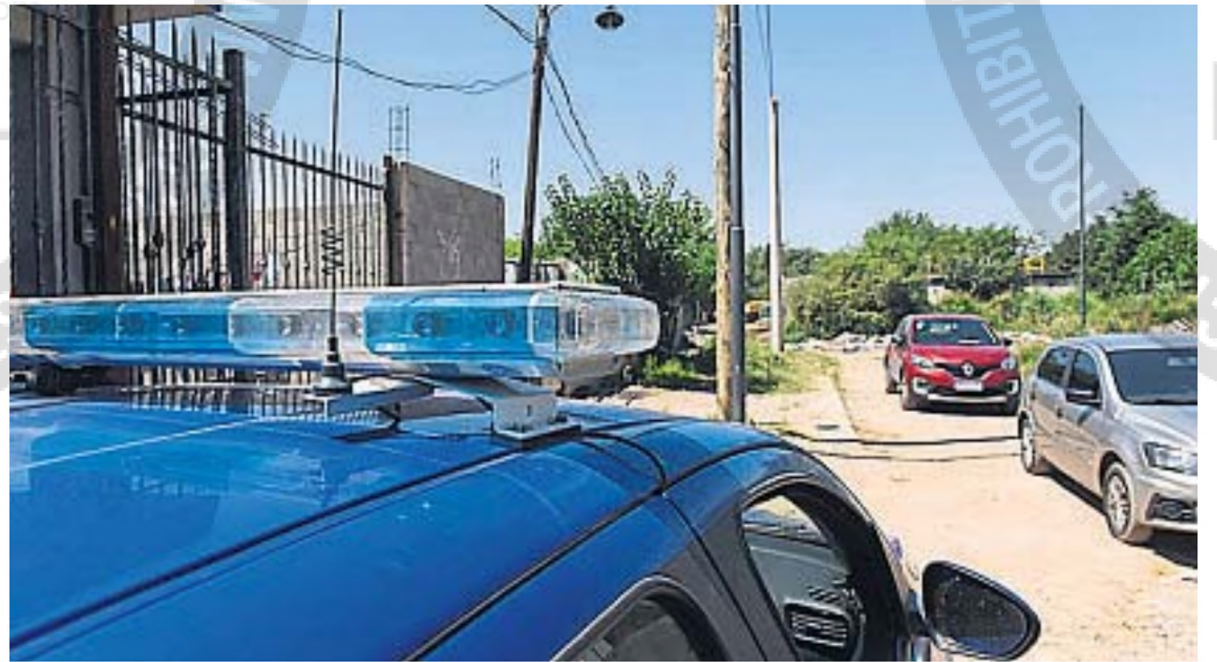
CRIMEN. El violento episodio ocurrió en la mañana del martes en barrio Cooperativa Atalaya, en la capital cordobesa.

Eran poco más de las 7 de la mañana del martes, cuando la alerta ingresó a la central de emergencias del 911. El llamado daba cuenta de