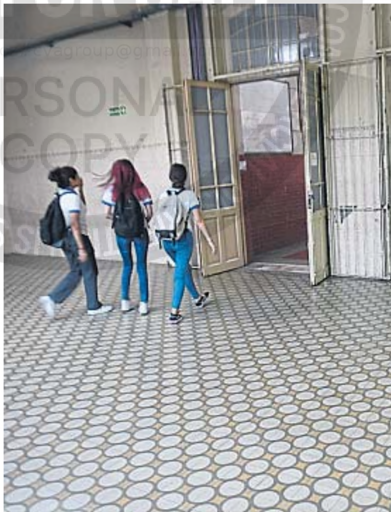
INASISTENCIA. Cuando un alumno falta más de tres días, se contacta a la familia.

En la educación secundaria, se implementó un módulo de alertas tempranas con información nominal que permite el seguimiento individualizado de las trayectorias educativas. "Esto nos permite conocer la