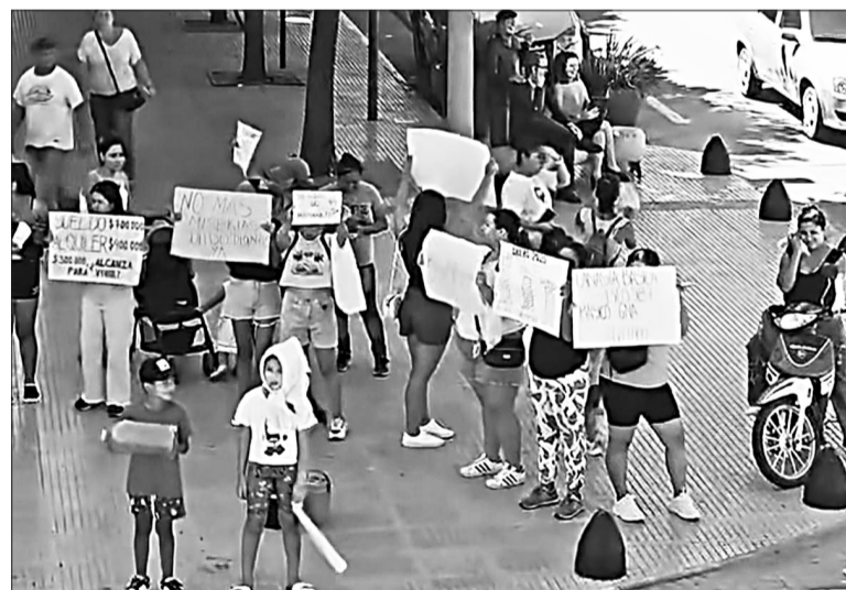
Familiares de gendarmes protestaron en la ciudad de Jesús María.