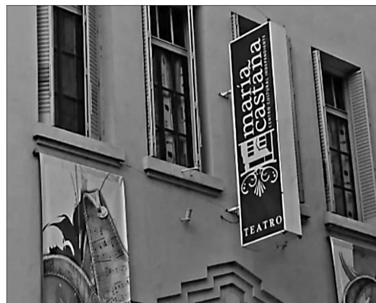
El espacio cultural ofrece cuatro obras teatrales, talleres y seminarios.