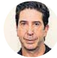
David Schwimmer Actor