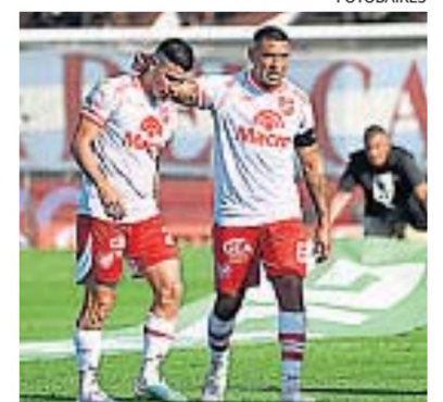
EN VICENTE LÓPEZ. La Gloria tuvo una muy mala tarde y el local le ganó 1-0.

DEPORTES. Talleres falló en casa y perdió 1-0 con Lanús. Fue la tercera caída del equipo que dirige Medina, que no puede ganar.