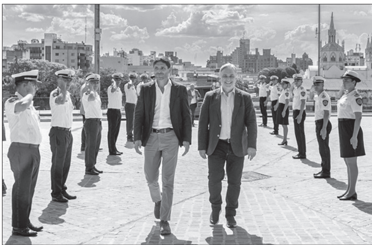
Reclamo conjunto a Francos de los gobernadores de Santa Fe y Córdoba.

Los gobiernos de Córdoba y Santa Fe, encabezados por Martín Llaryora y Maximiliano Pullaro, respectivamente, enviaron una nota dirigida al jefe de Gabinete de la Nación, Guillermo Francos, manifestando la necesidad y conveniencia de llevar adelante un conjunto de obras en el Sistema de Transporte en Extra Alta Tensión de 500 kV en el Sistema Argentino de Interconexión -SADI-, que además de resultar de importancia para el conjunto de actores del SADI, tienen relevancia para ambas provincias integrantes de la Región Centro. En la misiva, ambos mandatarios ratificaron la necesidad que desde el Sistema Argentino de Interconexión en su conjunto se dé curso a la ejecución de las obras para poder asegurar un crecimiento federal, coordinado y armónico del Sistema de Transporte en 500 kV, permitiendo así hacer frente al déficit que presenta la capacidad de transporte eléctrico en la actualidad y fortalecer el crecimiento económico y social de todo nuestro país.