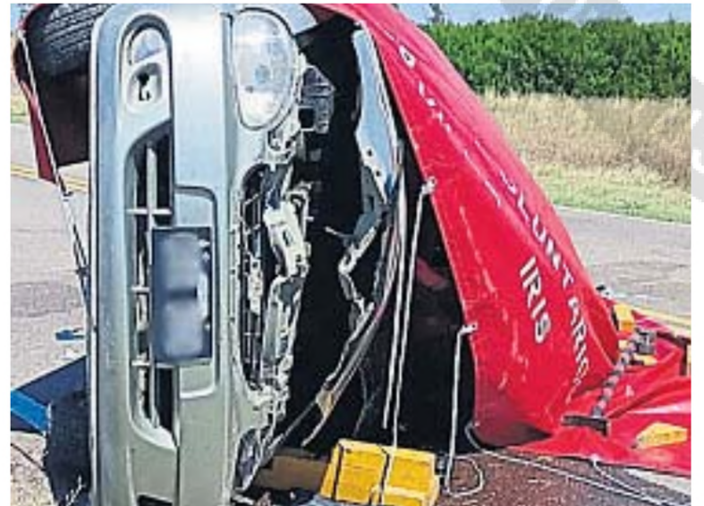
VUELCO. El conductor perdió el control del volante y el coche dio tumbos.

En tanto, un hombre murió y otros tres resultaron con distintas