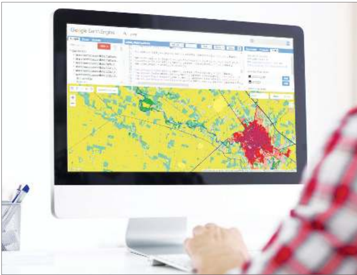
MAPA DE VALORES 2024. Permite navegar sobre cualquier municipio o comuna.