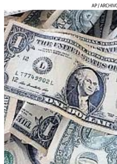
DÓLARES. Los billetes de cara chica son válidos y de curso legal.

Tampoco entremos en pánico y confundamos también a los ejemplares “cara grande”, emitidos después del año 1996, que no han tenido, no tienen ni tendrán ningún inconveniente, porque son tan perfectos como los vulgarmente denominados “azules”.