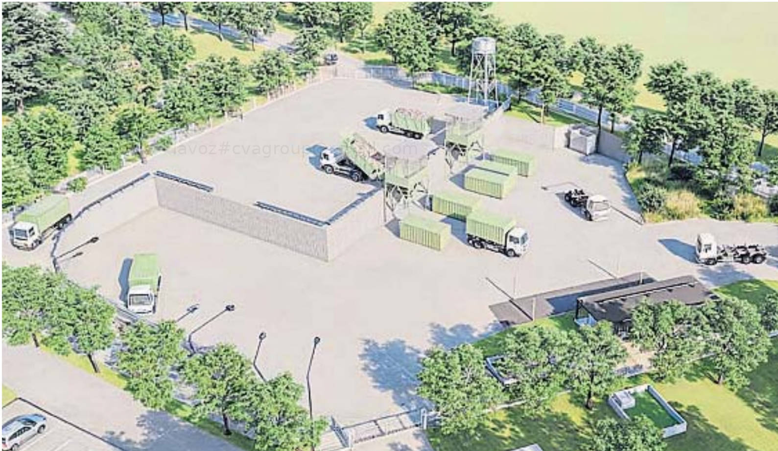
EN LA CALERA. El diseño de cómo se vería el centro de transferencia de residuos urbanos, desde el que se derivarán compactados hacia el predio de Cormecor, en la Capital.