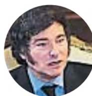
Javier Milei Presidente de la Nación

"Hay que sacarle la pata de encima al campo y liberar toda su capacidad productiva. ¿Se imaginan lo que sería nuestra provincia si ese dinero quedara en manos de quienes invierten?"