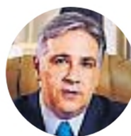
Martín Llaryora Gobernador de Córdoba

"Hay que sacarle la pata de encima al campo y liberar toda su capacidad productiva. ¿Se imaginan lo que sería nuestra provincia si ese dinero quedara en manos de quienes invierten?"