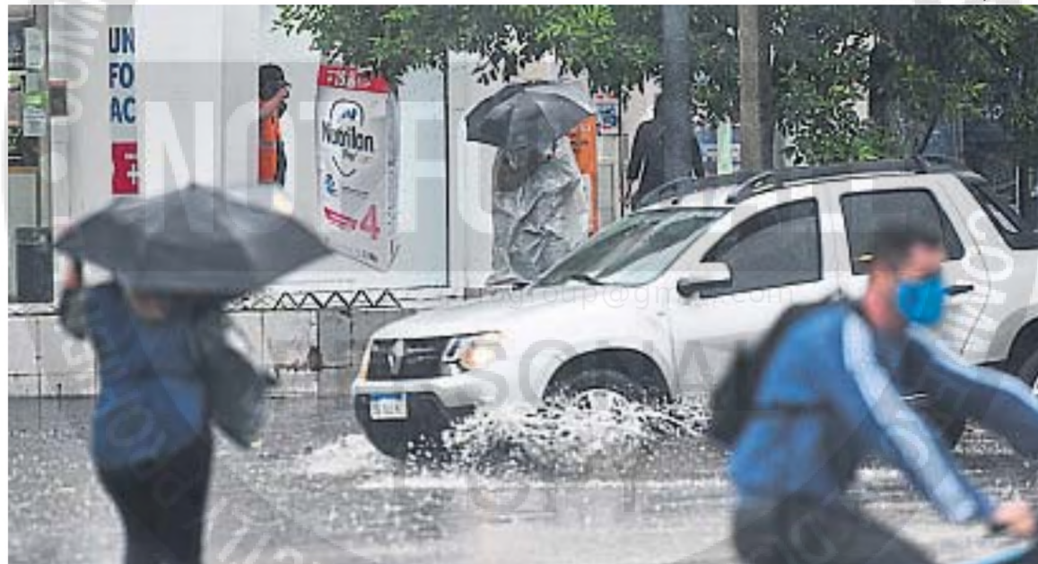
LLUVIAS TORRENCIALES. Las lluvias torrenciales junto a los vientos son las dos amenazas más frecuentes que tiene Córdoba.