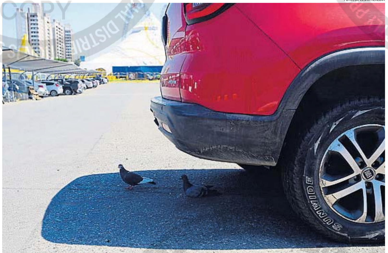
REFUGIO EN EL HERVIDERO. Dos palomas buscan sombra debajo de un auto en la playa de estacionamiento del Carrefour de avenida Colón, uno de los puntos calientes.

Suárez explicó que las temperaturas testigos son apenas el síntoma del problema climático que atraviesa la