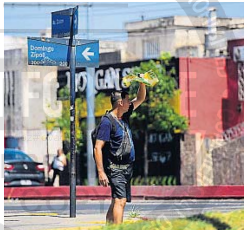
PUNTO CALIENTE. Colón y Zípoli, otro de los puntos calientes de la ciudad.