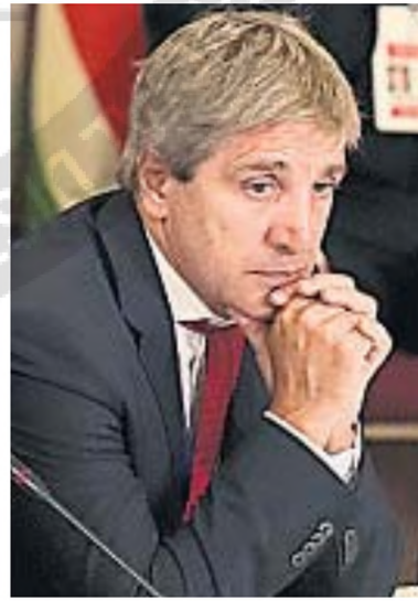
LUIS CAPUTO. Ministro de Economía.

ración Argentina de Supermercados y Autoservicios (Fasa), admite que en enero la baja interanual fue de 5%, cuando en el trimestre anterior la caída rondaba 7%.