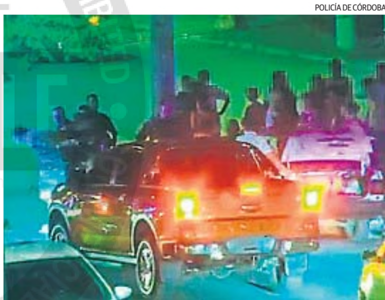
FILMADO. Los domos policiales tomaron imágenes de la persecución.