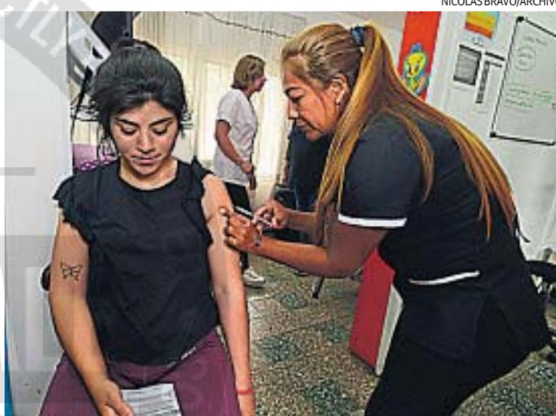
VACUNACIÓN. La Provincia continúa con la vacunación contra el dengue.

La campaña continúa en distintos puntos de la provincia, con el fin de ampliar la cobertura en la población de riesgo.