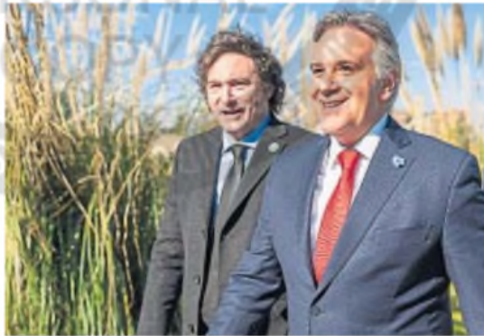
MILEI Y LLARYORA. El cordobés dijo estar dispuesto a debatir el esquema tributario.