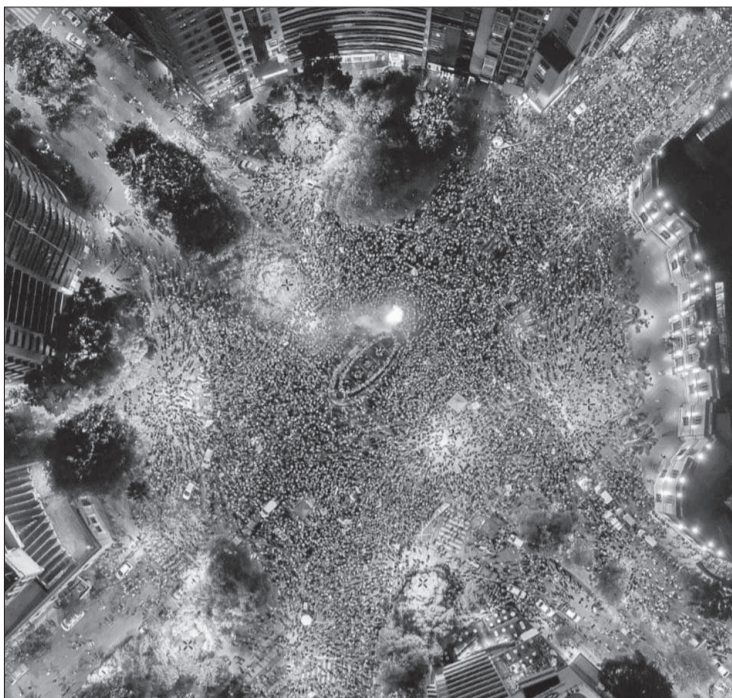
En la zona del Patio Olmos se vivió una fiesta multitudinaria.