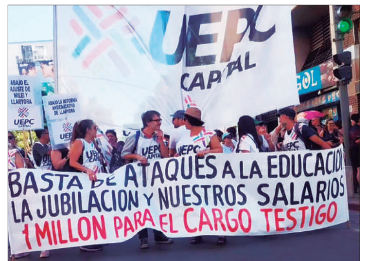
UEPC Capital se manifestó frente al Panal por el reclamo salarial.

Según el gremio, la huelga de ayer tuvo un acatamiento del 75% en toda la provincia ■ Los educadores esperan que la Provincia les acerque una tercera propuesta salarial la próxima semana / PÁGINA 7