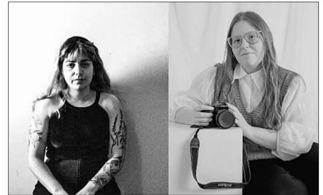
La primera entrega del ciclo de conversaciones será mañana en Córdoba.

El Museo de fotografía invita a la inauguración de una muestra y un ciclo de charlas