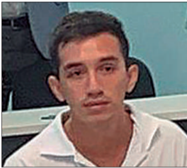
Soto, acusado por el crimen.

El detenido le pidió perdón a la madre de la víctima / PÁGINA 15