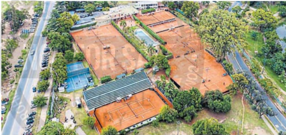
DESDE EL CIELO. Vista aérea del complejo en el que se lleva a cabo este certamen que sigue poniendo a la ciudad de Córdoba en el centro de la escena.

INFORME. El certamen, que finaliza el domingo, lleva varios días de competencia en el Córdoba Lawn Tennis. El club, como en sus mejores galas, disfruta del movimiento que se genera.