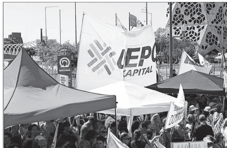
La UEPC Capital armó una carpa blanca frente al Panal para visibilizar el reclamo.