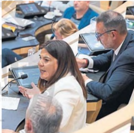
OFICIALISTA. Fernández intermedió en la contratación de la empleada de la polémica

Desde su entorno se informó que la agente legislativa debía cumplir horarios de trabajo y documentación que no facilitó a la Legis-