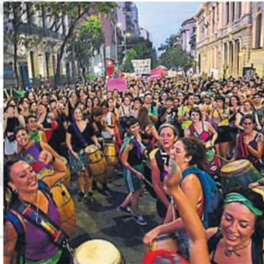
MOVILIZADAS. Las últimas marchas del 8M fueron masivas en Córdoba y en el país.

Entre las consignas de la marcha, además de resaltar el pedido de justicia para ambos casos, se manifiesta el rechazo al ajuste en las políticas de igualdad de género, el pedido de restitución del presupuesto para la prevención de la violencia contra las