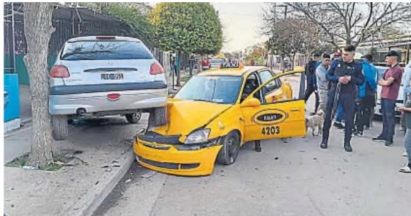
CHOQUE. Todo terminó cuando el taxi en el que los ladrones escapaban chocó contra un auto en Cooperativa 16 de Abril.

Al llegar al lugar, y en algo increíble, el delincuente y la taxista fueron sorprendidos, a su vez, por otros tres