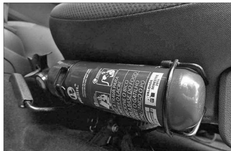
Renovar la carga llega hasta los $ 12.000, según el tamaño del matafuego.

El proceso de inspección no es sencillo. Los conductores deben cumplir con una serie de requisitos como tener la documentación en regla, incluyendo la tarjeta verde,