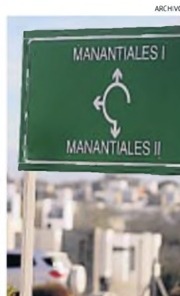
ZONA SUR. Ahí se da la mayor expansión de nuevas urbanizaciones en Córdoba.

Si la Municipalidad sancionara una ordenanza con esos dos pequeños cambios, se aceitaria la venta de miles de unidades construidas para vender por pequeños inversores, quienes volverían a invertir y continuarían girando la rueda. Y, por otro lado, se facilitaría el acceso a estos barrios a mucha gente que quiere y, lamentablemente, no puede.