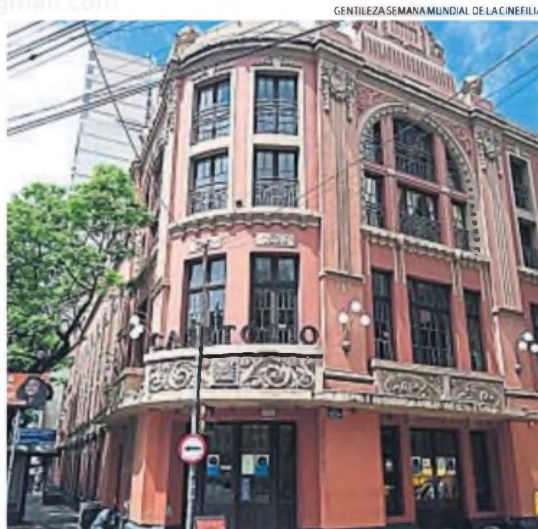
COMO EL CINECLUB. La Cinemateca Capitólio, sede del evento en Porto Alegre.

"Nos permitió constatar que algo que creíamos que era posible en Córdoba porque hay un profundo traba-