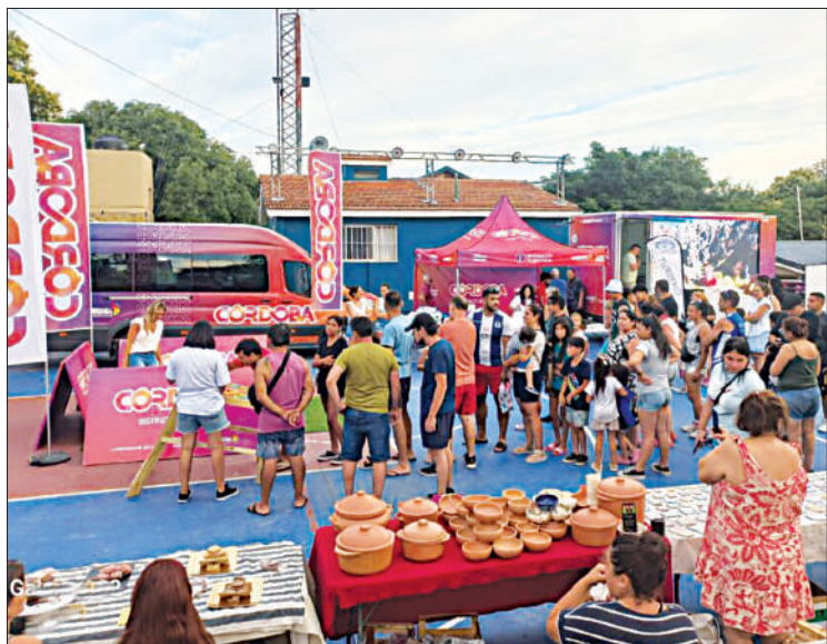
Córdoba apunta a ser un destino de verano inclusivo.

■ Ambos espacios políticos y el PRO arriesgan sus bancas en una provincia donde el apoyo al presidente sigue creciendo ■ Un repaso por los nombres de quienes terminan su mandato en diciembre / PÁGINA 5