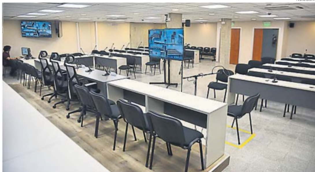
LA SALA. Todo listo para el inicio del proceso que marcará un hito en la historia de Córdoba. Frente a la silla para los testigos, estarán los fiscales y las madres de los bebés.

Hasta fin de junio hay audiencias programadas