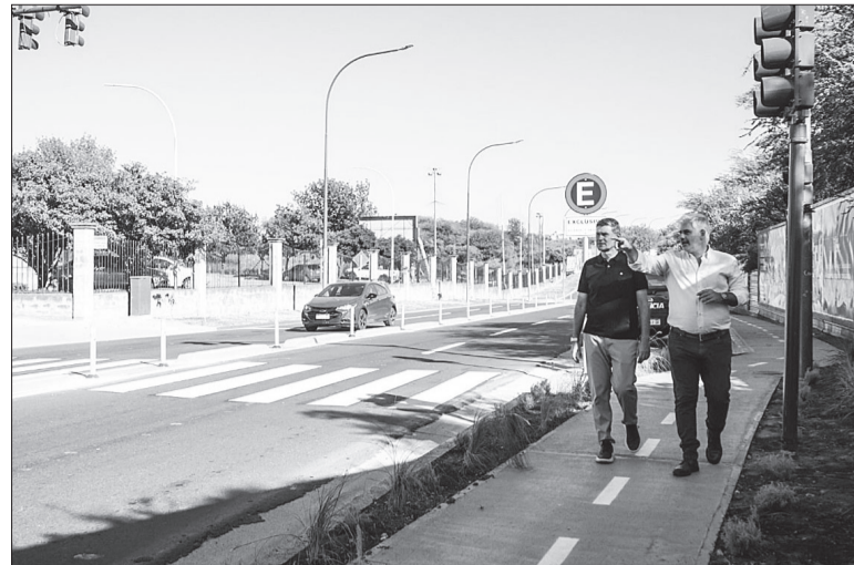
Passerini habilitó la traza que une al Jardín Botánico con el Parque Kempes.

terística particular de avenida Del Piamonte. Su bicicleta conecta la Costanera con el Parque Kempes y Bustos a través de un sendero particular para los vehículos sobre dos ruedas. Para los peatones, los trabajos tuvieron como principal foco la seguridad de los jóvenes y padres que concurren a las instituciones deportivas, educativas, recreativas ubicadas en la arteria y las residencias particulares. La arteria ahora tiene un cordón premoldeado que divide ambos sentidos de circulación, lo que impide los peligrosos giros que se tomaban para acceder a las diversas instituciones y calles perpendiculares. En el punto particular de ingreso de un colegio se colocó un semáforo peatonal y un sendero por donde se puede arribar a destino con mayor precaución. Desde la víspera, solo se podrá cambiar de sentido de circulación a través de las rotondas que se encuentran a metros de la Circunvalación y del Jardín Botánico.