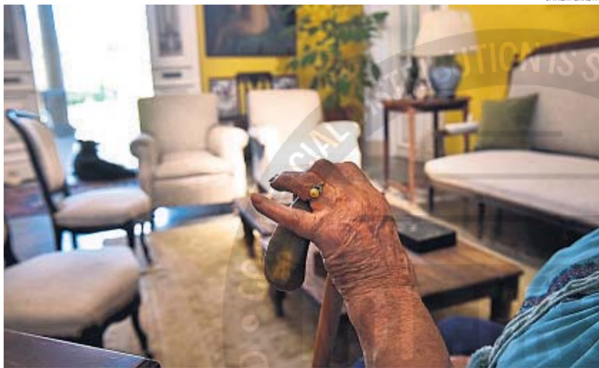
ASALTO. Una familia vivió un violento asalto en su casa de Villa Allende a manos de un grupo comando. La banda no fue atrapada.

Alcázar relató que justo terminaban de cenar y fue entonces que escucharon ladrar a sus perros, pero no les llamó la atención. Luego, vie-