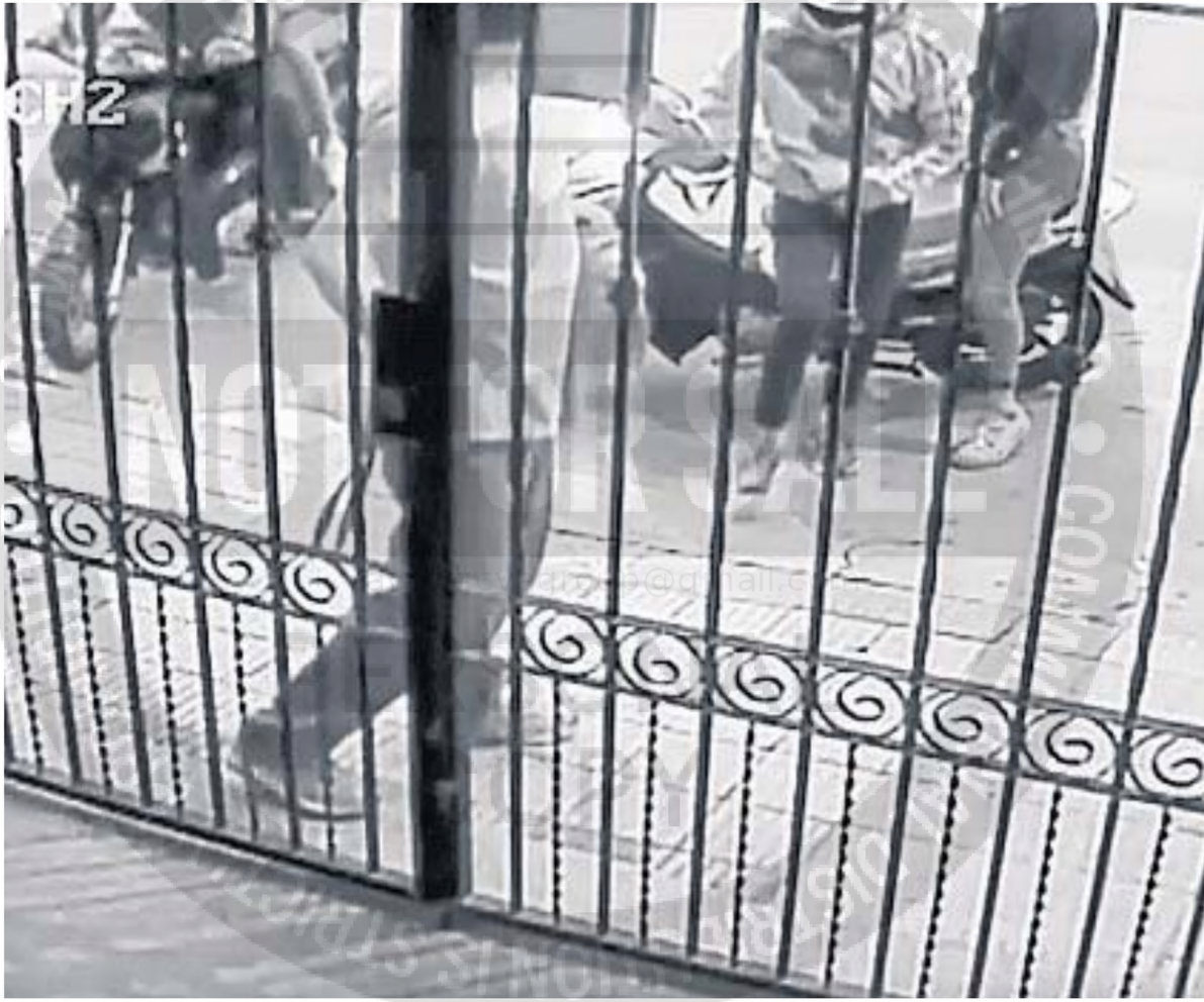
ASALTOS. Los robos cometidos por motochoros parecieran recrudecer en los barrios. Muchos optan por no realizar la denuncia.