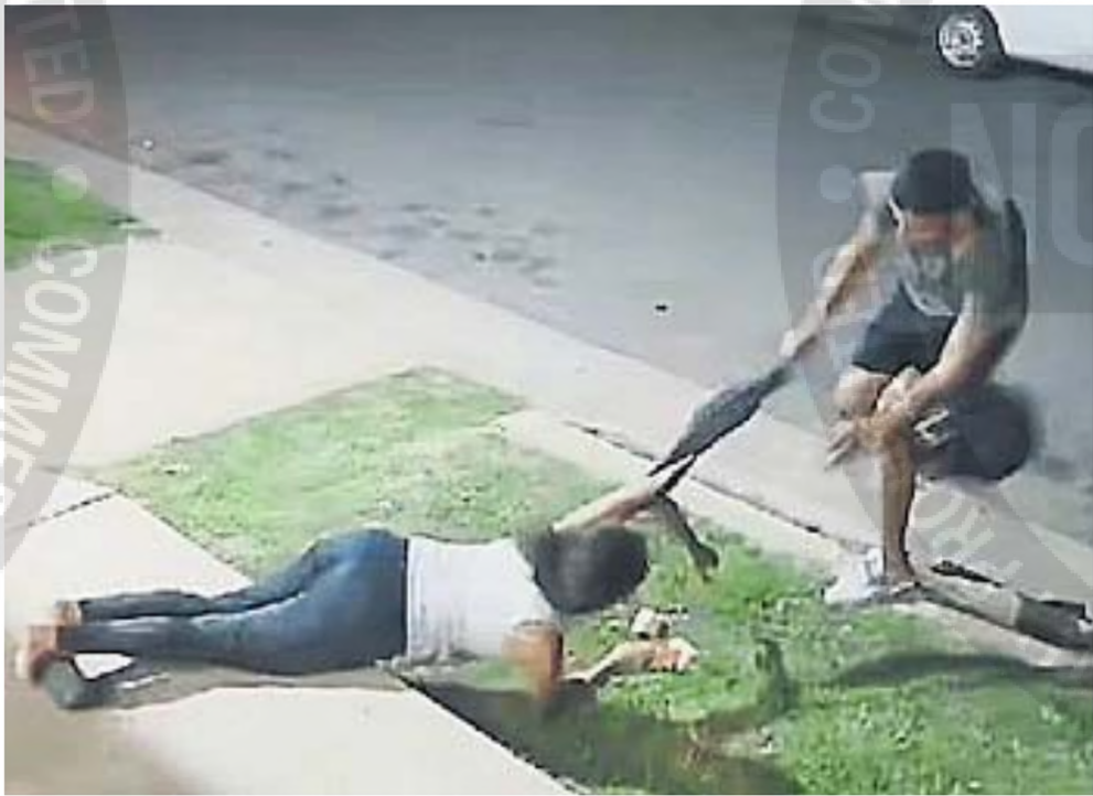
ARREBATOS. Las autoridades reconocen que los arrebatos callejeros muchas veces no se denuncian.