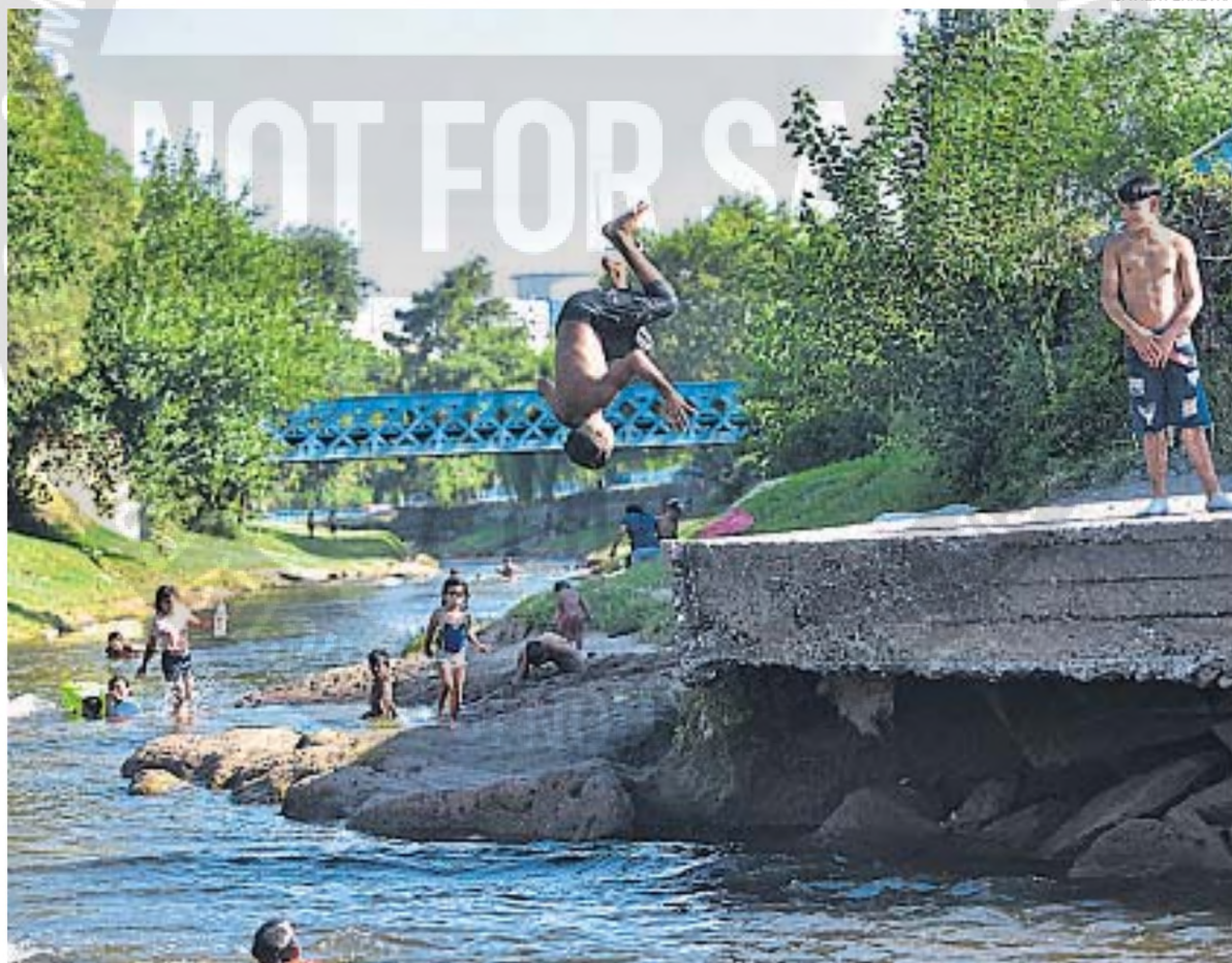
CHAPUZÓN. Chicos y adolescentes buscaron refrescarse en el río Suquía, en la zona de la Isla de los Patos, de la capital cordobesa.