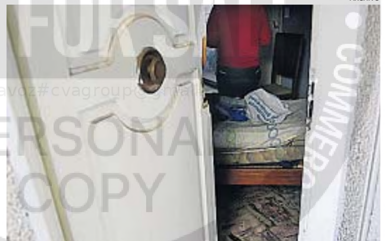
LA PEOR POSTAL. Volver a casa y encontrarse con aberturas rotas y el saqueo.

Tengo en mi poder el comprobante del robo más reciente y la tranquilidad de haber hecho lo que se pide. Tal vez, más adelante me llegue la noticia de que al menos atraparon a quien lo hizo.