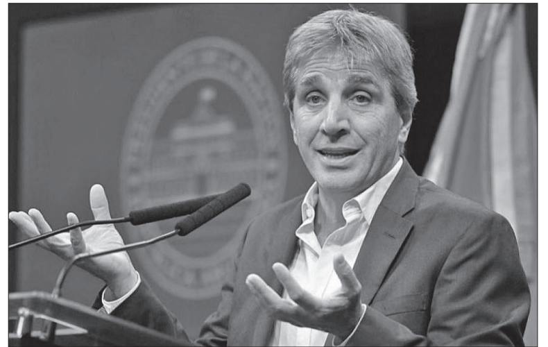
El ministro Caputo garantizó que "no nos vamos a mover del orden fiscal".

Al mismo tiempo, el Dollar Index subió 0,5% y puso presión al resto de las monedas emergentes: en el mercado local, el dólar financiero respondió con subas, el MEP trepó 1,2% para llegar a $1.178,82; mientras que el CCL subió 0,8% hasta rozar los