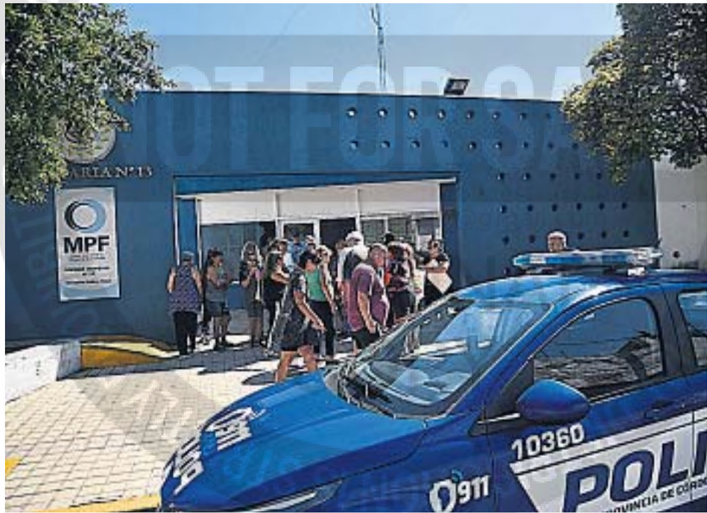
DENUNCIAS. En muchos barrios, denunciar un delito es una pérdida de tiempo para los damnificados.