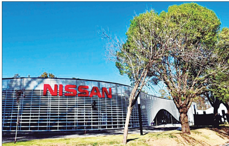
La empresa paralizó hasta el viernes su producción en esta ciudad.

■ El Smata alertó que la firma viene “trabajando un solo turno y con suspensiones” en su planta de Santa Isabel ■ La terminal dejaría de fabricar la pickup Frontier y se relocalizaría en México ■ Una de sus autopartistas pidió el procedimiento de crisis / PÁGINA 5