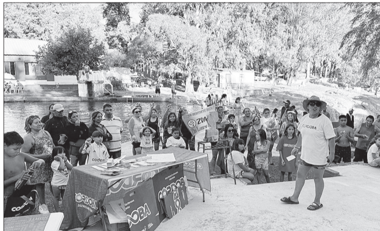
Los balnearios, uno de los principales atractivos para los visitantes.