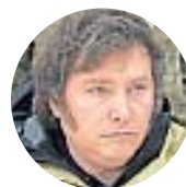
Javier Milei Presidente de la Nación

"Sobreideologización, desfinanciamiento y mala praxis diplomática resumen lo actuado hasta el momento por el gobierno de Javier Milei en lo relativo a la cuestión Malvinas".