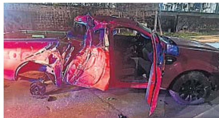
IMPACTO. Un joven se salvó tras chocar con su camioneta en Costanera de Córdoba.

Por otro lado, un joven salió afortunadamente ileso pese a los daños totales que sufrió, ayer a la madrugada, al perder el dominio de la camioneta que conducía por la Costanera Sur de Córdoba Capital.