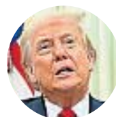
Donald Trump Presidente de EE.UU.

"El primer paso para seguir con el reclamo es levantarnos como país... Buscamos ser una potencia para que los habitantes de las Islas Malvinas decidan ser argentinos".