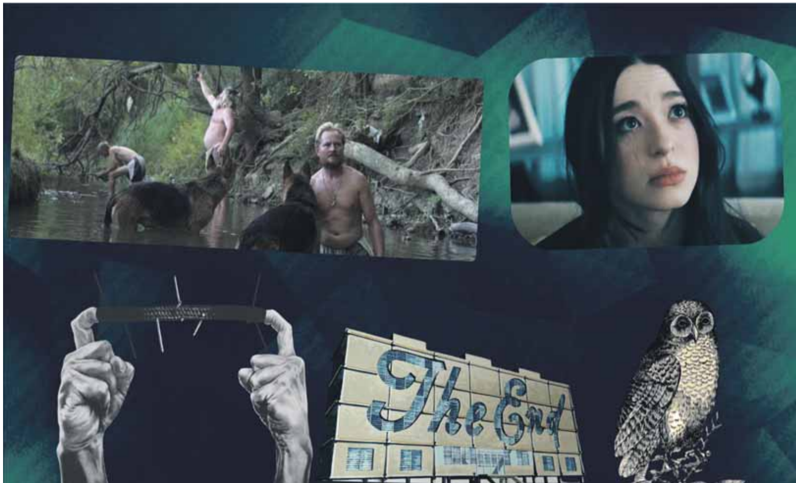
Cine: "Sombra grande" y "Anora". Empieza Capital FERIA; hay un búho en un libro.

Hay un aura en los jueves. La vida es una tómbola, pero un jueves siempre tendrá distinción. Hoy volvieron los estrenos, Capitalinas envuelve en seda una feria de arte, un poeta envía postales buenas de recibir, cantautores echan raíces en un ciclo.