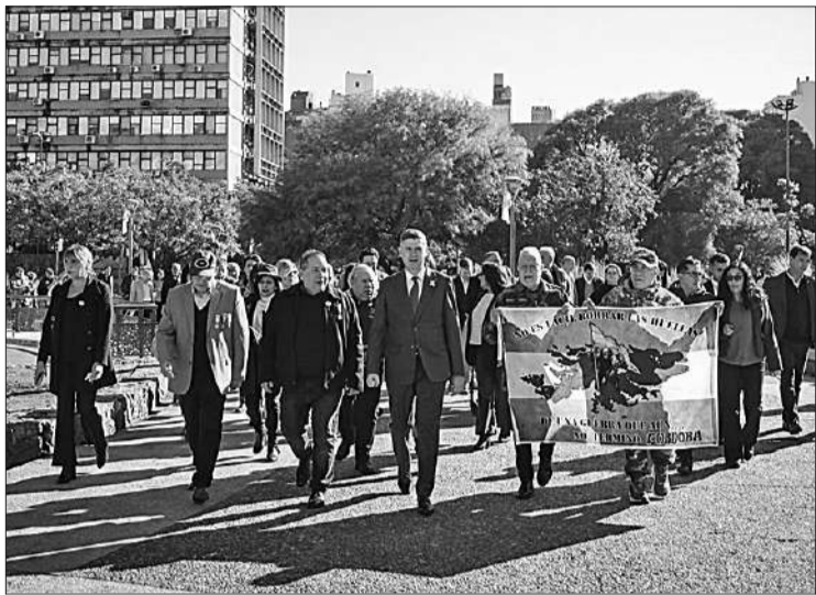
El Intendente conmemoró a los héroes y caídos en Malvinas.