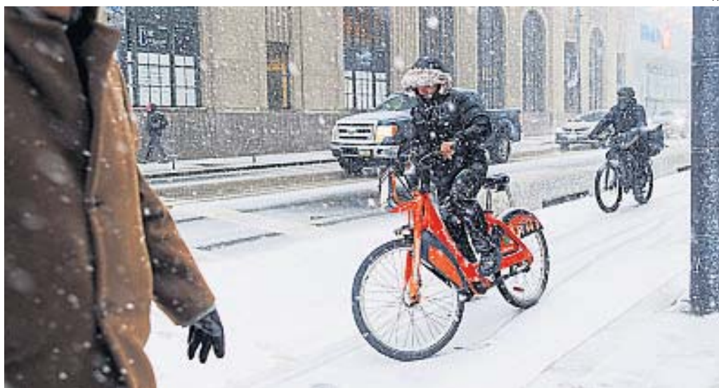
En Toronto, el frío no cede ni en primavera

Personas montan en bicicleta durante una tormenta de nieve primaveral, ayer en el Centro de Toronto, en Canadá.