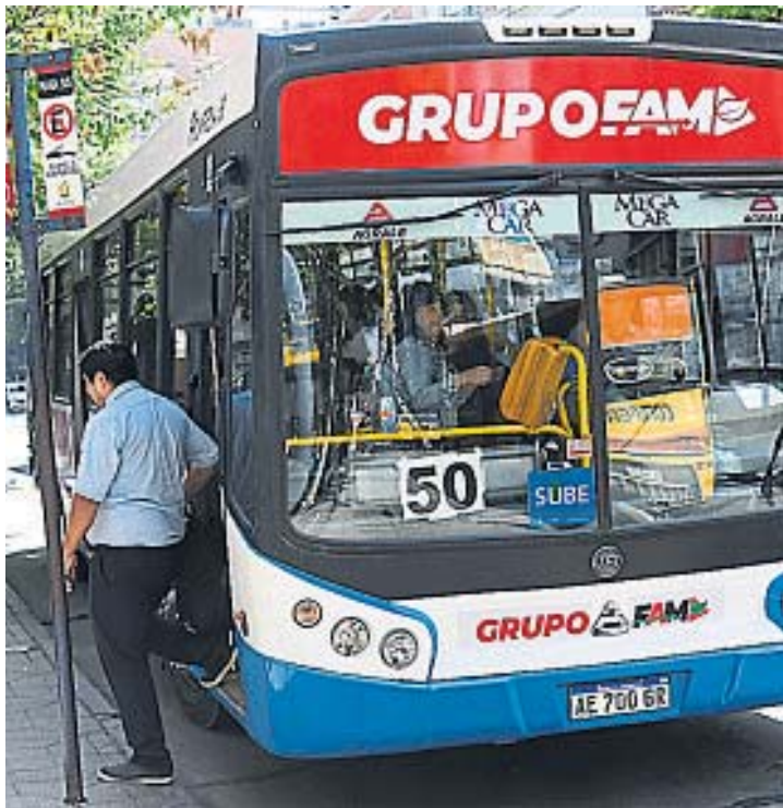
BAJO EXAMEN. El servicio de Grupo FAM está siendo monitoreado por la comuna.

SERVICIOS PÚBLICOS. El intendente afirmó que las frecuencias mejoraron esta semana. La oposición plantea que hay un colapso en el sistema.