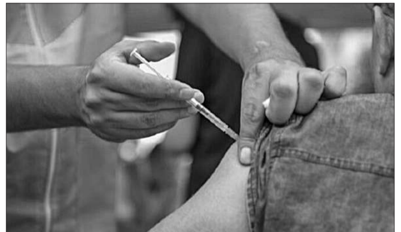
La vacunación se realiza en 100 Centros de Salud y en hospitales públicos.

Está especialmente recomendada para niños y niñas de 6 a 24 meses (quienes recibirán dos dosis si no han sido vacunados anteriormente), personal de salud, mayores de 65 años y personal estratégico, como las fuerzas de seguridad. También se aconseja a mujeres gestantes en cualquier trimestre, puérperas hasta 10 días después del parto (si no se vacunaron durante el embarazo) y a personas de 2 a 64 años con factores de riesgo, como obesidad, diabetes, enfermedades respiratorias, cardíacas, inmunodeficiencias, o pacientes oncohematológicos, trasplantados e insufi-