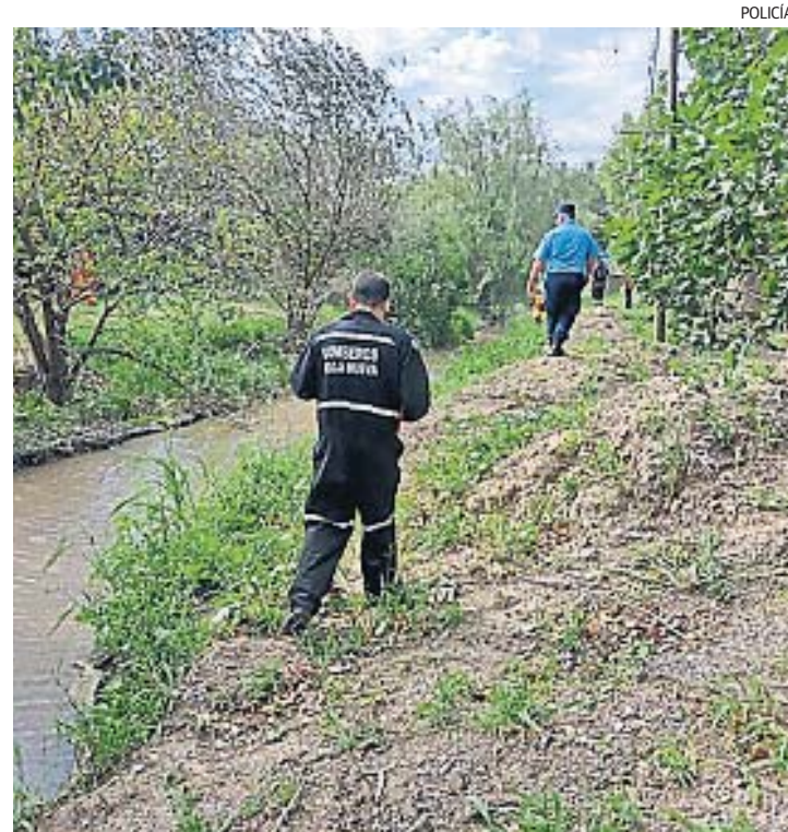
OPERATIVOS. La búsqueda de Héctor Palermo se extiende a campos y ríos.

El operativo viene siendo supervisado por el fiscal Bosio, junto a los