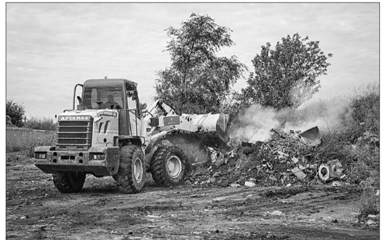
Las cuadrillas de la Municipalidad trabajan en distintos barrios.

Además, los trabajos de limpieza y mantenimiento en la Costanera se están intensificando, con el objetivo de recuperar este importante espacio público. Las tareas se realizan en tres sectores: desde el Puente 15 hasta Turín, desde el Puente Zipoli hasta el Sagrada Familia, y entre el puente Avellaneda y el estadio de Belgrano en barrio Alberdi. Hasta el