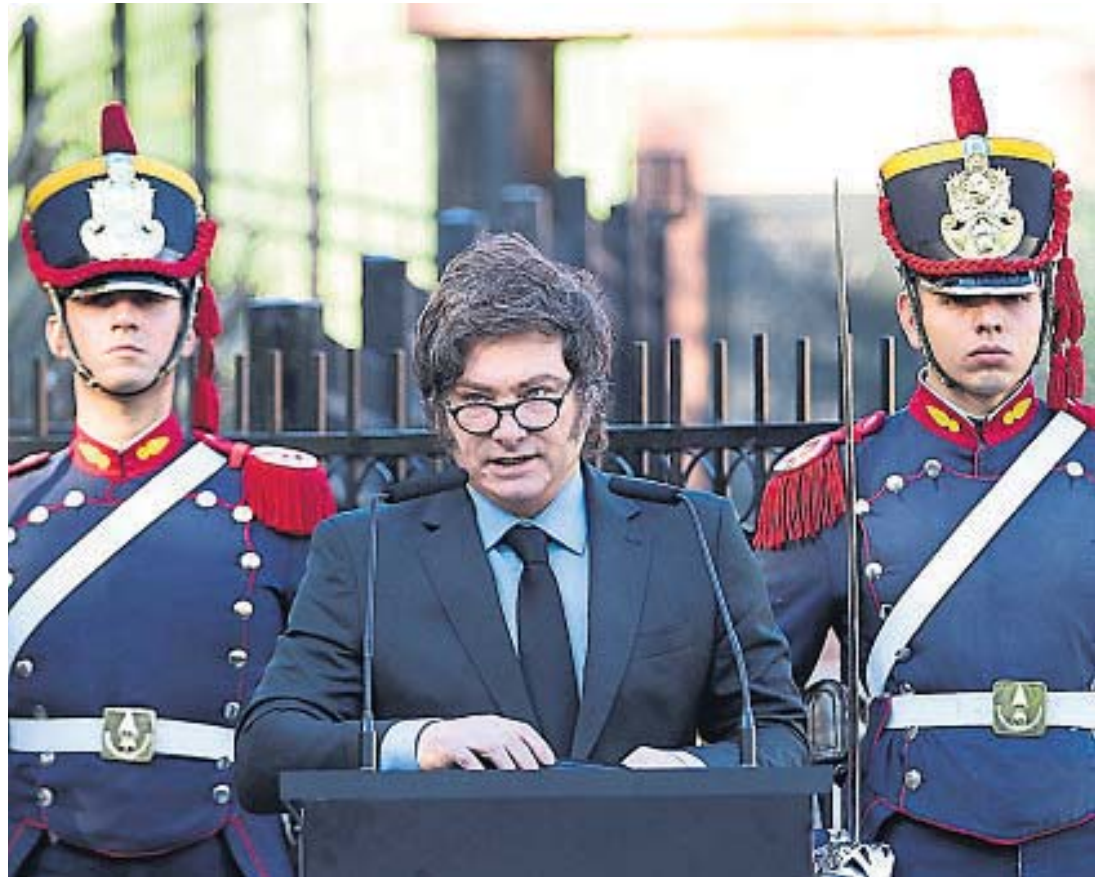
MALVINAS. El Presidente ayer, en su discurso por un nuevo aniversario de la guerra.

NACIÓN. El Presidente reivindicó la soberanía sobre las Islas y planteó un argumento que supone la autodeterminación. Petri negó un cambio en la posición diplomática. El discurso de Milei recibió críticas de Cristina Kirchner y de otros dirigentes políticos.