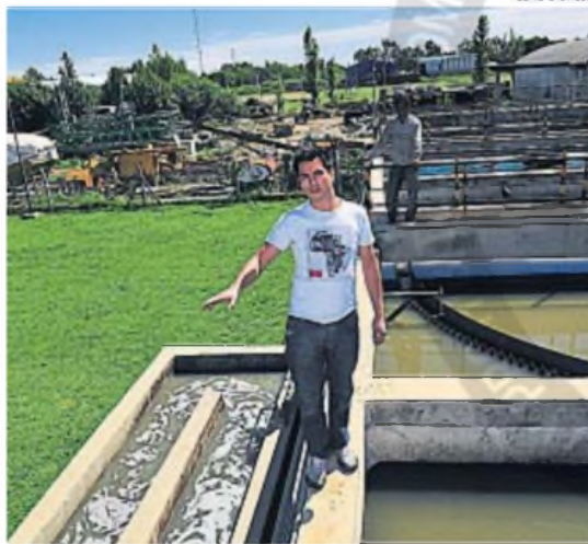
DEFICIENCIAS. La planta operaba con muchas dificultades desde hacía años.