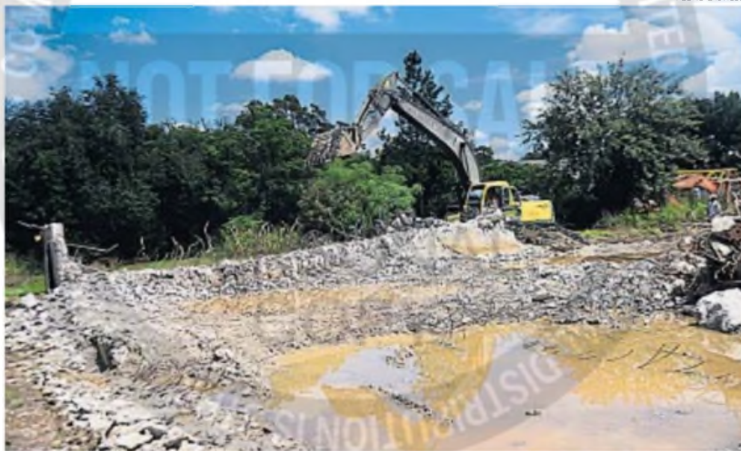
NO QUEDARÁ NADA. Se demolerá por completo y se remediará el predio para ser entregado a sus dueños.