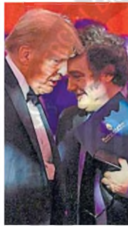
NO TAN PARECIDOS , Donald Trump junto a Javier Milei.

mezcla de proteccionismo y libre comercio, según convenga a sus intereses, dosificando la intensidad según los sectores y productos.