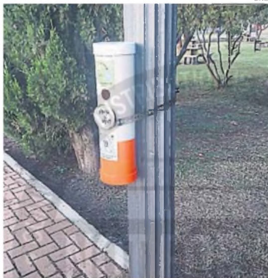
ECOCOLLEROS. Los estudiantes colocaron recipientes para recoger las colillas.

Por otra parte, crearon un proyecto de ordenanza para coordinar con el municipio un trabajo mancomunado con los ecocolilleros instalados en la ciudad. Actualmente, están juntando firmas para que se trate. También planifican para este año llevar a cabo una visita a Ceproc, el centro científico-tecnológico de referencia del Gobierno de la Provincia para analizar cuántos contaminantes quedan