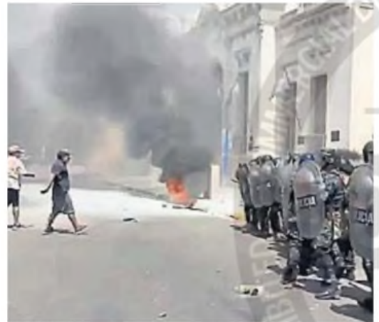
PUEBLADA. Vecinos de Moreno se enfrentaron con la Policía Bonaerense.

En paralelo a su prolifera carrera dentro del peronismo de la ciudad de Córdoba, también ocupó la presidencia del club Avellaneda.