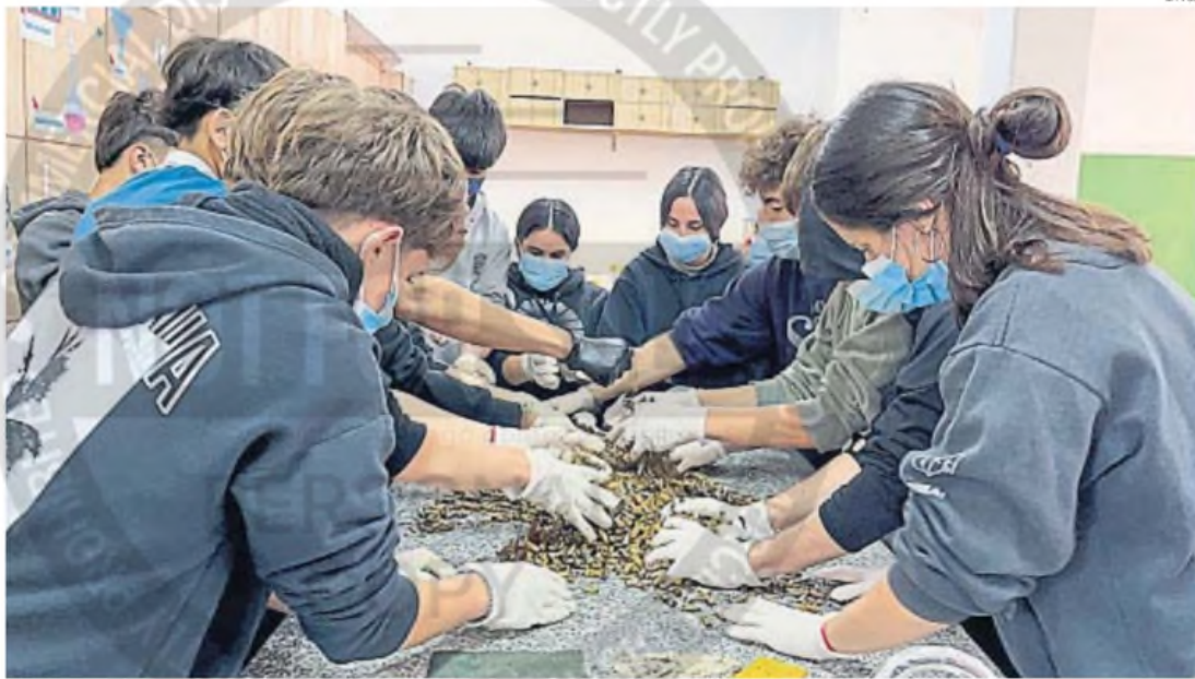
TRABAJO PRÁCTICO. Los estudiantes de quinto año de un colegio de La Carlota innovaron al darle un uso a un residuo contaminante y poco reutilizado: las colillas.