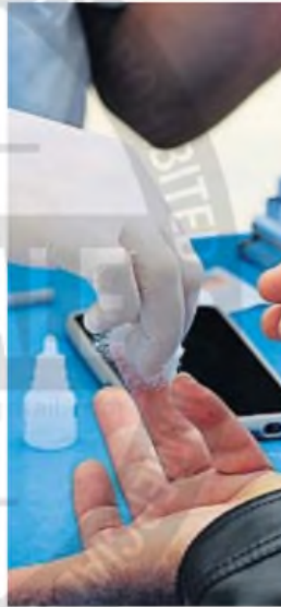
TESTEO. El control de VIH es clave.

En Córdoba, el Ministerio de Salud provincial en 2024 afrontó gastos para garantizar el sostenimiento de programas que dependen de Nación, ante la falta de envíos. Traducido en fondos concretos, la provincia destinó entre 500 y 1000 millones de pesos por mes para suplementar las faltas en todo concepto de medicación que debían recibir de nación pero por demoras o inconvenientes. Esto incluye, por ejemplo, medicación para leucemia, miastenia, HIV (una parte), salud sexual, salud reproductiva, antiofídico, antirrábico, alacrán. En el mes de enero, se asignaron 2.000 millones en este listado para garantizar su disponibilidad.