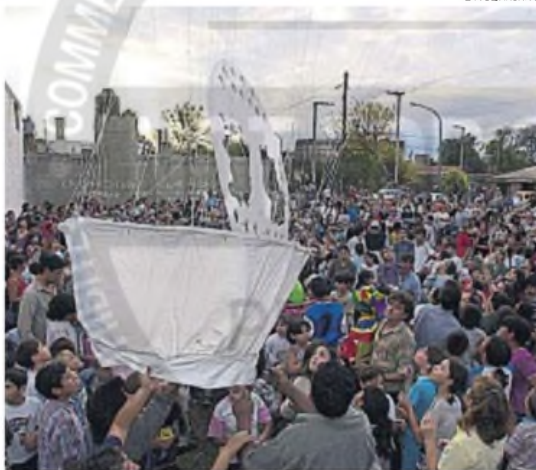
INODORO GIGANTE. Fue el símbolo de las protestas por cloacas en zona sur.

Y, en diciembre pasado, comenzó la demolición para devolver el predio saneado a sus propietarios.