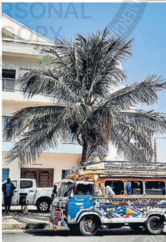
CAR RAPIDES. Lo más curioso del transporte urbano, coloridos y sin parada fija.

Existe también el servicio de autobuses público estatal, vehículos grandes y relativamente cómodos, con rutas fijas que cubren la ciudad y algunas áreas periféricas. Motos de particulares, motos taxis y, aunque no los hemos detectado aún, nos han advertido que también motochorros, zigzaguean peligrosamente entre el resto del tráfico, sobre el asfalto casi siempre. Es difícil caminar relajado