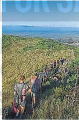
CERCANÍA. A pocos kilómetros de ambas ciudades existe esta maravilla.

Un domingo por la mañana suena ideal para aceptar la invitación