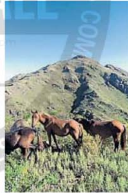
POSTALES. A cada paso, el camino sorprende con paisajes únicos.