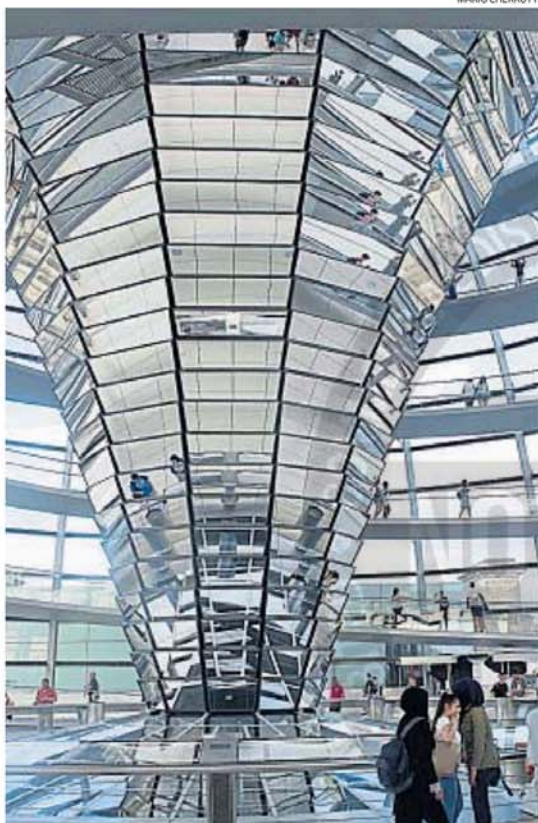
REICHSTAG. Edificio emblemático de la ciudad donde funciona el Congreso alemán. La visita es gratuita e imprescindible.

Un buen lugar para empezar la visita a la ciudad es el edificio Reichstag, el parlamento, ubicado a pocas cuadras de Brandenburgo. Es una de las atracciones principales de Berlín, no sólo por tratarse de una obra maestra de la arquitectura moderna, sino porque ayuda a entender esta ciudad ombligo de la historia del siglo XX. En 1993 el arquitecto inglés Norman Foster ganó la licitación internacional para reconstruir la cúpula del parlamento alemán. Eligió el vidrio como símbolo de transparencia ya que las bancas pueden ser vistas debajo. El cono invertido que se encuentra en su centro y que está revestido por 360 espejos, ilumina la sala ahorrando energía. También cumple un papel en el sistema de ventilación, ya que extrae el aire