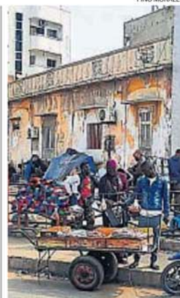
SENTIDOS. Recorrer la ciudad es una experiencia sensorial sin comparación.

por las veredas ya que en toda la ciudad es común, porque está permitido, estacionar ahí los autos. Por este motivo, a muchos de los tramos de a pie hay que hacerlos bajando a la calle y los hacemos encomendándonos a la protección de todos los santos. Las veredas se ponen complicadas también por la cantidad de puestos de venta. En pequeños stands de estructuras de metal o madera y lonas que generan algo de sombra, se venden de igual forma verduras y frutas, ropa nueva y usada, café y