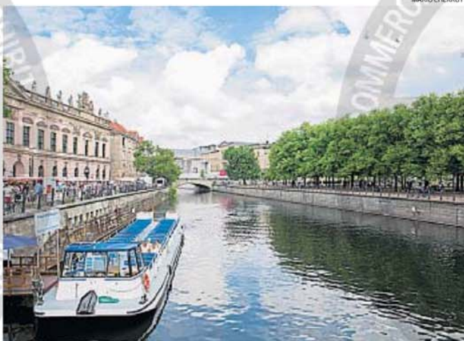
RIO SPREE. Surca la ciudad y en pleno centro forma una isla donde están los principales museos.

MAPAS. En la única capital de Europa donde no queda un solo edificio anterior a 1945, la memoria es parte de la vida cotidiana y sus calles manifiestan las marcas de una historia reciente.