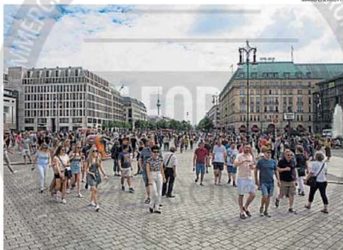
TURISMO. Berlín está en el "top ten" de las ciudades más visitadas de Europa en los últimos años.