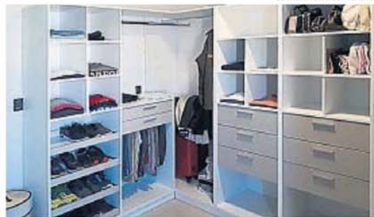
GENTILEZA CÓRDOBA PLACARD

Al respecto, Urizar de SQL Amoblamientos concluye: "La tecnología se distingue en los cajones, tanto en placares como en vestidores. Estamos empezando a utilizar guías ocultas con cierre suave, que son muy superiores a las guías telescópicas, también cajones alhajeros y luces led".