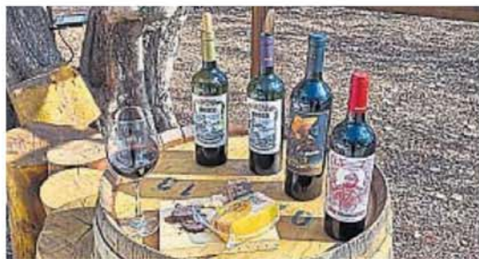
SABORES. El varietal emblema de la bodega es el Lambrusco Maestri.

Para potenciar su impacto social, la Obra Salesiana trabaja en conjunto con Por los Jóvenes-Don Bosco, una organización que promueve la comercialización de productos elaborados en las escuelas agrotécnicas salesianas con un fin solidario. A través de esta alianza, empresas y particulares pueden adquirir vinos, aceites y otros productos para regalos empresariales, sabiendo que están contribuyendo a una causa noble.