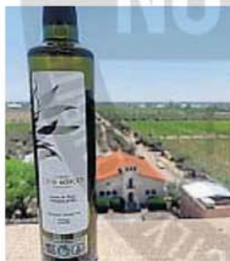
OLIVA. Aceite premiado a nivel mundial.