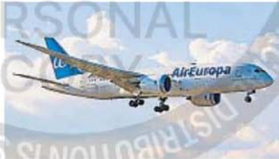
ALIADOS. Air Europa continúa consolidando su papel clave como compañía estratégica en la conectividad con Europa.

El aumento del número de vuelos semanales, que se llevarán a cabo saliendo desde Córdoba los lunes, miércoles, jueves y sábados, permitirá ampliar la oferta a cerca de 111.600 asientos a lo largo del año. Esto supone un 13% más que en el año precedente. Sólo en 2024, Air Europa transportó a través de esta ruta a más