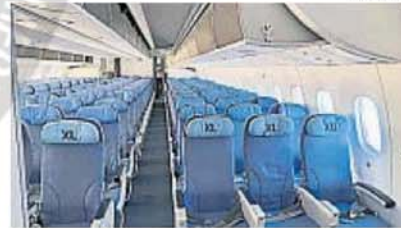
MODELOS NUEVOS. El Boeing 787 Dreamliner que vuela de Córdoba a Madrid es de última generación.

de 88 mil pasajeros, con unos índices de ocupación que rondaron el 90%.