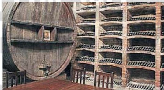
PASADO. Visitar una antigua cava del 1800 es una experiencia única.