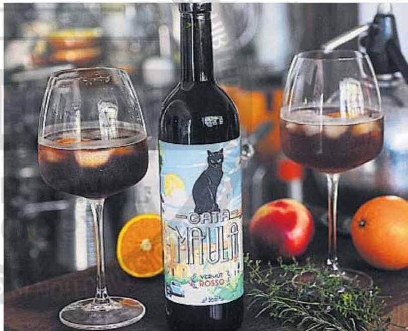
GATA MAULA. Hecho a base de malbec de Calamuchita. Forma parte del proyecto de la vermutería ubicada en Nueva Córdoba.

El rey de los vermouths. Por ser el prime-