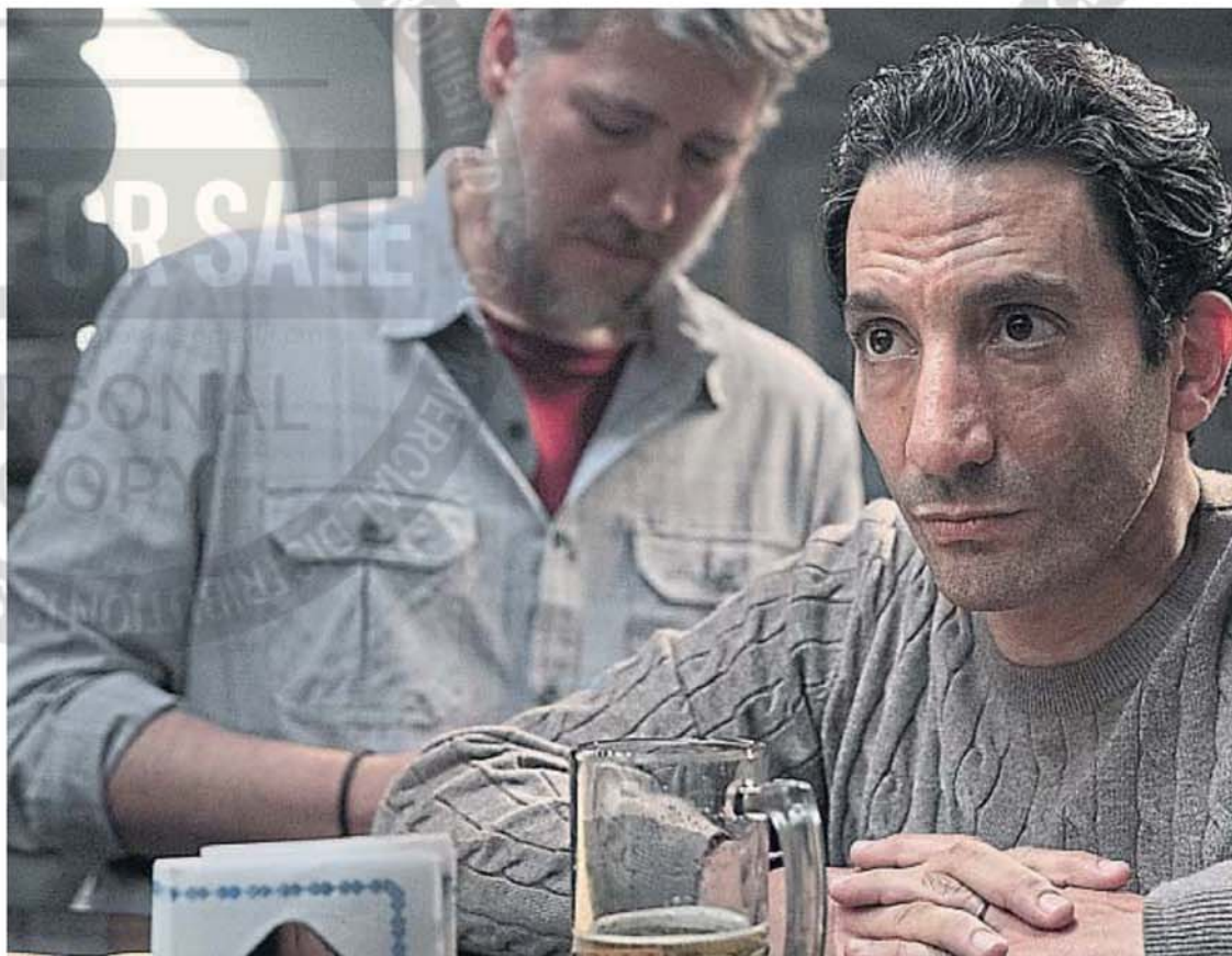
PROTAGONISTAS. Juan Minujín (al frente) y Alberto Ammann (fondo), interpretan a Marcos y Leo, dos amigos de toda la vida que se tratan como hermanos.