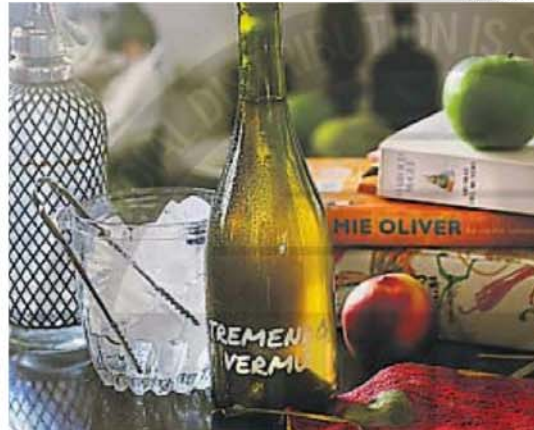
TREMENDO VERMUT. Una opción hecha con cepas de uvas blancas.

Las marcas artesanales han impuesto el toque de lo diferente y con eso han enriquecido la cultura del vermouth.