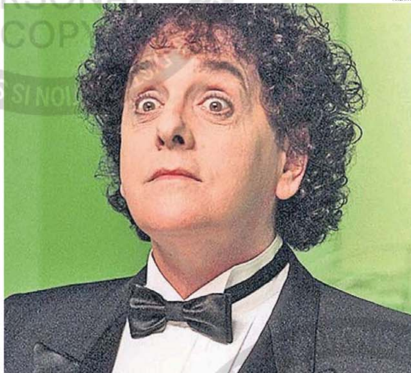
ANTONIO GASALLA. Genio del humor y creador de personajes inolvidables en la televisión y el teatro.