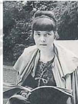
KATHERINE MANSFIELD. Escritora neozelandesa que vivió en Londres.

Yo, modesta escritora, comprendo a Virginia. Comprendo por qué quedó seducida por esa extraña joven que venía de alguna remota colonia del