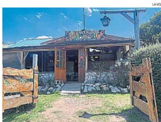
RUTERO. Sobre la ruta 38, un cartel da la bienvenida a los comensales.

Aquí sobra la buena voluntad y en un tiempo habrá que volver a probar.