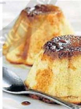
FLAN CASERO. Un ejemplo de postre al que nadie se resiste.

Me encanta salir a cenar, a veces a restaurantes que tienen platos especiales; otras, a lugares sencillos, cerca de casa, donde me siento a gusto y el mozo me conoce. Y si bien muchas veces me abstenia del postre –lo dulce me tienta a la medianoche, como si fuera una Cenicienta golosa–, he descubierto que se está volviendo a aquellos postres tradicionales argentinos que los que tenemos más edad recordamos con añoranza: el flan casero, la famosa ambrosia, el pos-