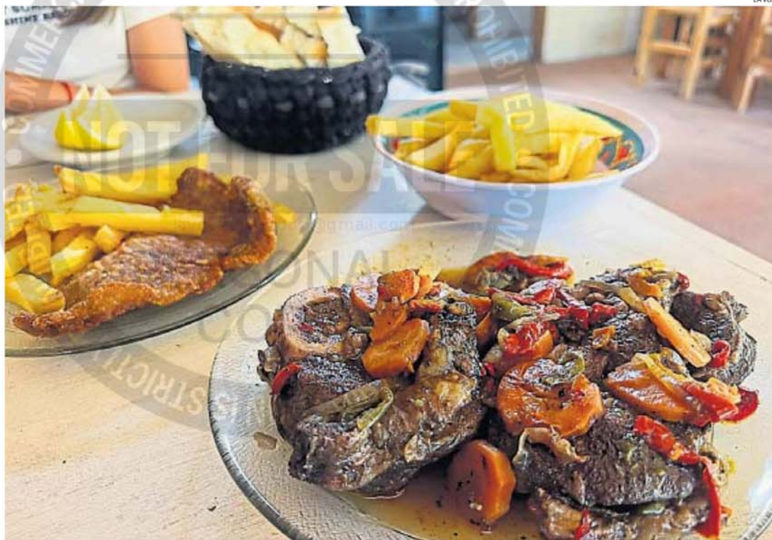
OPCIONES. Este restaurante rutero ofrece dos opciones: milanesas fritas y osobuco al disco, en ambos casos con papas caseras.

COMENTARIO. El Bodegón de la 38 ofrece minutas, como empanadas y milanesas fritas, y también osobuco al disco.