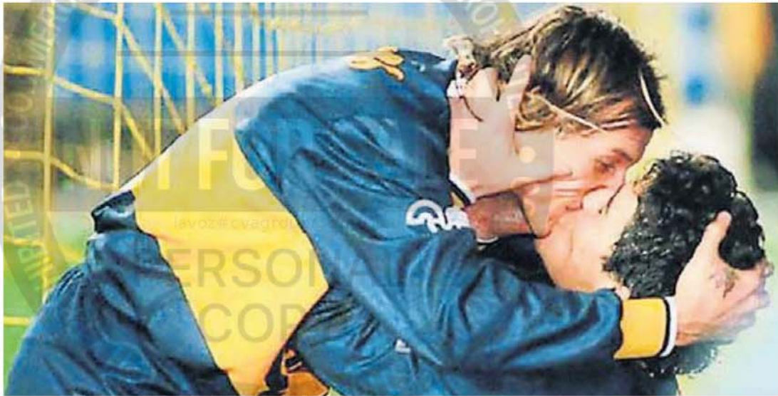
EL "PIQUITO" MÁS FAMOSO. El beso de Caniggia y Maradona abrió toda una serie de miradas sobre la amistad y el homoerotismo.

ENTREVISTA. Matías Moscardi y Andrés Gallina proponen en "Museo del beso", un recorrido en pequeño formato por las diversas formas del beso, desde los apasionados a los protocolares.