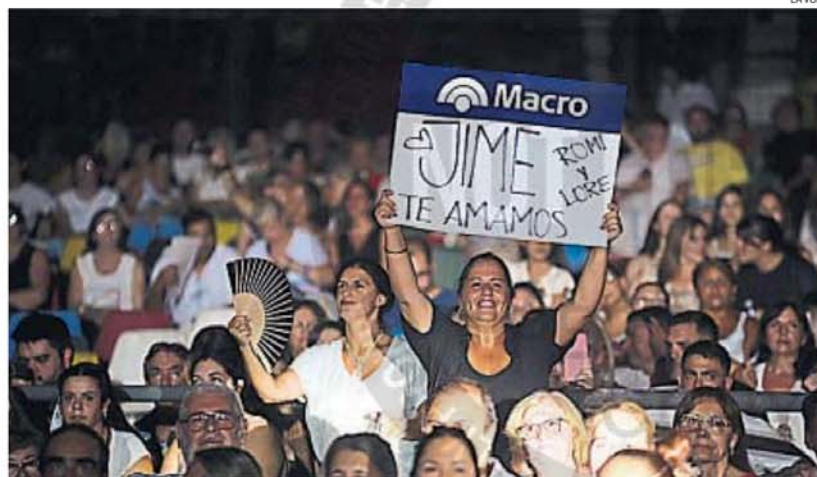
AGUANTE. El público de J Mena bancó a "la Cobra" en el inicio de un show que, en pocos minutos, contagió al resto del anfiteatro.

Luego, la artista pidió el pie del micrófono y agua. "Porque si no van a grabar mi muerte acá en el escenario", justificó antes de otra humorada: "Bueno, igual se viraliza y sirve".