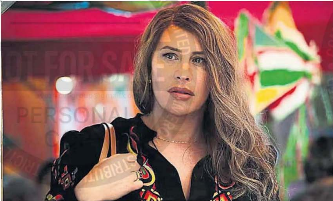
PROTAGONISTA EN LA LUPA. La española Karla Sofía Gascón, blanco de críticas por una serie de tuits racistas y gordofóbicos. Es la primera actriz trans nominada a los Oscar.

Cuando Emilia Pérez se estrena en el Festival de Cine de Cannes, el lugar donde se conforma el canon cinematográfico del cine de autoría y el que marca el camino de cuáles serán las películas más importantes del año, la confusión y el estorbo se instalaron entre sus primeros espectadores.