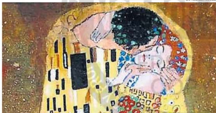
CAPTURA DE PANTALLA

EL BESO DE KLIMT. Es una de las pinturas más famosas del pintor austriaco.