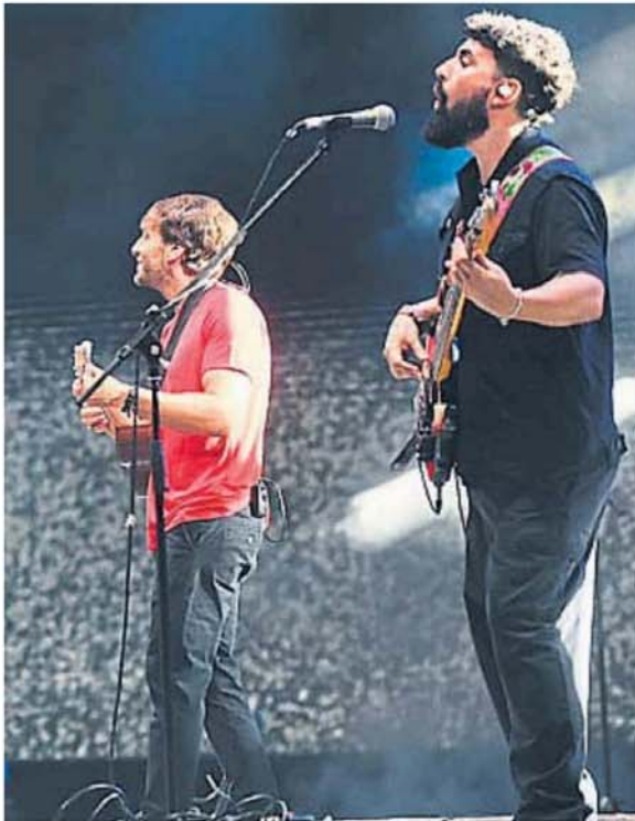
aglietto a cantar con ellos "El témpano". Fue un gran momento en la noche de apertura.