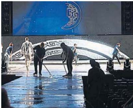
CONTRARRELOJ. La producción secó el escenario cerca de las 22.

Tras la presentación del Ballet Escuela Municipal de Folklore danzando al ritmo del Himno a Cosquín, Ahyre salió a escena para hacer vibrar los corazones y calentar un