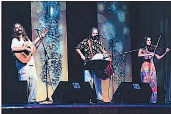
Los Copla en el año 2000, cuando se llevaron el premio Consagración