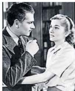
REBECA, UNA MUJER INOLVIDABLE. La película de Alfred Hitchcock.

La atracción de Rebeca es la vieja receta de la cenicienta en peligro, la dama dragón tras la puerta, y el aire gótico de la mansión, y el tema es un