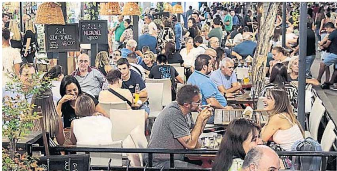
TEMA ESPINOSO. Afortunadamente no ocurre en todos los restaurantes, pero hay muchas propuestas gastronómicas en Carlos Paz que vuelven a hacer agua otro verano más.

¿Qué queremos demostrar no dejando pasar a comer a gente en bermudas o en musculosa, como le pasó a Osvaldo Laport?