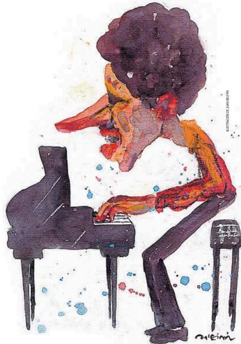
ILUSTRACIÓN DE JUAN DELFINO

Ya había grabado un disco de piano solo, Facing you , tocando standards , y estaba empezado a ser reconocido por sus largos viajes sonoros después de haber tocado magistrales conciertos en Bremen y Lausanne, ofreciendo extensas secuencias en el