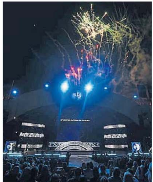
AQUÍ COSQUÍN. Los fuegos de artificio fueron otra de las postales de la noche.