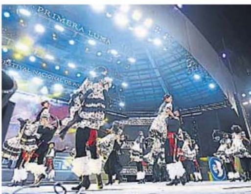
BALLET. Le dieron color al comienzo del clásico encuentro coscoino.