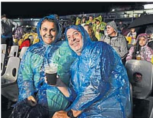
EL AGUANTE. Pilotín y vaso en mano, se atravesó la tormenta con buen cara.

Cosquín 2025: cómo ver la transmisión. El Festival 2025 se puede ver en vivo desde las 22 a partir de una transmisión de Canal 10 de Córdoba, que será replicado a todo el país por la TV Pública. También se podrá seguir sin interrupciones por el canal de YouTube de La Voz.