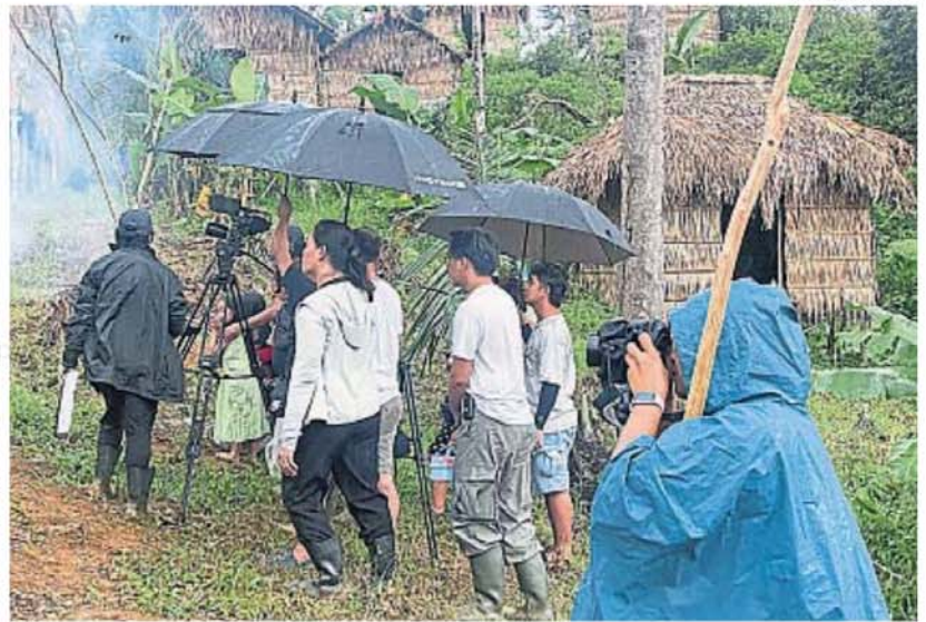
RODAJE. El equipo filipino e internacional en medio de la exuberancia de la selva asiática.

Inesperadamente para él, quien se acercó a consolarlo por su angustia, fue el mejicano. "En un momento me lo cru-