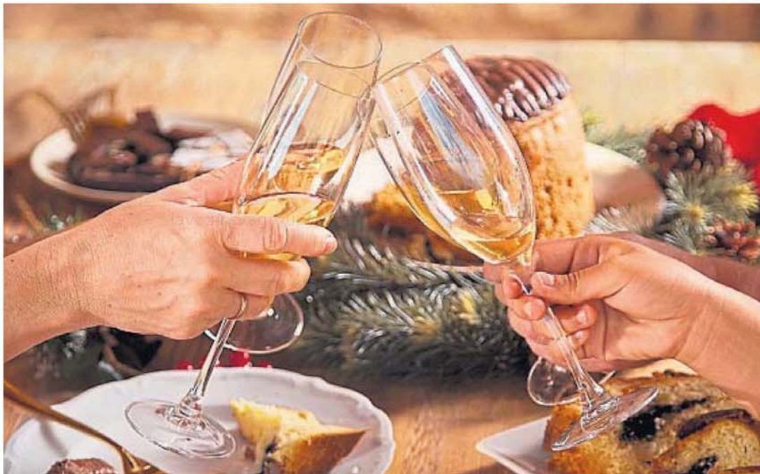
NOCHEBUENA. Muchos prefieren salir a comer afuera antes que encargarse de recibir invitados en su casa. Para ellos, hay opciones.

FESTEJOS. Un repaso de los costos por persona de las tarjetas para celebrar las fiestas en restaurantes de la ciudad de Córdoba y del interior.