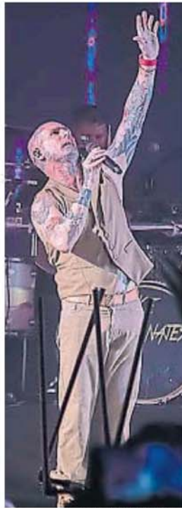
EMANUEL NOIR DE KE PERSONAJES