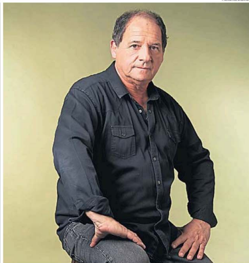
PRENSA LO SAGRADO

"Este es uno de los teatros que queremos hacer, esto contiene una ideología en la que creemos y que hace que el espectáculo tenga sus espectadores, y sus no espectadores también", apunta y