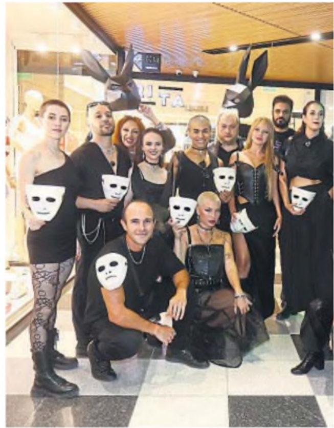
EXPECTATIVA. Todos los elencos se preparan para una temporada desafiante, con más de 100 mil

Atentos a la gran cantidad de reservas para Brasil (país que devaluó y tiene precios muy competitivos),