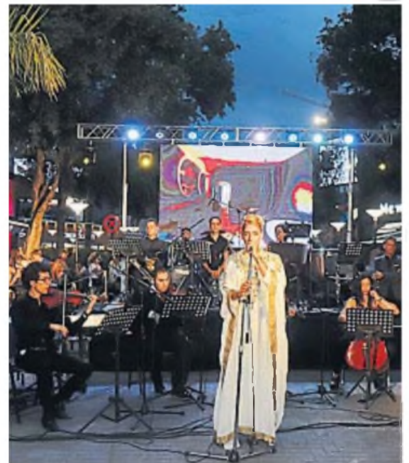
SHOW. La apertura de temporada también incluyó música y canto.

La fiesta de apertura fue distinta a la de otros años ya que estuvo marcada por el corte de cinta de un nuevo atractivo para la villa turística, un centro comercial en el microcentro y con una vista espectacular del lago San Roque.