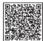
TODAS LAS OBRAS PARA VER EN ESTA TEMPORADA EN CARLOS PAZ

Dirección de Adrián Vocos. Todos los sábados, a las 22:15, y domingos, a las 015 Auditorio Municipal (Liniers 50) Resto Show. Espectáculo inclusivo con streaming en vivo. Más de 20 artistas en escena con dirección de Paula Di Rienzo. Todos los lunes, a las 22:30 Multiespacio Bahía del Gitano (av. Cárcano 1650) La Kumbata homenaje. Espectáculo musical con La Kumbata. Todos los jueves, a las 21:30.