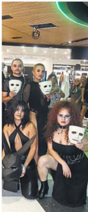
Obras en cartel.

"Vienen a verlo a él. Eligen el día, van a cenar, van al teatro y luego se vuelven a la casa. Es una salida rápida. El cordobés de la Capital es teatrero y va mucho a Carlos Paz a ver obras. Por eso nosotros apuntamos nuestra comunicación a ellos", cierra.