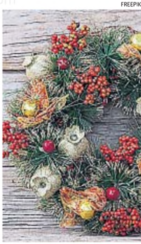
NAVIDAD. Fecha para la reconciliación.

Hemos dejado detrás situaciones que se sostienen con hilvanes, circunstancias confusas, escollos que debimos derrumbar o, al menos, subsanar, indecisiones que fuimos posponiendo más allá de lo saluda-