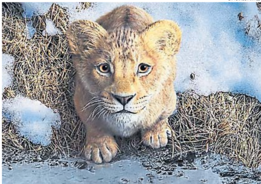
CAPTURA DE PANTALLA

PRECUELA. El filme, basado en el clásico animado, ahora hecho con la técnica digital del "live action".