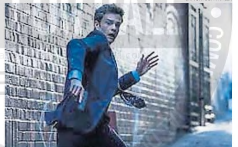
"NOVOCAINE". La nueva película de acción protagonizada por Jack Quaid.