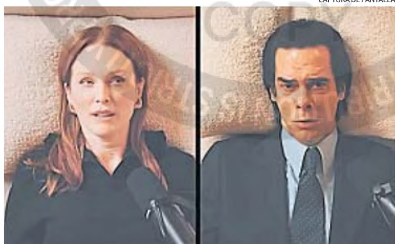
ENTREVISTAS AL DIVÁN. Julianne Moore y Nick Cave, entrevistados por Bella Freud.

Una de las ideas más instaladas de la buena moral defiende el interior de una persona frente a la apariencia: “Lo importante es lo de adentro”. Por conveniencia, no nos detenemos a decir importante para quién, para qué ni por qué. Fashion neurosis es un ciclo que cuestiona esa supuesta frivolidad de lo externo en el caso particular de la moda.