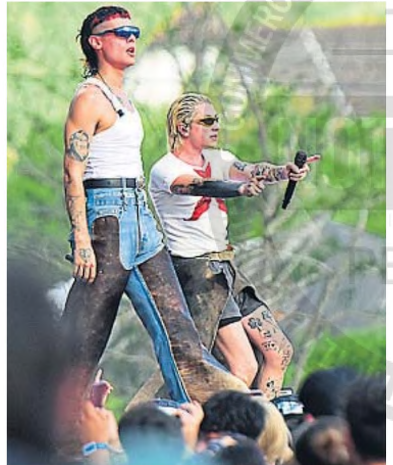
COSQUÍN ROCK 2025. El dúo fue una de las atracciones fuertes de todo el festival.

ceso de su Tiny Desk y lo ampliaron con nuevas canciones y un shortfilm en YouTube aún más delirante y jugado. Está siendo un suceso.