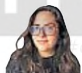
Ernestina Godoy Especial