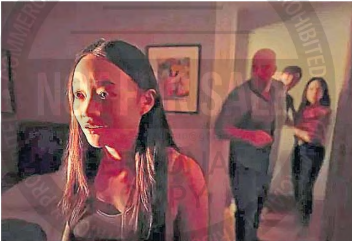
DE MIEDO. Los planos secuencia que el propio Soderbergh filma cámara en mano fusionan el lente con un protagonista espectral.

COMENTARIO. Soderbergh combina el "thriller" de terror con un experimento técnico en su nuevo filme, aunque sin explorarlo del todo. Calificación: buena.