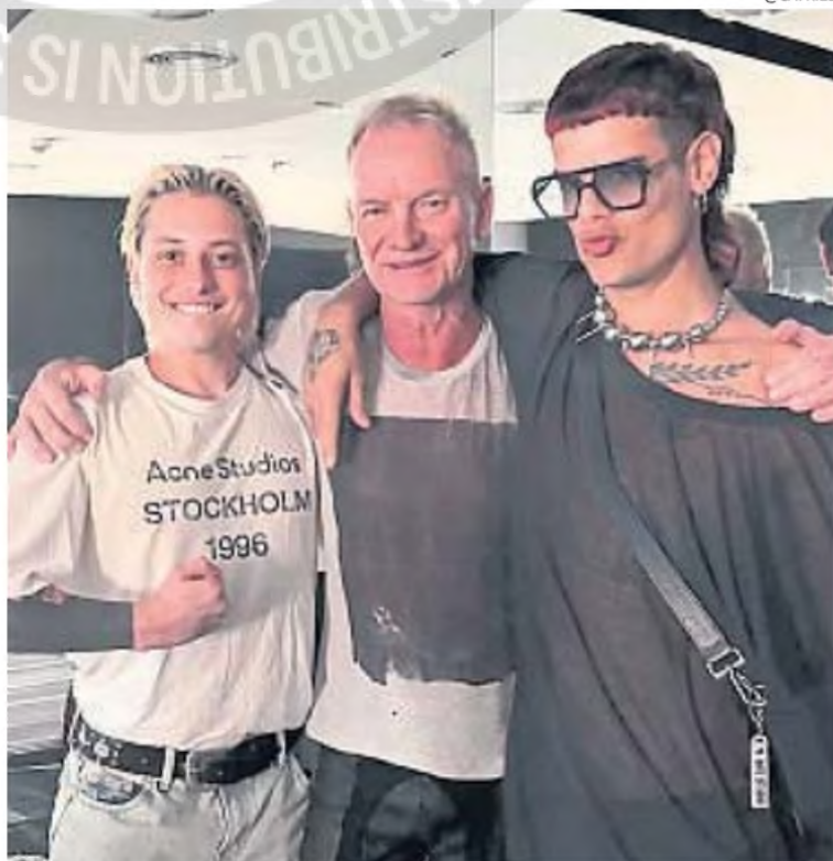
IMPENSADO. Junto a Sting, en febrero. "Saltamos a la fama rápido tras el Tiny Desk".

Luego del reciente estreno de Papota —disco que capitaliza las versiones del Tiny Desk y suma cuatro temas inspirados en esa misma organicidad funky y neosoulera—, las piezas del rompecabezas terminaron de acomodarse. Hoy, Ca7riel, Paco y su pandilla giran por Latinoamérica y se darán una panzada de festivales de primera línea. Es apenas el comienzo de una agenda anual que hasta el