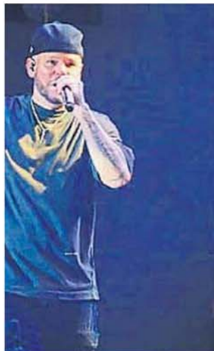
regada por músicos de un vuelo enorme.

Al cierre de esta edición, tenía que subir a escena Damas Gratis y el Dj Steve Aoki. El Bum Bum pasó con éxito su edición más ambiciosa e importante hasta el momento.