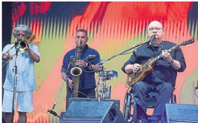
EMOCIÓN. Os Paralamas volvieron a Córdoba a casi 40 años de haber tocado en un Chateau Rock. Herbert Vianna estaba más que agradecido con el público.