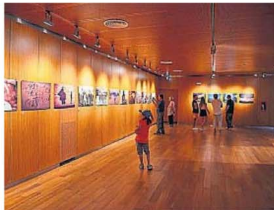
MUSEO METROPOLITANO. Tiene una muestra de fotografías de Sigismondi.

Museo Iberoamericano de Artesanías. Pasaje Revol esquina