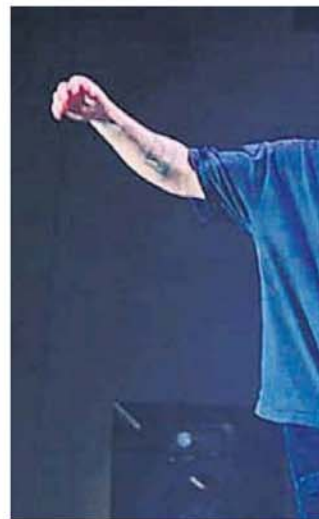
ALTÍSIMO NIVEL. La banda de Residente estuvo int

El grueso de personas que ingresó a las 18 se encontró con un impecable recital de Indios. Los rosarinos recibieron a la gente con la cuota pop rock del festival y hits que se disfrutaron desde las sombras que hacían los mangrullos y algunos árboles. Perdiendo la cabeza. Tardes de melancolía. Tu geografía y Jullie