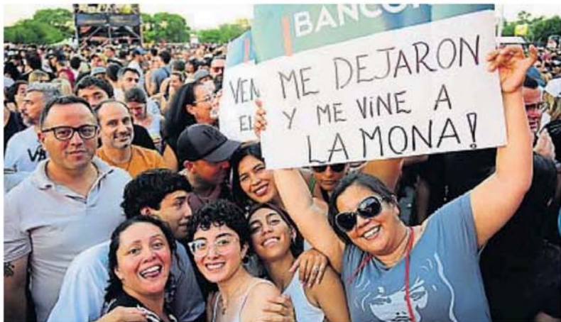
LOS FELIGRES. Los seguidores de La Mona volvieron a hacer realidad su ritual anual de festejar el cumpleaños de su ídolo.

Nicolás Lencinas nlencinas@lavozdelinterior.com.ar