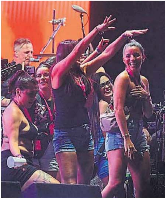
gran número de chicas para su último tema, "Rastaman-dita".