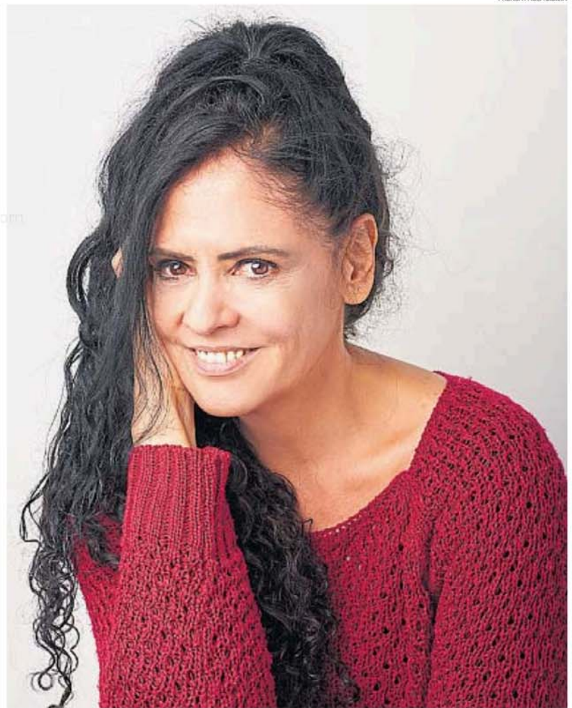
PRENSA PAULA SIBILIA