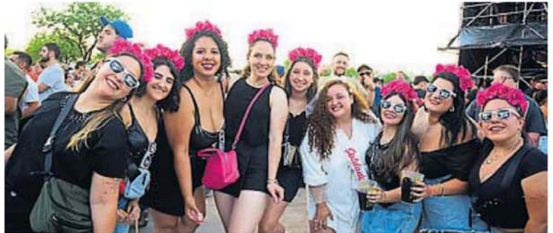
PREPARADAS. Un grupo de amigas preparadas para la ocasión. La organización estimó la asistencia en 30 mil personas.

Uma Brasileira e Inundados. Así, la noche cayó con la calidez de Paralamas, una banda de lujo. Antes de bajar hubo versión del Rap de la hormiga . "Esta la grabamos con Charly en 1986", recordó Vianna.