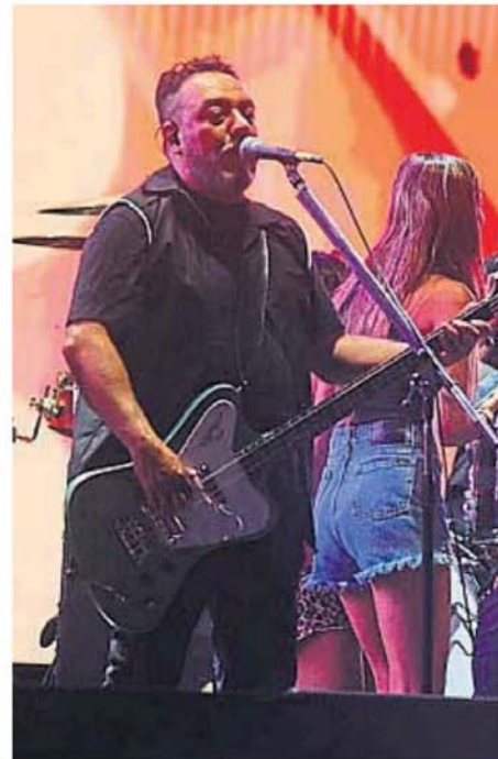
DESCONTROL. Los mexicanos de Molotov volvieron a subir a escena a un

CUARTETO. El Mandamás reunió una imperdible oferta de artistas y los dos escenarios montados en la playa del Kempes fueron testigos de shows de nivel internacional.