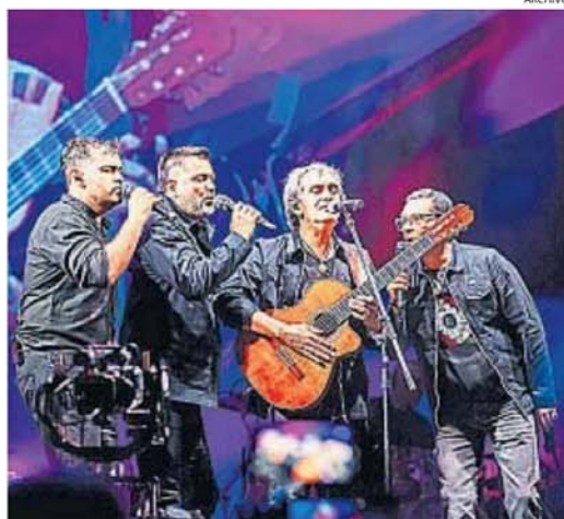
TODAS LAS VOCES. Jorge Rojas y Los Nocheros, programados en la misma noche.