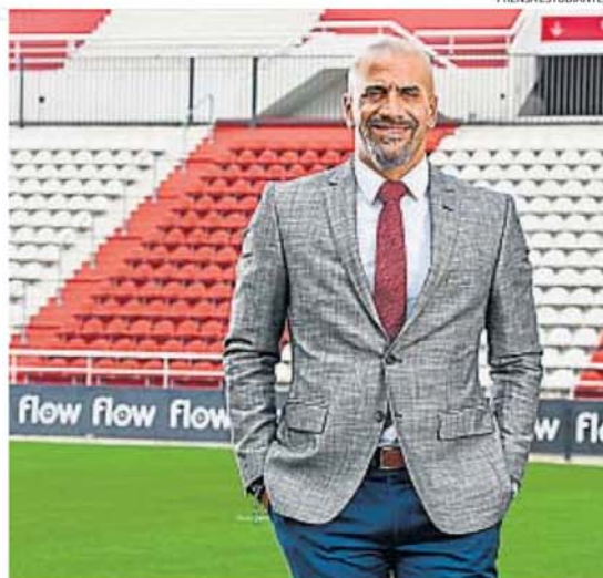
CON TODO. Estudiantes, presidido por Verón, tuvo un gran empuje económico.