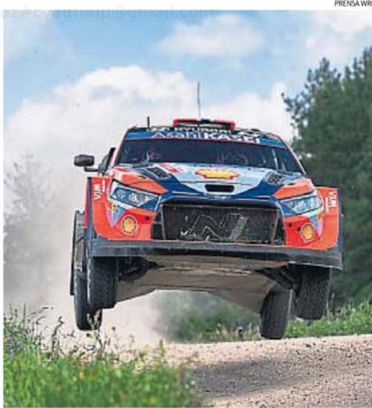
EL CAMPEÓN. Neuville se quedó con el cetro 2024 y va por más con Hyundai.

competencias introducido en 2024 fue objeto de muchas controversias, como que el ganador de una prueba, a veces, sumaba menos puntos que los que terminaban detrás en la general. En virtud de ello, ahora habrá 35 puntos para repartir en cada competencia y se eliminará el puntaje por la general de viernes y sábado.