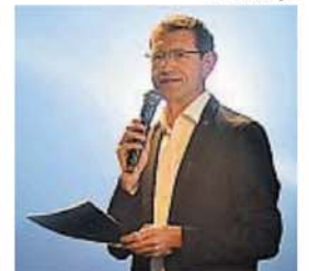
CAVATORTA. Director de Vinculación.