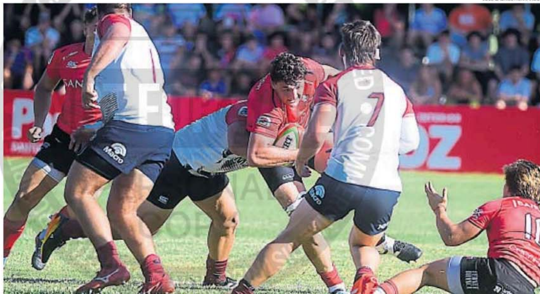
ALTA TEMPERATURA. Fue con la que jugaron en Jardín Espinosa Dogos XV y Pampas. Más de tres mil espectadores disfrutaron de un partido cambiante y atractivo.

RUGBY. La franquicia cordobesa igualó en el clásico con Pampas 20-20, por la 2ª fecha del SRA. Ante un tremendo calor y en Athletic, al campeón se le escapó. Fallaron conversiones y penales.