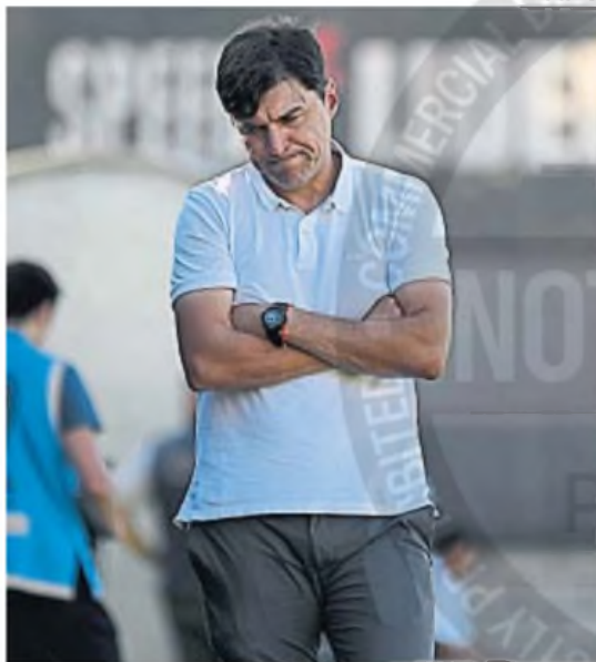
CUESTA CONVERTIR. Medina ponderó lo hecho por la "T"; pero sabe que faltan goles.

nas jugadas confusas, mucho de discutir y poquito de jugar.