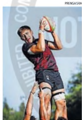
A JUGAR. Dogos XV en Córdoba Athletic por primera vez: es su nueva casa.

caras, que sucedió en la final de la edición 2024 del SRA en el Club Atlético San Isidro, los conducidos por Galatro pisaron fuerte, se llevaron el partido por un contundente 37-23 y gritaron campeón.