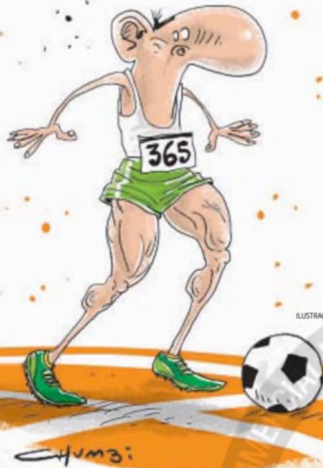
ILUSTRACIÓN DE CHUMBI

Este fenómeno también sería percibido por muchos hinchas en general, quienes sostienen que siempre que prenden el televisor están jugando equipos como Instituto, Central Córdoba o Defensa Ilusión óptica masiva televisiva o el