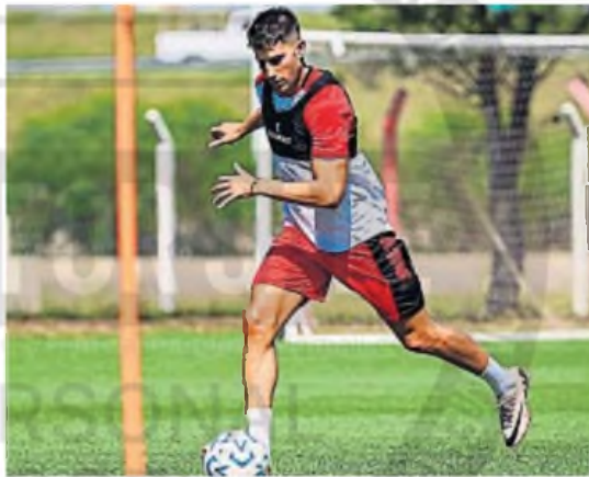
CORDERO. El delantero jugará su segundo partido con la casaca de la Gloria.

LIGA PROFESIONAL. La Gloria visita en Avellaneda a Independiente desde las 18. Tras la caída ante San Lorenzo, el Albirrojo necesita recuperarse.