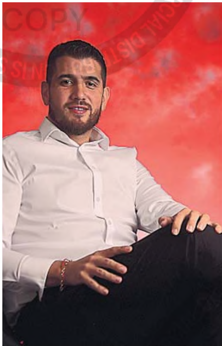
CAVAGLIATTO. El presidente de la Gloria, en La Voz, para la grabación del pódcast.

Visiblemente orgulloso por todo el trabajo que viene realizando su