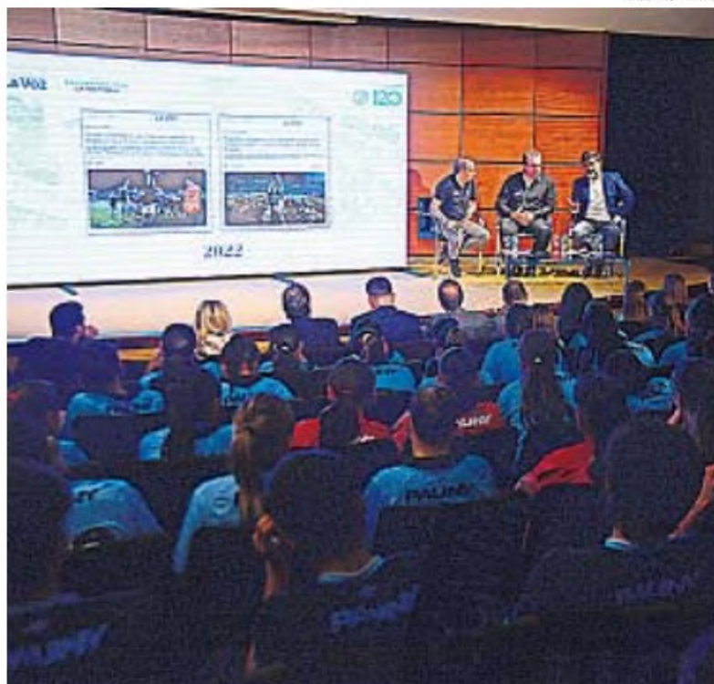
A PLENO. Con muchos chicos y chicas de las inferiores se dio la charla sobre Belgrano.

El máximo dirigente celeste se refirió al vínculo de la institución que lidera con La Voz : "Es un orgullo estar aquí. El diario transmitió la historia del club tan amado por todos nosotros".