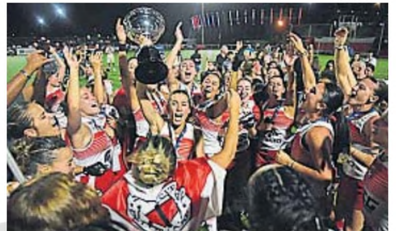
EL ESTRENO. Universitario, campeón 2024, debuta ante La Tablada, en el Kempes