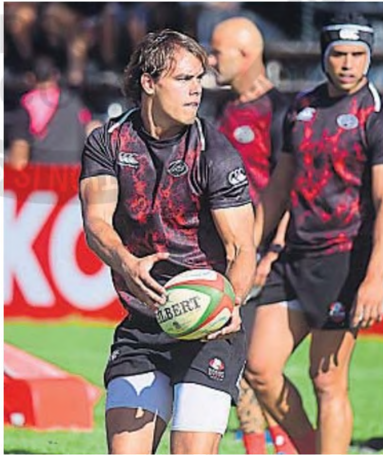
SE MUEVE. El fullback cordobés en la previa a su debut como titular en Dogos XV.

regresó a Córdoba y se sumó al plantel de Athletic. Fue campeón del Torneo Oficial con el club y comenzó a trabajar en un estudio de arquitectura, donde realiza tareas afines a sus estudios universitarios. Pero su foco sigue estando en ser profesional de rugby.