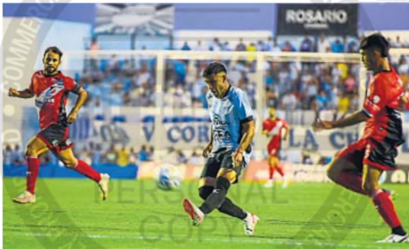
POR LA RECUPERACIÓN. El equipo de Cochabamba cayó en su estreno ante Maipú y hoy buscará sus primeros puntos en el sur.

PRIMERA NACIONAL. La Academia visita desde las 19 a Deportivo Madryn, por la segunda fecha de la Zona A. Los dos comenzaron con derrota.