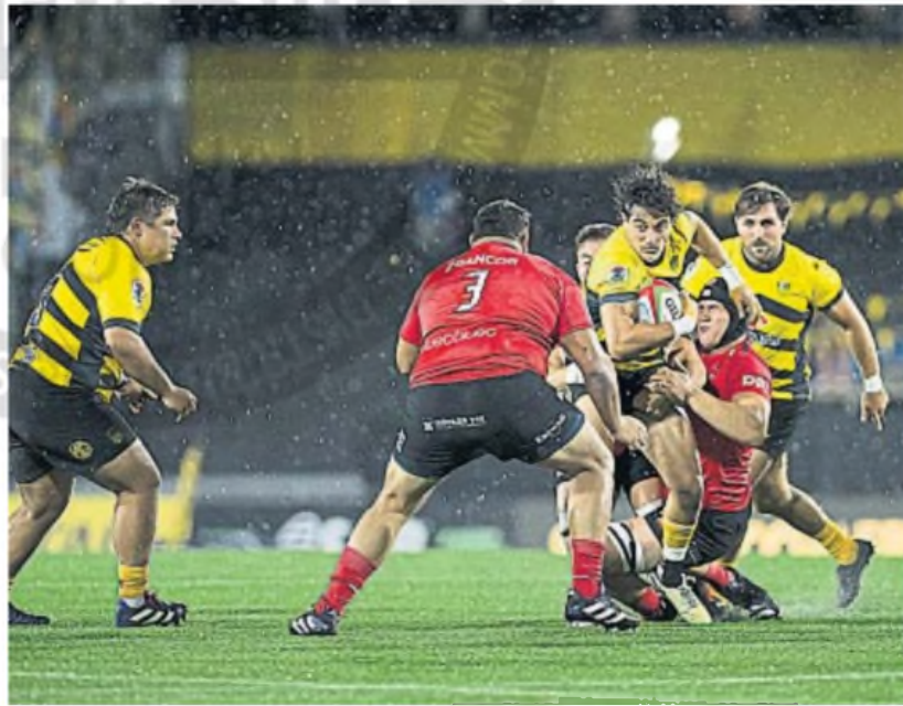
PARTIDAZO. El que animaron anoche Peñarol y Dogos XV. No tanto por el nivel de juego como por la personalidad de ambos.