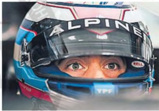
PRENSA ALPINE COLAPINTO. Trabaja a la espera de sus chances como titular en el equipo francés.

En estos días, el circuito de Jerez de la Frontera es el epicentro de las pruebas que la Fórmula 1 desarrolla junto con Pirelli para analizar el comportamiento de los neumáticos que se utilizarán a partir de 2026. Sin embargo, el foco de atención también está en la estructura de Alpine,