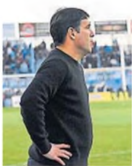
COCHAS. El entrenador de Racing inicia su propio proceso en la Academia.

Racing de Nueva Italia se prepara para afrontar una nueva temporada en la Primera Nacional. El equipo albiceleste trabaja en la parte más importante de la pretemporada en la localidad cordobesa de Río Segundo. La Academia está inserto en la Zona A y el primer compromiso oficial será el segundo fin de semana de febrero en el Miguel Sancho ante Deportivo Maipú de Mendoza.