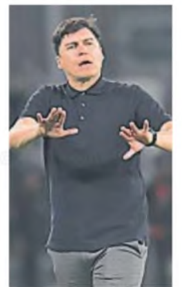
MEDINA. Evalúa a sus jugadores buscando el mejor equipo para 2025.

Tras los ensayos de hoy, se trabaja en confirmar dos amistosos más para la semana que viene: uno entre semana y otro el sábado próximo, pero lo más probable es que sean en Buenos Aires, ante la falta de rivales que puedan viajar a Córdoba.