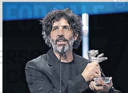
DESCARGO. El realizador aseguró que la cultura argentina está "desmantelada".