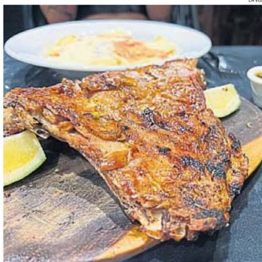
CABRITO. El plato estrella de cualquier restorán de comidas típicas.

Calificación: bueno Leandro N. Alem 20, Carlos Paz. Teléfono (03541) 152-81918 Abierto todos los días desde las 12 y desde las 20. Efectivo y tarjetas.