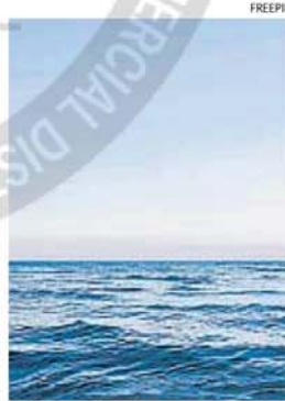
MAR. Se termina el verano pero aún hay tiempo para disfrutar de su brisa.

Postre de frutas: 1/2 kilo de uvas rosadas, grandes; 1 ananá fresco, pelado; 2 kiwis maduros; 50 g de pasas de uva remojadas en chardonnay; 2 limas exprimidas (trillar la cáscara antes); 2 clavos de olor (optativos), retirarlos antes de servir; 1 pizca de pimienta negra molida; 3 cucharadas de azúcar o algunas gotas de stevia. A elección: 4 papas grandes, hervidas, o 1 kilo de tomatitos cherries.