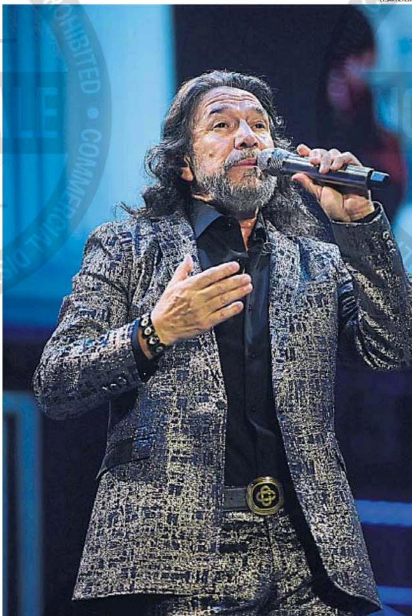
UNO MÁS. El cantautor mejicano disfrutó junto a las 10 mil personas que se acercaron a escuchar sus canciones y sus reflexiones.

"Imaginense la emoción", exclamó el papá al ver que su hija ocupaba