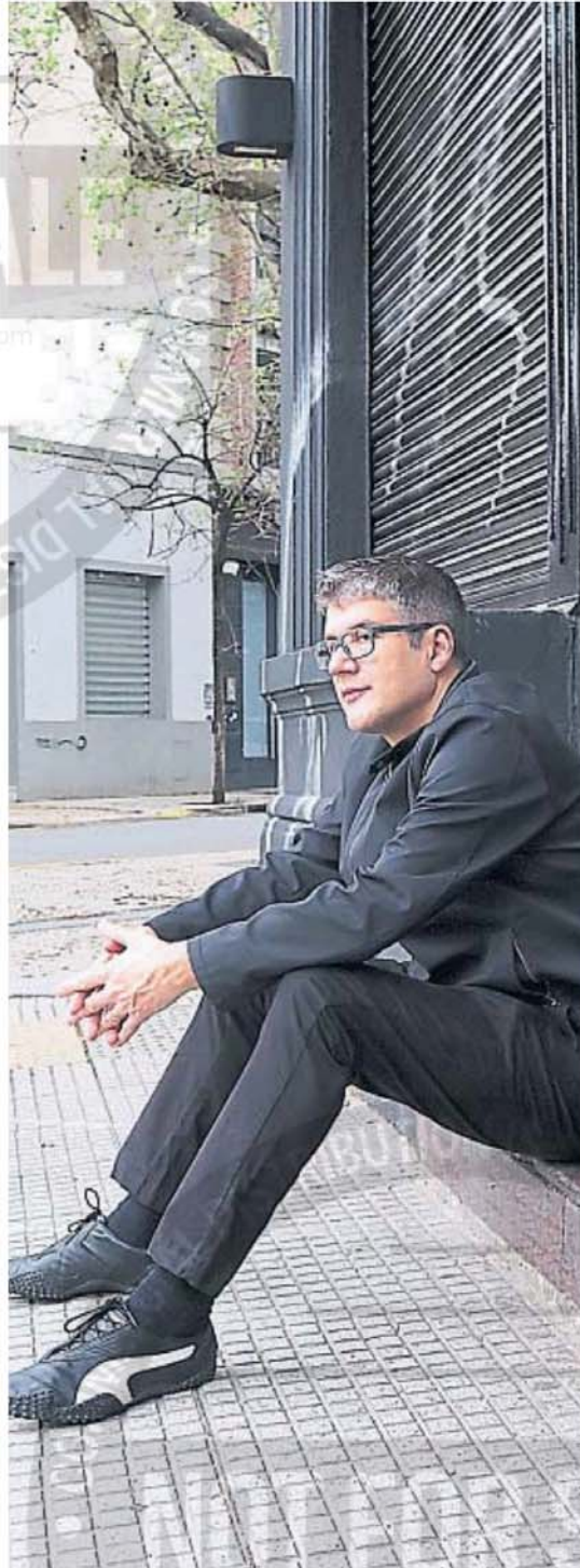
GIRO. Para Reynolds, la subcultura es hoy una forma de micropolítica o política local.

Con el tiempo, creo que la gente redescubrirá el trap realizado con Auto-Tune, será una de las cosas por las que recordaremos ese período con un sabor y vibración distintivos.