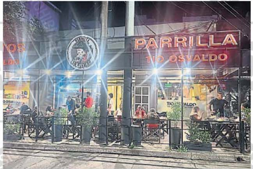
EN CARLOS PAZ. El local de Tío Osvaldo no pasa inadvertido y abre hasta muy tarde en verano.

A pesar de ciertas cuestiones básicas sin protocolizar, como siempre el carisma y la predisposición al servicio suman valor y hacen olvidar estos detalles, pero lo cierto es que el ideal sería ir en busca de algo más profesio-