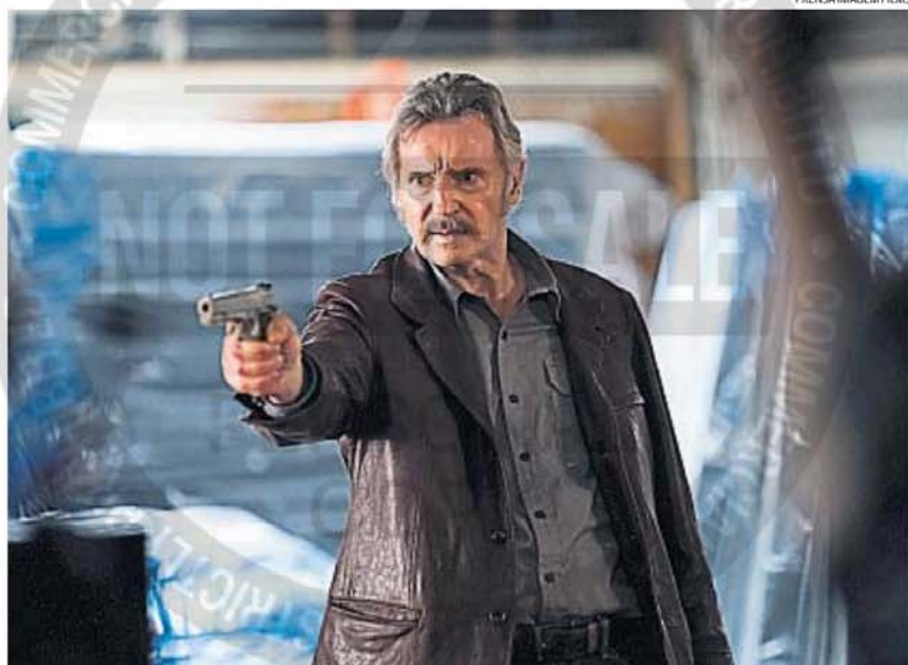
CLÁSICO. Liam Neeson se destaca en un papel que lo confirma como uno de los grandes referentes actuales del drama de acción.

ESTRENO. Dirigida por Hans Petter Moland, la película cuenta la historia de un exboxeador que lucha contra la vejez y los fantasmas de su pasado.