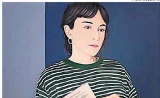
MUESTRA DE MAJO ARRIGONI. Forma parte de las exposiciones del museo Evita.

24, 25 y 31 de diciembre, y 1° de enero, cerrado.