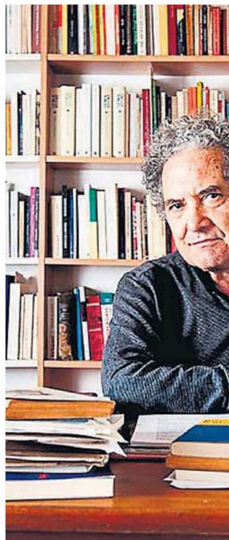
RICARDO PIGLIA. El escritor y crítico literario murió en Buenos Aires, el 6