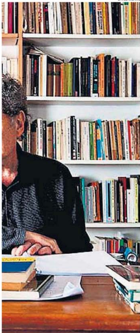
de enero de 2017.

padres le anuncian que se van de Adrogué, a los 16 años, pierde el control y empieza a escribir su diario. Cuando ocurre lo del premio Planeta y se va a Estados Unidos, eso abre una nueva era de su escritura. O la enfermedad, que es la pérdida de control más radical, y termina de darle forma a Los diarios de Emilio Renzi , que a mi