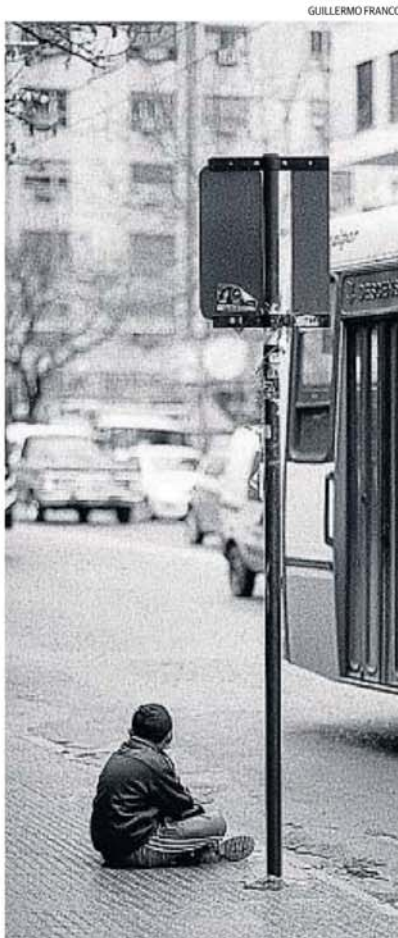
MUESTRA DE GUILLERMO FRANCO. Son 90 imágenes en blanco y negro, tomadas en la ciudad de Córdoba.

Juliana Rodríguez | jrodriguez@lavozdelinterior.com.ar