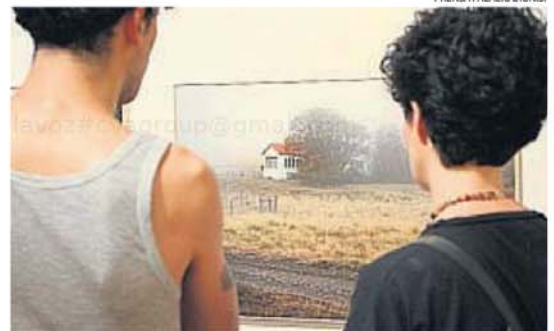
MUSEO PALACIO DIONISI. Tiene varias muestras de fotografía todo el verano.