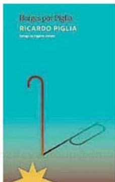
Borges por Piglia Ricardo Piglia

Luego de la cumbre alcanzada con Los diarios de Emilio Renzi y a siete años de su muerte, libros de y sobre Ricardo Piglia siguen sumando piezas a un rompecabezas delirado, que el insoslayable autor argentino previó en buena medida para su continuidad póstuma. 2024 vio la publicación de textos que iluminan facetas de Piglia contiguas a la del escritor, como la del crítico, el intelectual o el conferencista, siempre laboriosa y coherentemente entrelazadas y que, al mismo tiempo, abarcan épocas diversas de su mitologizada biografía.