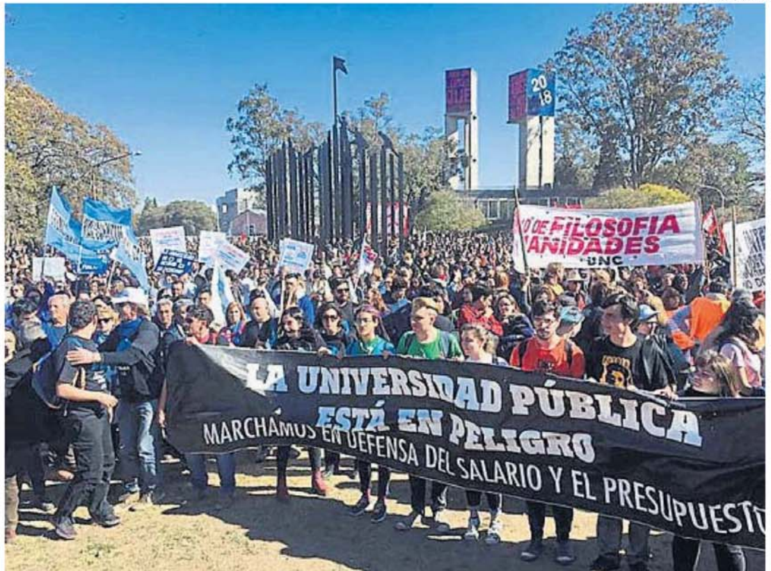
UNIVERSIDADES. 2024 fue un año de marchas y reclamos de los sectores universitarios, que pidieron actualizaciones salariales y presupuesto.

La misma entrega de soberanía y patrimonio, la misma ausencia de legalidad y legitimidad, se cocinan otra vez, acá y ahora. La llamada poli-