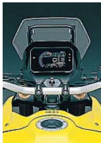
TABLERO. Cuenta con una pantalla TFT en color con mucha (y muy bien presentada) información.

El ancho manillar de aluminio es otro aspecto que colabora con su buena postura de manejo. Las piñas de mandos son sencillas, sin el habitual exceso de botones. Cuenta con pantalla TFT en color con mucha información. Todo se puede comandar utilizando dos botones en la piña izquierda. Incorpora una útil toma USB en el lateral del cuadro y una práctica visera que mejora su visión. La iluminación es full led, con dos pequeños faros superpuestos en el frontal, e intermitentes con soportes rígidos.