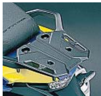
VIAJERA. Viene de serie con soporte de maletas lateral y trasero.