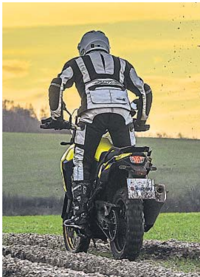
PISADA. Se equipa con llantas de radios de 21" de diámetro delante y 17" detrás, para uso con cámara. Los neumáticos cuentan con dibujo netamente asfáltico.

La Suzuki V-Strom 800 es una moto singular, una "DR 800" del futuro. Con un precio de U$S 26.900, un fantástico manejo, una estética vintage y una técnica de primer orden, a la V-Strom 800 DE no le faltan argumentos para competir en el reñido mercado de las trail bicilíndricas con tendencia salir del asfalto.