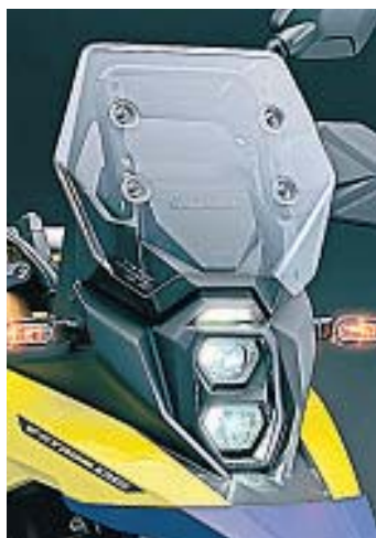
LUZ. La iluminación es full led, con dos pequeños faros superpuestos en el frontal e intermitentes con soportes rígidos.