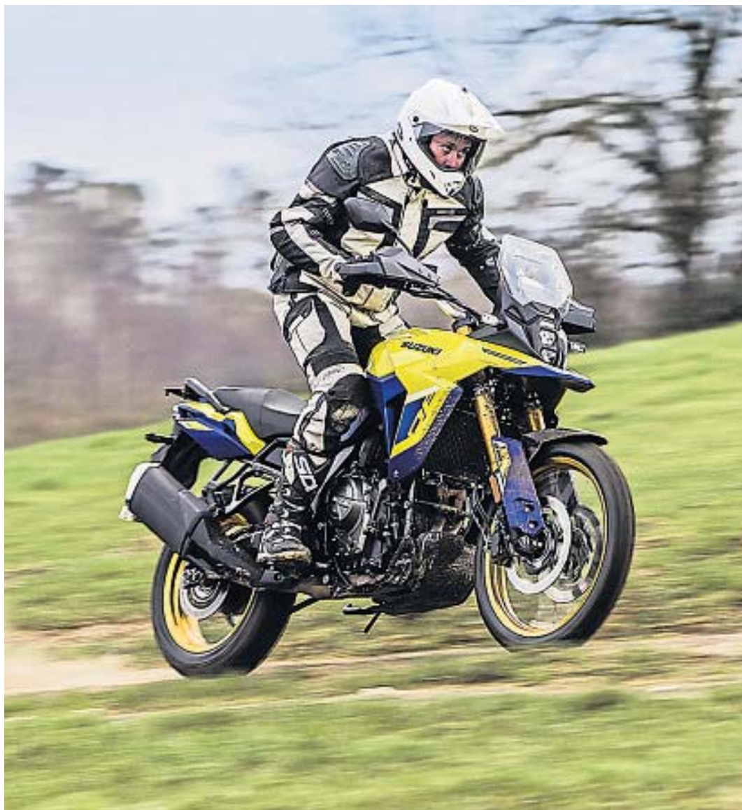
TIERRA. La V-Strom 800 es una moto que permite conducir parado en los pedalines de manera natural y posibilita la desconexión total del control de tracción en tramos de tierra.

Al igual que sucedió con la Suzuki DR 650 cc, la marca apostó por un concepto clásico de moto, manteniendo la esencia pura de dos ruedas con grandes aptitudes para afuera del pavimento pero también apta para la ciudad. En lo estético no está lejos de las motos Maxi Trail de finales de los 80. De hecho, la V-Strom 800 tiene cierto parentesco con la Suzuki DR-Big 800 de hace 35 años.