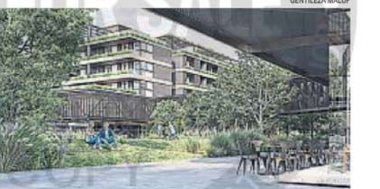
PROYECTO. Está pensado para adaptarse a las demandas actuales, ofreciendo viviendas diseñadas con innovación y materiales sustentables.

Está pensado para adaptarse a las demandas actuales, ofreciendo viviendas diseñadas con innovación y materiales sustentables.