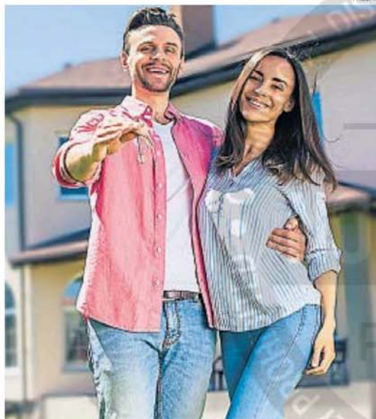
2024. El balance fue positivo en crecimiento del crédito privado, pero el camino hacia un desarrollo sostenido requiere equilibrio, compromiso y visión de largo plazo.