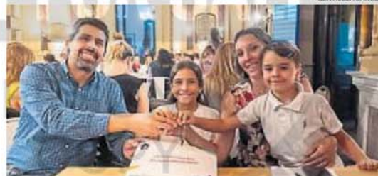
OPORTUNIDAD. La transición hacia la estabilidad permite construir un sistema financiero más inclusivo, resiliente y orientado al futuro.

al sector público. La recuperación fue más notoria en países con metas de inflación y, en menor medida, en aquellos con tipo de cambio fijo. El Banco Mundial prevé que América Latina crecerá 2,6% el año que inicia. En países donde el acceso al crédito sigue siendo limitado, la expansión de líneas accesibles y transparentes puede convertirse en un motor de inclusión social y desarrollo económico.