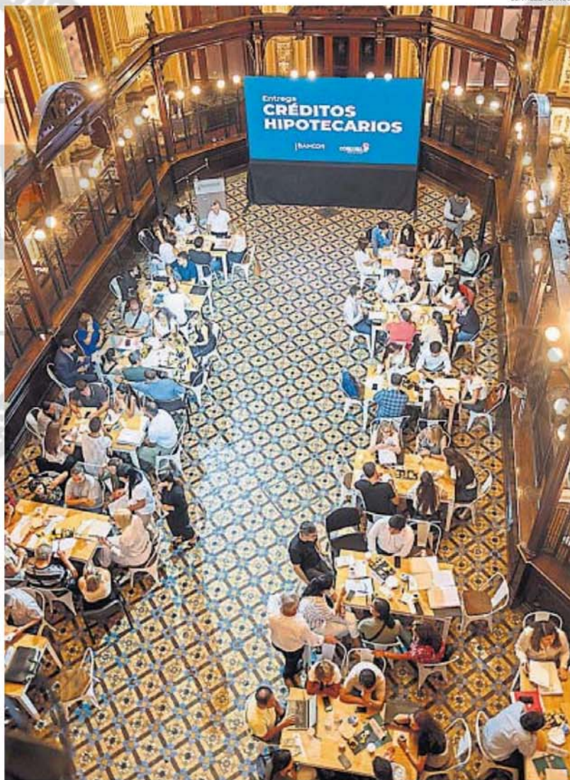
BANCOR. Durante un acto general realizado en la casa matriz del Banco de la Provincia de Córdoba, la entidad anunció que alcanzó los 957 créditos hipotecarios otorgados desde el lanzamiento de esa línea en mayo del año pasado.