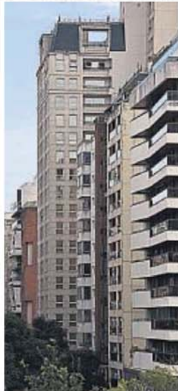
DEPARTAMENTOS. Presentan un panorama variado por sectores.

En lo que es tierras, el especialista afirmó que el panorama no está tan claro y que los precios no subieron en la misma proporción en que lo hicieron otros productos.