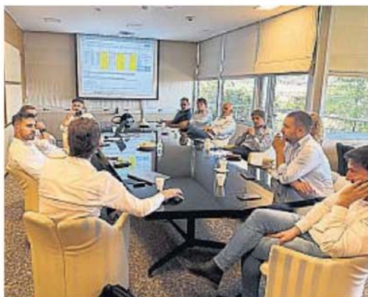
ANÁLISIS. Los expertos hicieron un balance del año que termina y trazaron perspectivas hacia 2025.

"De cara a 2025, se vienen lanzamientos y proyectos nuevos, con lo cual la expectativa es de una mejora gradual para el año que viene, sin grandes sobresaltos ni altibajos, en el contexto de una macroeconomía más ordenada", anticipó el especialista.