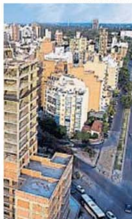
TESTIGO. Nueva Córdoba sigue siendo una referencia emblemática para el mercado.