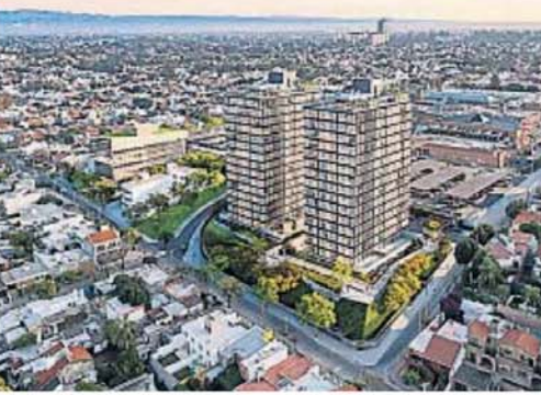
DUO. Un complejo de dos torres de departamentos con un bloque de oficinas en la zona del estacionamiento más bajo del Córdoba Shopping Center.

El diseño arquitectónico estará a cargo del Estudio ZAP, responsable de otros proyectos como Opera Luxury Condominium y Pocito Social Life. DUO adoptará un estilo americano para los departamentos, con dormitorios ubicados a ambos lados de un espacio común, como la sala de estar o el comedor. Esta disposición ofrece mayor privacidad en las áreas de descanso y optimiza los espacios sociales, adaptándose a las necesidades de familias, parejas y profesionales.