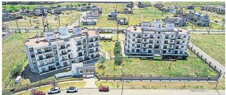
AVANCES. En 2024, Grupo Ecipsa inauguró un nuevo condominio Town de Urca dentro de Valle Cercano, y este año proyecta grandes inversiones en los seis países en donde opera.

Las estrategias de los desarrollistas pueden basarse en un modelo de negocios asociado a un único producto o focalizado en el (típicamente, un edificio de departamentos), o bien pueden apostar a diversificar el portfollio que ofrecen a sus clientes y también a alianzas con otros referentes y marcas de peso. En este contexto, de cara al año que comienza, el sector de real estate ofrece dos casos de interés que van en la línea de diversificar Carteras. Uno de ellos es Pily, que nació en 1976 en Santa Fe, con un sistema de ahorro en inmuebles mediante un esquema de cuotas. En 2004 trazó un plan estratégico para crecer en la Región Centro y llegó a Córdoba en 2006, donde con el tiempo diversificó productos apuntando a distintos formatos: así, ya lleva entregados 21 edificios, 1.600 viviendas y mil lotes. Sólo en 2024 llevó adelante tres entregas por 18 mil