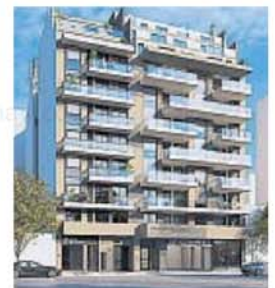
PH. El primer proyecto aprobado con esta tecnología es un desarrollo de Betania.