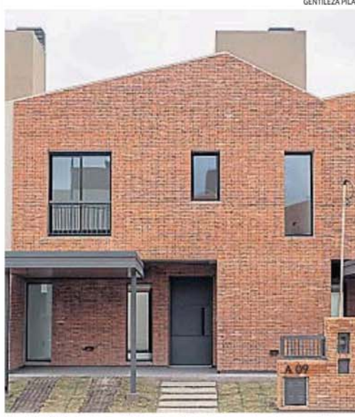
VERBENAS. En total, prevé 159 casas en cinco etapas, por lo cual ese complejo tiene para 3 años más de desarrollo.

En 2024, Ecipsa inauguró un nuevo condominio Town de Urca dentro de Valle Cercano: Town de Urca II, un complejo cerrado de 32 departamentos con amenities dentro de Valle Cercano, el emprendimiento que la desarrollista lleva adelante en la zona sur de la ciudad. Con una inversión de más de 2.200 millones de pesos, ese proyecto se suma a los más de 880 lotes y casas entregados en Valle Cercano en el marco de un masterplan de 110 hectáreas, que contempla el desarrollo por etapas y donde ya viven más de 600 familias.