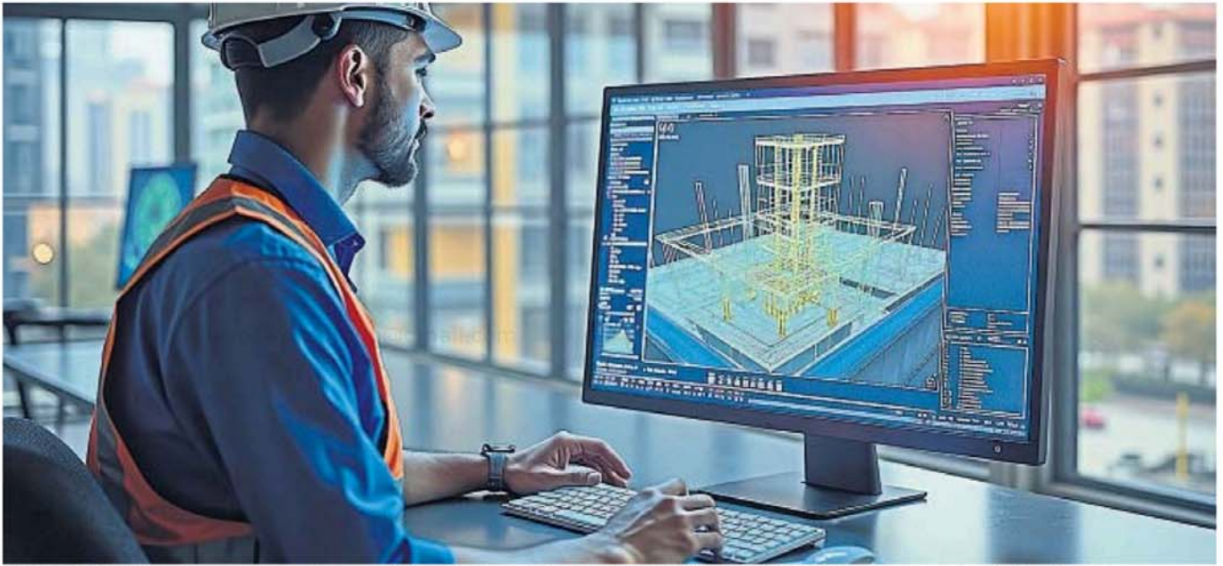
PROGRAMA. El Model Checker es un software que permite a los profesionales matriculados comprobar el cumplimiento del Código de Edificación Municipal de sus proyectos de obras privadas en tiempo real.