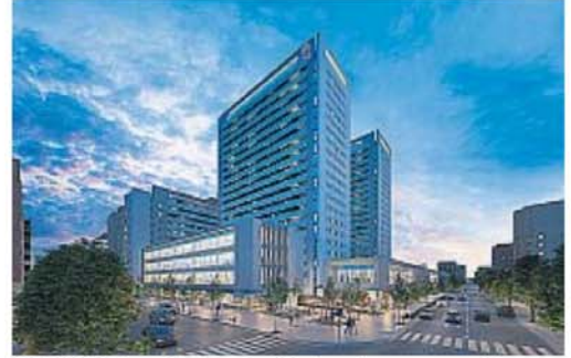
CARDINALES. Con un diseño arquitectónico innovador, apuntan a satisfacer necesidades prácticas y ofrecer un ambiente que inspire y mejore la calidad de vida.

Ubicados en puntos estratégicos de la Capital, estos desarrollos representan, más que un lugar donde residir, un entorno de confort con servicios que facilitan el bienestar y el estilo de vida. Cada torre dispone de una infraestructura robusta con amenities premium, que incluye gimnasios totalmente equipados,