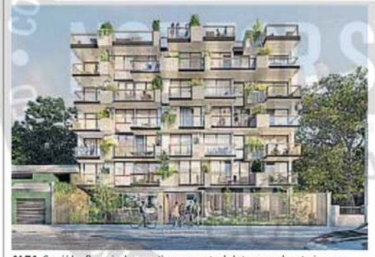
ALZA. Creció la afluencia de argentinos respecto de la temporada anterior y se revalorizó la plaza entre inversores tanto como en personas interesadas en vivir allí.

En conclusión, el sector inmobiliario mostró un interés renovado de inversores argentinos en Uruguay, quienes aprovecharon oportunidades en propiedades (principalmente en Maldonado, Rocha y Montevideo), dado que ese país cuenta con la ventaja de ser tradicionalmente más estable y seguro (tanto a nivel político como económico) que Argentina.