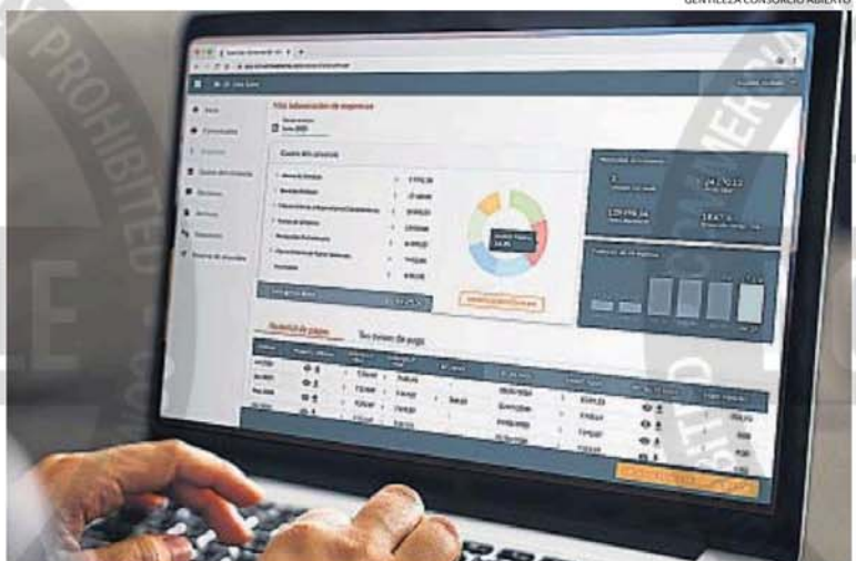
AVANCE. El uso de herramientas tecnológicas ha cambiado radicalmente la manera en que se gestionan los consorcios.

Villa Cabrera Facundo Quiroga 2880 Alio 3 Dor 2 Baños 300 terr 950.000 Otras Nores 3516626284 codigo-web:5431792