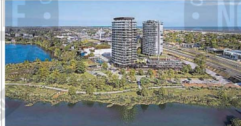
FACTORES. Desarrolladores inmobiliarios destacan mayor interés de argentinos en invertir en Uruguay, alentados por la reducción de la brecha cambiaria, los niveles de rentabilidad y los beneficios fiscales que ofrece el país vecino.

Los desarrolladores uruguayos destacan que las consultas de argentinos para invertir en esas orillas se multiplicaron este verano, alentadas por una temporada que proyecta ser récord y que ya llevó cerca de 600 mil visitantes, de los cuales casi el 50% viajaron desde nuestro país gracias al achique de la brecha cambiaria y los beneficios fiscales que les ofrece el vecino.