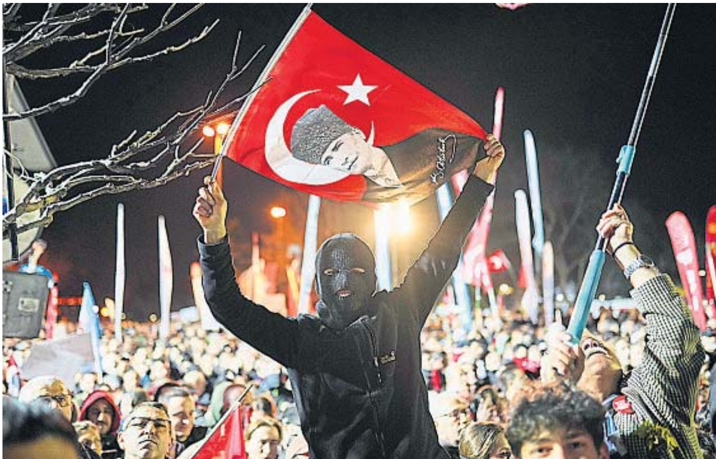
PROTESTAS. Miles de personas salieron a reclamar por la detención del alcalde de Estambul, Ekrem İmamoğlu.