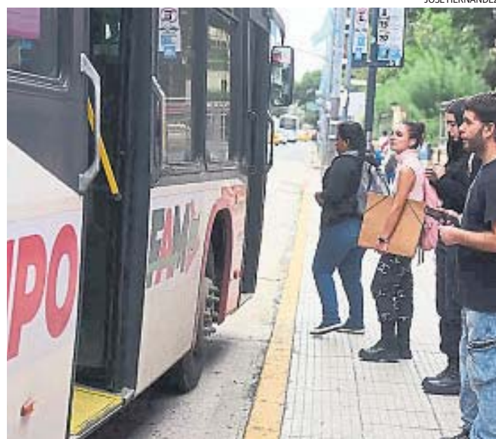
EN LA PARADA. El servicio de transporte urbano sigue sumando reclamos.