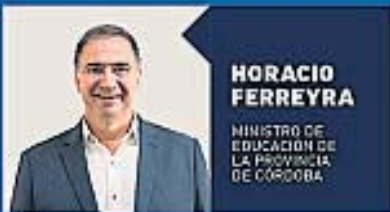
HORACIO FERREYRA MINISTRO DE EDUCACIÓN DE LA PROVINCIA DE CÓRDOBA