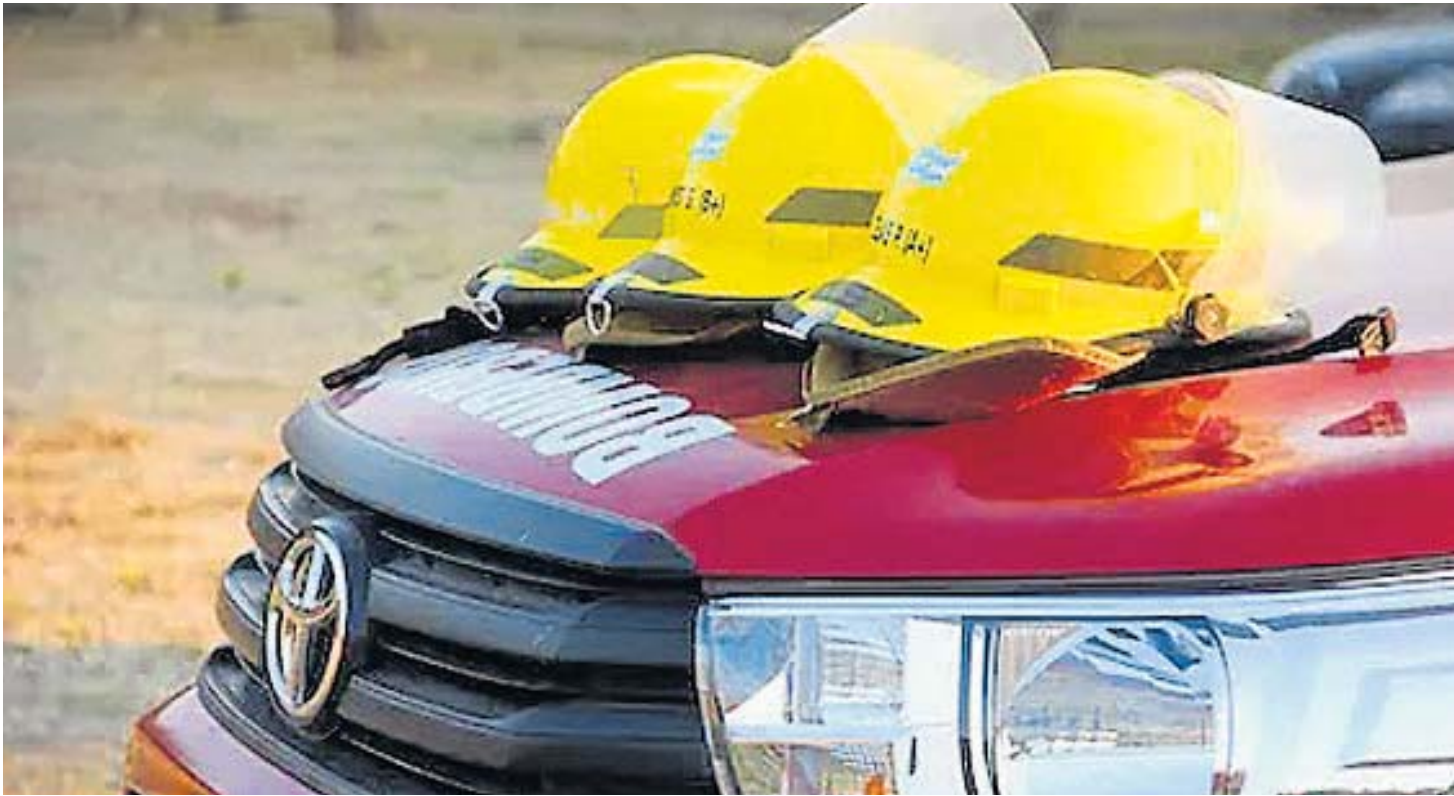
BOMBEROS VOLUNTARIOS. Atienden múltiples urgencias en todo el interior: incendios, choques graves, rescates y búsquedas de personas, emergencias climáticas y más.