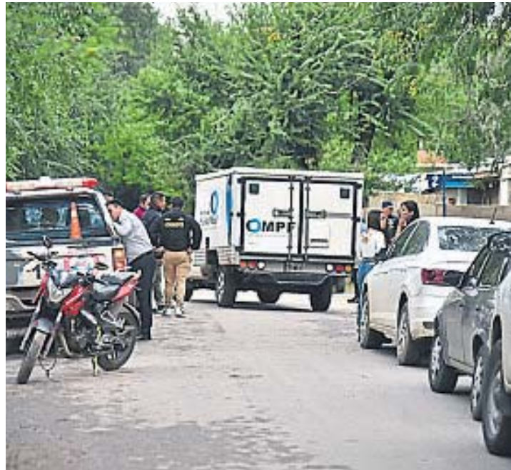
UNQUILLO. El sitio donde fue hallada la mujer sin vida. La casa estaba en desorden.

ción confirmaron que el hecho habría ocurrido alrededor de las 14, y que en la casa se halló un notorio desorden. En el inicio de la investigación, a cargo de la fiscal de Violencia Familiar y de Género Natalia Aguirre, las sospechas apuntan a la pareja de la joven. La Fiscalía confirmó que un hombre de 33 años fue detenido. El sospechoso fue atendido en un hospital cercano, con signos de algún tipo de violencia en su cuerpo. La causa se investiga bajo un marcado hermetismo, aunque los primeros datos indicarían que la mujer habría fallecido por estrangulamiento. La casa está ubicada en calle