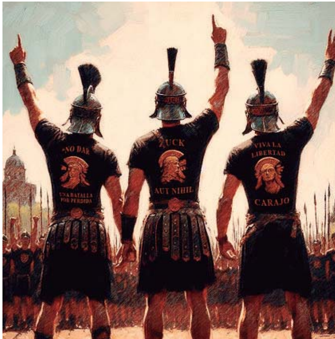
ILUSTRACIÓN DE OSCAR ROLDÁN

Pero invocar ese pasado para defender una determinada cosmovisión en el presente suele ser un ejercicio rentable en términos políticos. En cualquier caso, esa evocación del pasado suele ser casi siempre, y según para quién, un jugoso espejismo. Pero no es una lección de Historia.