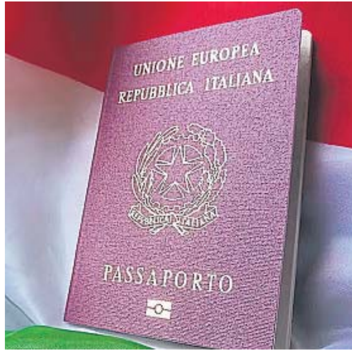
DOCUMENTO. El pasaporte italiano, derecho para descendientes por vía sanguínea.

sados en iniciar o seguir un trámite de ciudadanía solo serían atendidos por correo electrónico.