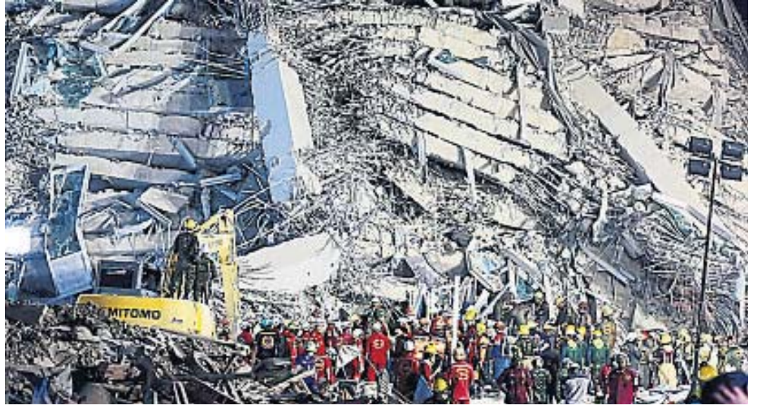
IMPACTO. Un edificio colapsado en Naypyidaw, la capital de Myanmar, el país más afectado por el fuerte sismo de grado 7.7.