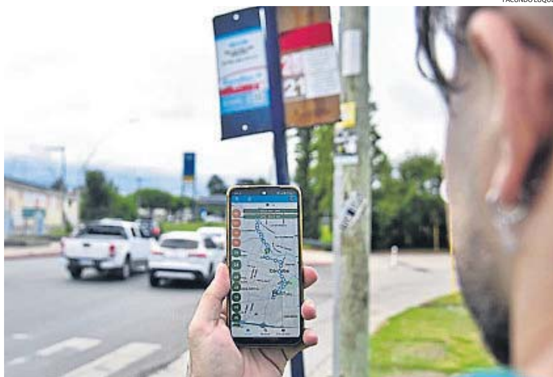
POR EL CELULAR. La aplicación para teléfonos móviles Tu Bondi es una herramienta valorada por la mayoría de los usuarios.

Entre las novedades se incluyó la integración con BiciCba, permitiendo