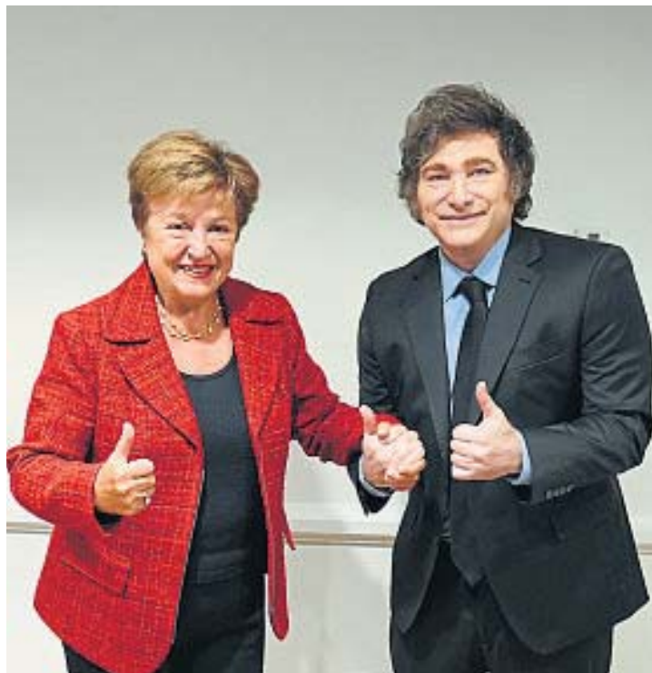
PULSEADA. Milei y la titular del FMI, Georgieva. A la discusión le faltan semanas.

Sin embargo y pese al disgusto manifestado en las redes sociales, ningún integrante del equipo económico contestó los continuos requeri-