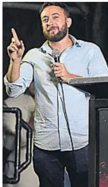
AGUSTÍN LAJE. Elegido por el Gobierno para dar su visión de la dictadura.

de un gobierno. Todo quedaba para las calendas griegas.