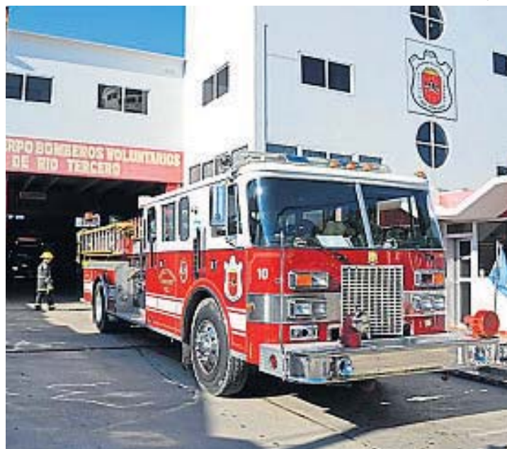
RÍO TERCERO. El cuartel limitó el uso de sirenas tras las trágicas explosiones de 1995.

sas, los jefes coinciden en que la mayoría sigue usando la sirena. Sin embargo, algunas localidades (sobre todo las de mayor tamaño, donde la llegada de las sirenas se relativiza) han implementado cambios con resultados positivos.