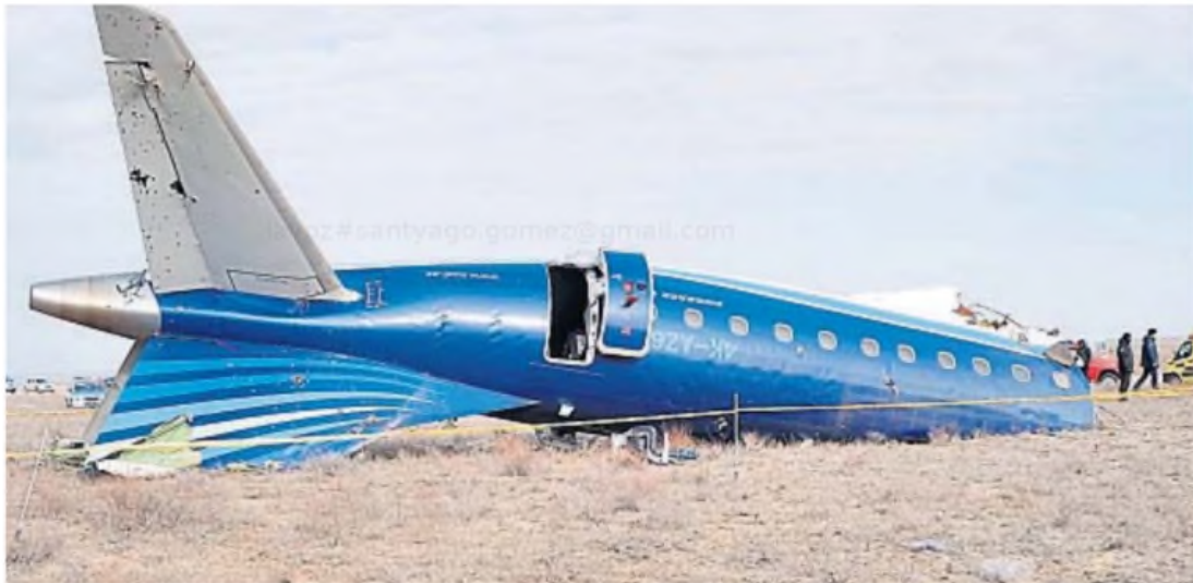
DOLOR. Los restos del avión de Azerbaijón Airlines que cayó en Kazajistán causando la muerte a 38 personas y heridas a otras 29. Un misil ruso podría ser la causa de la tragedia.