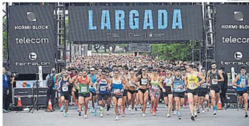
LA ÚLTIMA. En 2022 se corrió la anterior edición, con alta convocatoria, aunque generó algunas críticas de competidores.

EVENTOS. Se hizo en 2021 y 2022, pero luego no se repitió una competencia que congrega a miles de visitantes. Será el 6 de julio.