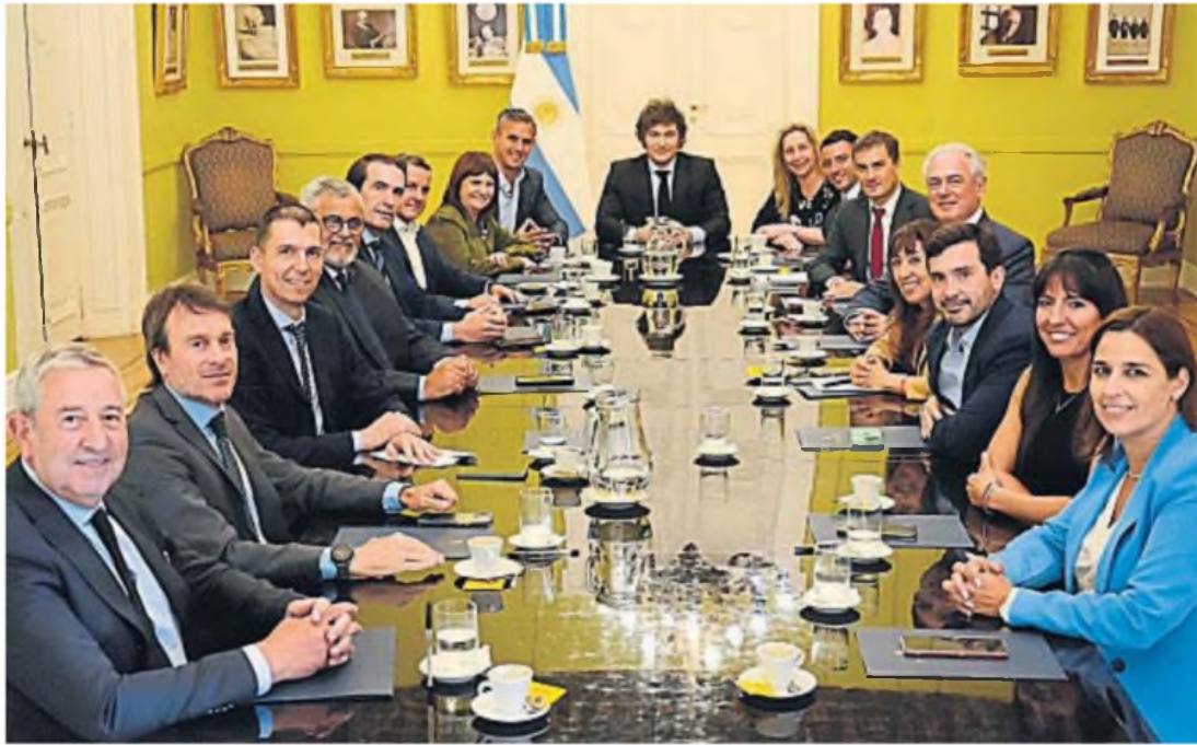
CON MILEI. Fueron 13 los diputados del bloque radical que se reunieron con el presidente Milei y su hermana Karina. La reunión se extendió por casi tres horas.