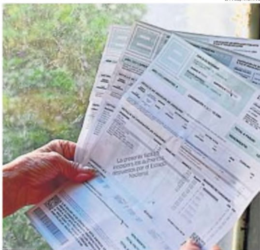
PRIMERO DEL AÑO. El incremento impactará desde el arranque de 2025.

TARIFAS. Es el resultado de la fórmula de actualización mensual correspondiente a diciembre publicada por Estadística de Córdoba.