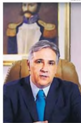
MARTÍN LLARYORA , El gobernador apoya la ley de ficha limpia

Eso es positivo. No obstante, para que sea real y no un mero espejismo, debe sanear primero su Poder Judicial para que este sea independiente del poder político, y así tener vigencia efectiva.