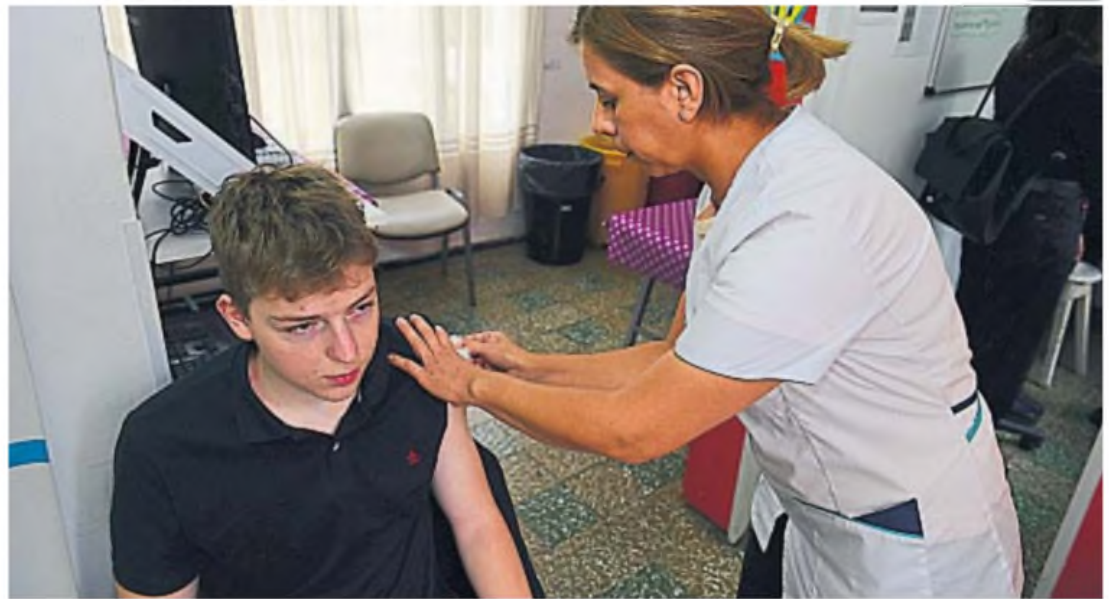
GRUPOS DE RIESGO. Entre quienes fueron internados por dengue el año pasado, y tienen la vacuna gratis, concurrió sólo el 30% de los notificados en Córdoba.

La firma Takeda manifestó a este diario que realiza las entregas de las dosis al sector público por un lado, de acuerdo a los compromisos asumidos, y a droguerías y vacunatorios por otro. Sin embargo, reconoció que es posible que en algunas farmacias la disponibilidad esté comprometida por la alta demanda, lo que produce retrasos en las entregas.