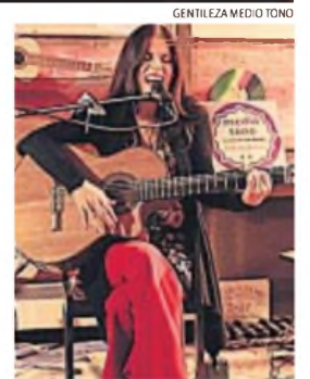
GRILLA. El perfil de la música es variado en Medio Tono