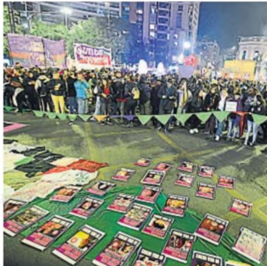
NI UNA MENOS. Los colectivos feministas se movilizan en contra de la violencia