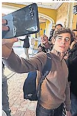
FRANCO COLAPINTO. Mientras descansa, lo espera un 2025 desafiante.

Es algo similar a lo que hizo con el francés Esteban Ocon, a quien colocó como piloto de reserva en Mercedes durante su etapa en el equipo alemán. "Ya hice esto antes con Esteban, cuando se tomó un año sabático.