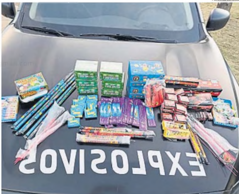
MÁS CONTROLES. Para Año Nuevo, los inspectores de la Municipalidad de Córdoba realizarán controles junto con la Policía.

A través de la línea 103, la Municipalidad de Córdoba recibió en los últimos días más de 400 denuncias por veta de pirotecnia en la ciudad.