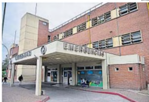
INTERNADO. El pequeño de 9 años permanece atendido en el Hospital de Niños.

El pequeño había ingresado al centro de salud con un traumatismo facial secundario, con fracturas en el maxilar inferior, piso de la órbita, piso de la boca, lesión en los labios y avulsión en un tercio de su lengua.