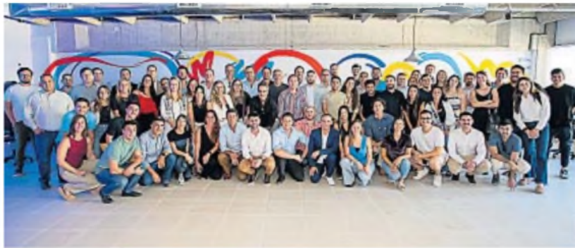
EMPRENDEDORES. La Agencia cordobesa reunió a las "startups" apoyadas por sus diferentes programas de financiamiento.