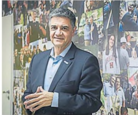
MACRI. El alcalde porteño realizará anuncios para blindar Caba del avance de LLA.

Detrás de la decisión del jefe de Gobierno hay una estrategia del PRO nacional: blindar el distrito porteño gobernado desde 2007 por el PRO, como una manera de preservar la identidad partidaria ante el avance nacional libertario. Entienden, además, que este movimiento de "politi-