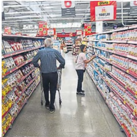
OCTUBRE. El consumo en los supermercados bajó ese mes respecto de septiembre.

una luz amarilla porque profundizó la contracción de 0,4% que se había producido con relación a agosto. A su vez, las ventas en shopping centers mostraron en octubre una baja a precios constantes (volumen) de 7,8% en comparación con igual período de 2023. En tanto, las ventas en los autoservicios mayoristas se desplomaron 23% en forma interanual y tuvieron un avance de 2,1% con relación a septiembre de este año. Los datos corresponden a informes distribuidos ayer por el Indec. Los indicadores oficiales reavivan la discusión acerca de la disociación que existe entre los resultados macroeconómicos y lo que está sucediendo en la economía real.