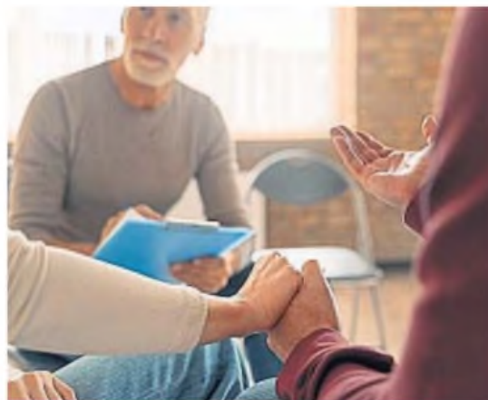
Estos espacios están abiertos para cualquier persona que esté atravesando una situación que requiera apoyo, información o ayuda.

La Municipalidad de Córdoba dispone de estos espacios para los vecinos que lo necesitan. El primer paso hacia el tratamiento de estas problemáticas es animarse a buscar ayuda personal o para otros.