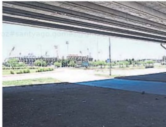
ESTADIO. Una de las playas ocupará el espacio libre bajo el viaducto del Kempes.