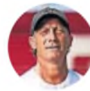
Pedro Troglio Director técnico de Instituto

"Respondimos la invitación de Milei a revisar en conjunto las deudas que nos deja este 2024 y los desafíos que plantea el 2025. Somos dialoguistas y creemos en el consenso".