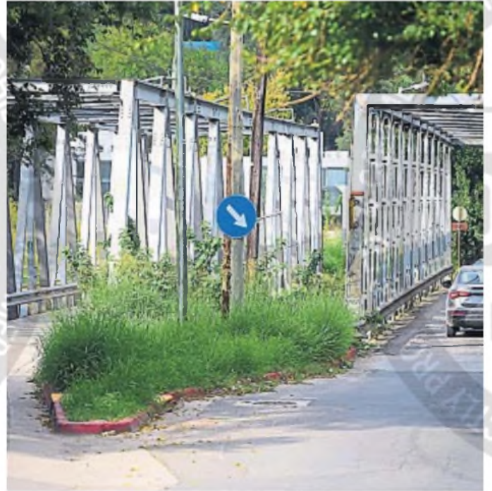
UN YUYAL. Tras las últimas lluvias, los yuyos y las malezas proliferan en distintos puntos del barrio