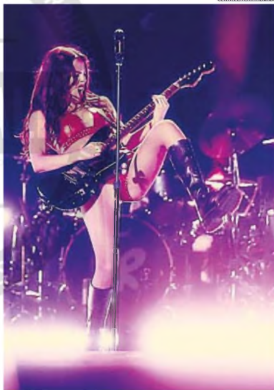
POP & ROCK. Olivia Rodrigo ofreció un show muy al palo en Lollapalooza Argentina.

En sus comienzos, Lollapalooza fue alternativo de verdad, en el sentido de que Perry Farrell, su fundador, lo convirtió en plataforma de visibilización para cuestiones ignoradas por la agenda gubernamental estadounidense de los '90. Hablamos de sostenibilidad ambiental, salud reproductiva y firme oposición a las intervenciones armadas. Convertido en evento transnacional, esos ítems quedaron relegados en favor del entretenimiento millennial , aunque nunca desaparecieron. Por lo expuesto, precisamente, no deberían sorprender los posicionamientos que se produjeron en la 10ª edición del Lollapalooza Argentina por parte de Dum Chica, BB Asul y del cordobés Iuan López. El trío garagero fue el más viralizado por la