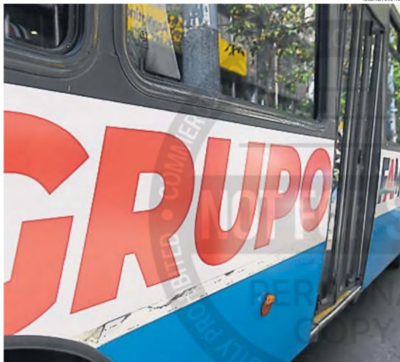
UNIDADES. Varios colectivos de Fam están recién pintados por fuera, pero presentan muchas deficiencias en su interior.