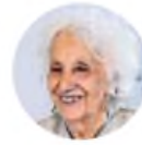
Estela de Carlotto Presidenta de Abuelas de Plaza de Mayo

"Es un año importante. No sé si conseguiremos defendernos de la situación gubernamental que tenemos. No queremos sacar o echar a un presidente. Queremos que el Presidente haga y diga lo que corresponde y no otras cosas".