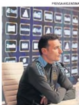
LIONEL SCALONI. "Brasil es una de las selecciones más grandes", dijo ayer el DT.

Nota: 6 primeros van directo, 7 a repechaje