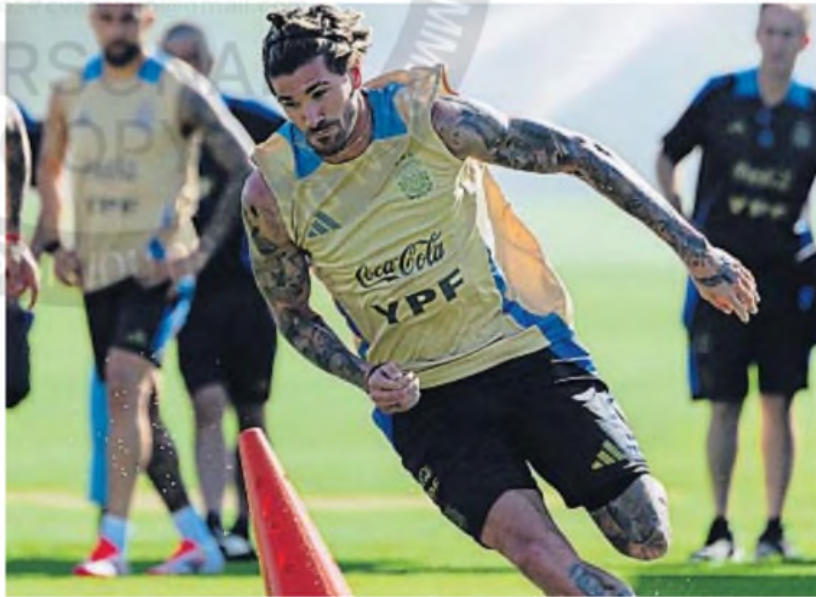
RODRIGO DE PAUL. El mediocampista, referente y motor de la selección albiceleste, volverá a la titularidad hoy contra Brasil.

Para Argentina se presenta también el desafío de volver a ganarle al