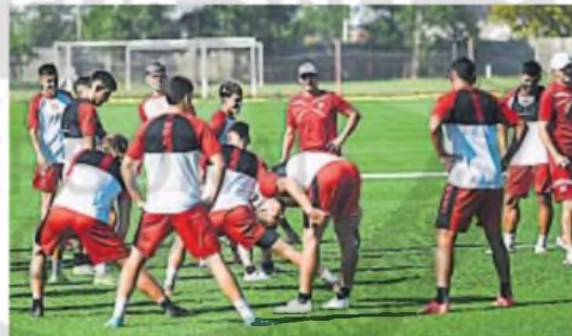
A MEJORAR. La Gloria lleva una racha de siete partidos sin ganar

"Lo voy a pensar tranquilo. No voy al nivel de la gente. Voy al ritmo. Algo seguramente cambiaré para mover algún nombre y poner gente que venga fresca desde la crítica, que esté más aliviada", explicó