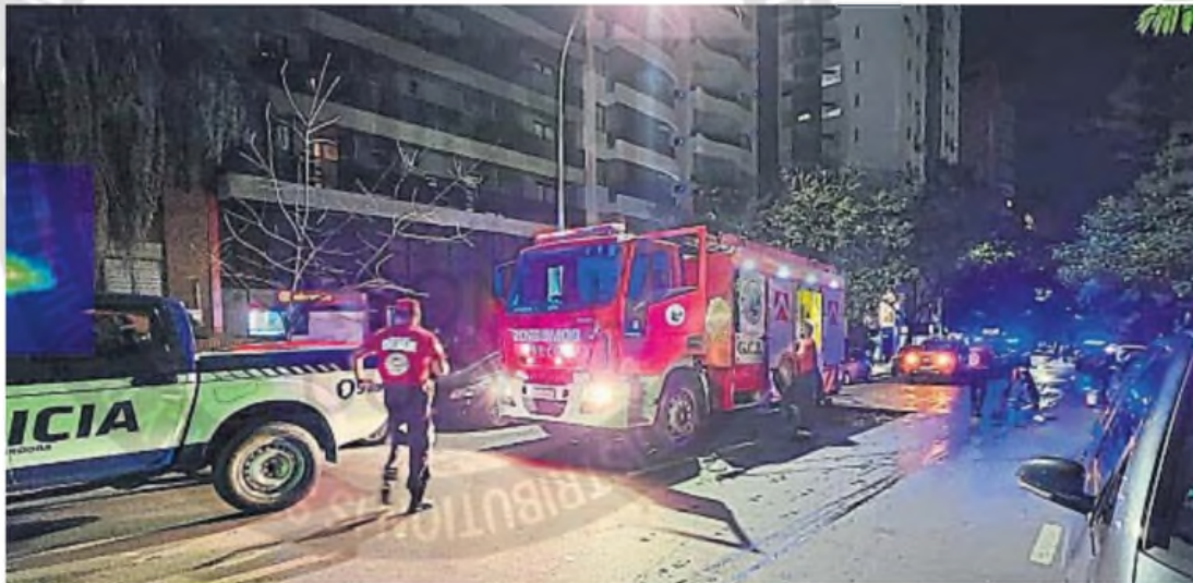
EN ALTURA. En los últimos meses, se han registrado varios incendios en edificios de la ciudad de Córdoba, lo que motivó la conformación de una mesa de trabajo en la materia.