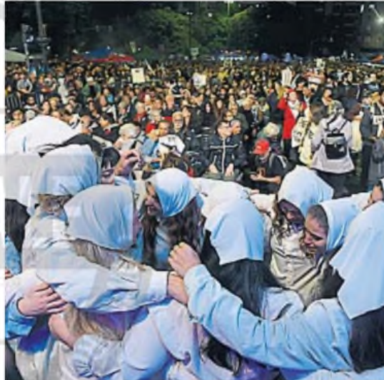
MASIVA. Pese a la lluvia de ayer, la convocatoria fue importante en la Capital.

"Frente a la crueldad y a la impunidad, la memoria nos une por un país