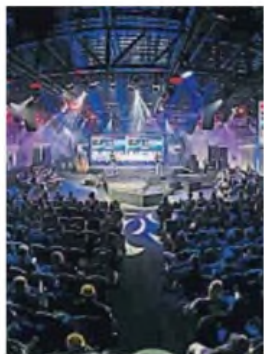
REGIONAL. El beneficio anunciado alcanza a los clientes cordobeses.

"STREAMING". DirecTV Latinoamérica anunció la incorporación de la conocida plataforma "on demand".