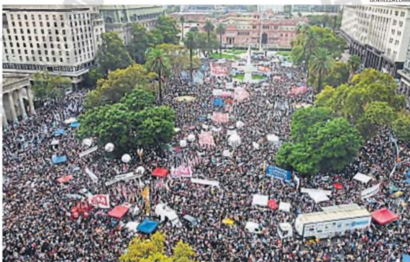
REPLETA. La Plaza de Mayo estuvo colmada de manifestantes que pidieron seguir con la lucha de "verdad, justicia y memoria".

Por su parte, el diputado José Luis Espert, uno de las principales figuras de La Libertad Avanza, consideró que el 24 de marzo debería dejar de ser feriado nacional. "Demostremos la página con esto. Basta. Seguimos hablando del golpe de Estado casi