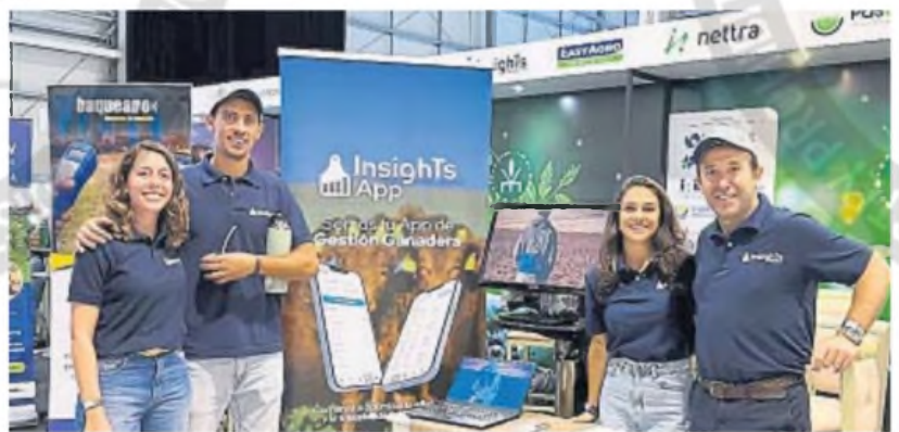
OBJETIVO. La firma de base tecnológica apunta a terminar 2025 gestionando 150 mil animales y mira hacia Uruguay.

Además, la plataforma ofrece la posibilidad de comparar los indicadores de productividad con otros establecimientos, identificando bre-