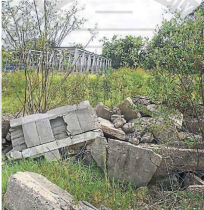
ESCOMBROS. En varios sectores hay bloques de hormigón de viejas obras que nunca fueron retirados