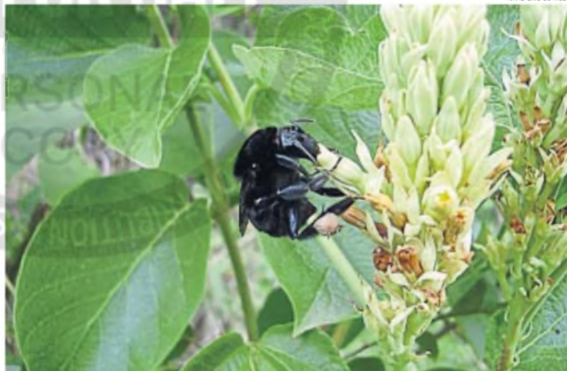
POLINIZACIÓN. Abejas y abejorros son responsables de la reproducción de muchas especies vegetales en las sierras de Córdoba.

El estudio de los investigadores cordobeses analizó que la pérdida de hábitat disminuye la cantidad de polinizadores y la calidad de la polinización. "Como resultado, tanto la producción de semillas, el éxito reproductivo femenino, como la dis-