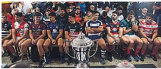
PRESENTACIÓN. Del Top 10 A y del Súper 9 de la UCR, con todos sus representantes.

Se realizó ayer en el Salón Presidente de Córdoba Athletic la presentación de los torneos Top 10 A y Súper 9 de la Unión Cordobesa de Rugby, certámenes que darán comienzo el próximo fin de semana.