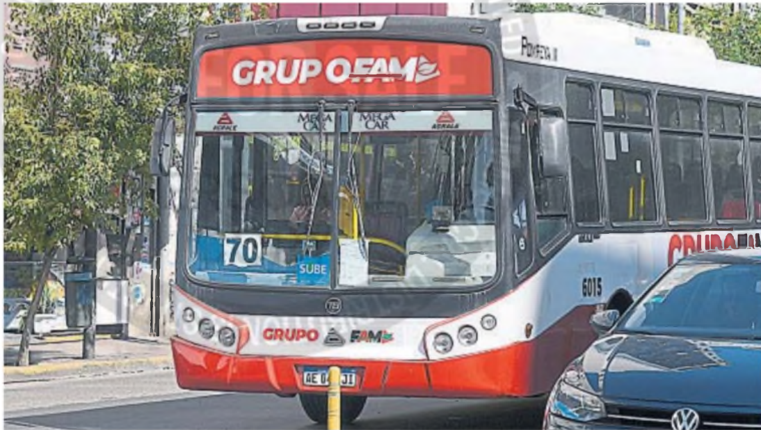
URBANOS. Usuarios de la ciudad de Córdoba reportan demoras recurrentes e inconvenientes en el servicio de los corredores que opera la empresa Fam.