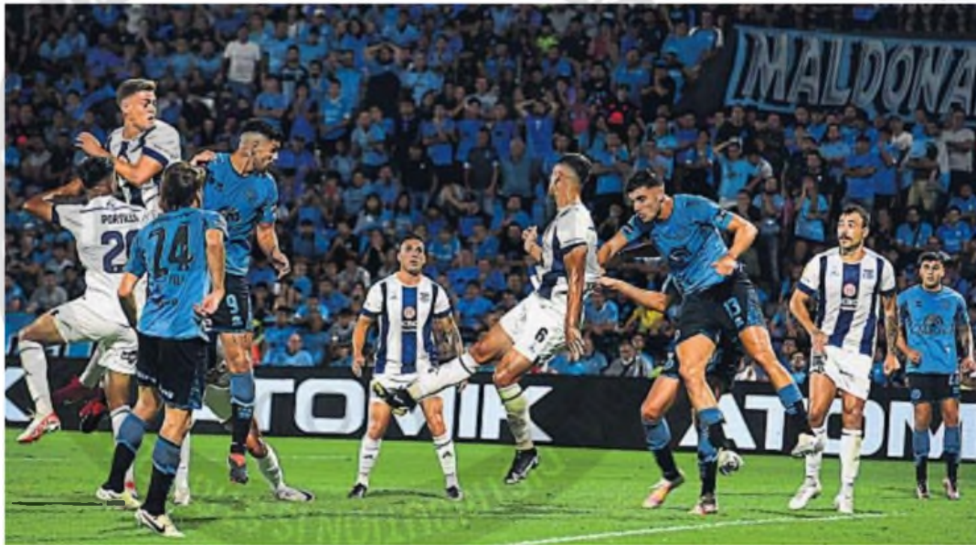
EN ALBERDI. Belgrano y Talleres jugaron por última vez el 25 de febrero del año pasado, cuando empataron 2-2 en un vibrante partido. Habrá varios protagonistas repetidos.

BELGRANO-TALLERES. El capítulo 405 del principal derbi de la provincia buscará quebrar o superar rachas de ambas partes y así escapar a las numerosas igualdades de las últimas temporadas.