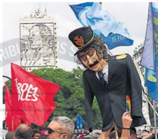
MILEI. El Presidente fue blanco de las críticas de quienes marcharon en Buenos Aires.