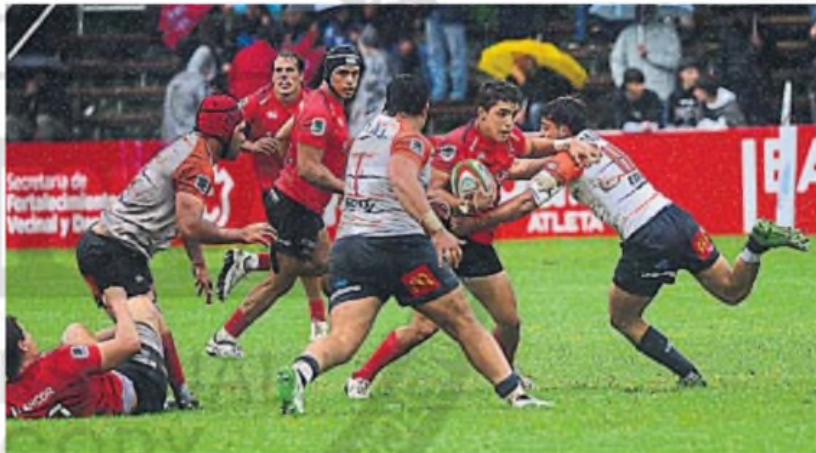
OTRA DERROTA. Las condiciones climáticas fueron adversas para los dos equipos, pero a los cordobeses les costó hacer pie.