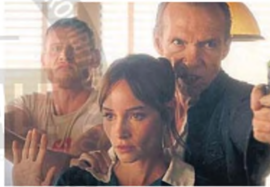
TENSIÓN EN ESCALADA. La película tiene una narración meticulosa y funcional.

Y no solo cumple con estos requisitos de la mejor tradición norteamericana, sino que también tiene la virtud de ser ingeniosa en la acumulación de problemas, además de ser sumamente entretenida, de esas películas que no sueltan ni un segundo. La icono-