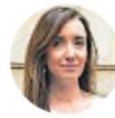
Victoria Villarruel Vicepresidenta de la Nación

"Es un año importante. No sé si conseguiremos defendernos de la situación gubernamental que tenemos. No queremos sacar o echar a un presidente. Queremos que el Presidente haga y diga lo que corresponde y no otras cosas".